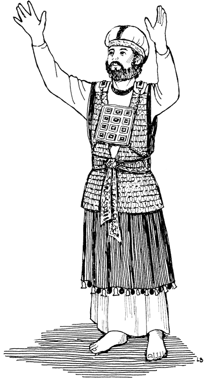
Yub ngulei' ro che'n men Israel (Heb. 9:25)

23 Kuze', naki'n ngut rë ma ze', no mixo ren che'n bima, par mimbe rë kwa'n nak nela tu xkal ga' che'n rë kwa'n nzho lo yibë'; per, par mimbe rë men xa' wei' Dios lo yibë', naki'n mixo ren kwa'n más tsak lo ren che'n rë ma, 24 porke nangayot Jesukrist le'n tu yo'yid kwa'n michao' ya' men, plo nzhab men lë dox nazhon, per nab tsa tu xkal nake che'n yado' yibë'; no nal yub pa' yado' yibë' nzho Me plo nina'b Me lo Dios por be. 25 Mbaino gat lë't garga'l mixo Jesukrist ren che'n Me, nela ngok kun rë ren che'n rë ma ga', or li'n kun li'n naki'n nguio rë ngulëi' ro par mixo bixa' ren che'n rë ma plo nzhab men lë dox nazhon. 26 No chi naki'n ngale' Jesukrist nela xmod nile' rë