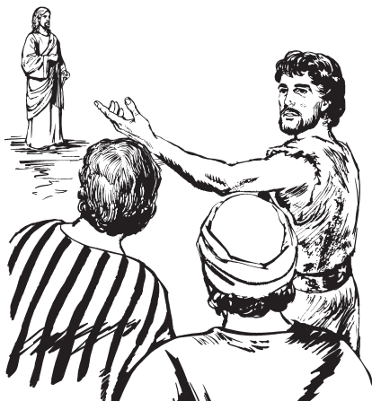
(San Juan 1:29)

—Ne benne anka neru to udhelha Tata Do Yebáha chi daa naa kini kuabie ka tulha ge ka benne se'e yiesi lo yu-ni. 30 Ge benne-ni nuha rinnea, tti ria: “Benne dabie delola danalhane netiha, benneha xxeniru ra lebie tti neti, kumu chila do benneha tti neti.” 31 Nigaba neti ttuha