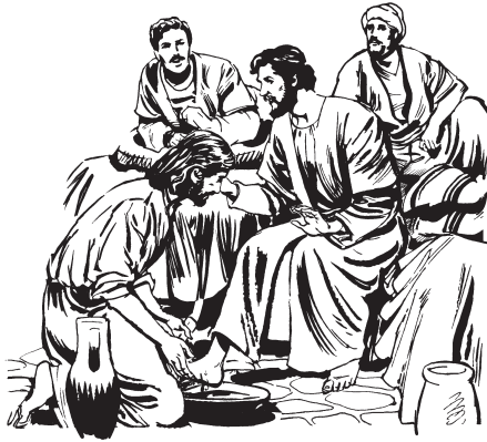
(San Juan 13:1-17)

4 de nuha nna loora se'eke go irseha, udú liie nna utuabie lari nukueha, nianna tti bedaxxue ttu lari bexxika lhe'ebie.