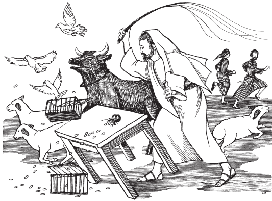
(San Juan 2:13-17)

23 Laka reki Jesús-ni lhe'esi Jerusalén-ni tti raka laní Pascuaha, ixé ka benne ugía leke gebie de bilákanie ka milagru runieha. 24 Ttaka kwinaba Jesús-ni labí ruxxen lebie geke, kumu chiba yue gasina ruin iyáke. 25 Labie labí riyasanie nuxa kixxi'ane gaxasina ruin ka benne se'e yiesi lo yu-ni kumu chiba yue gasina anka lhe'e lastoke.