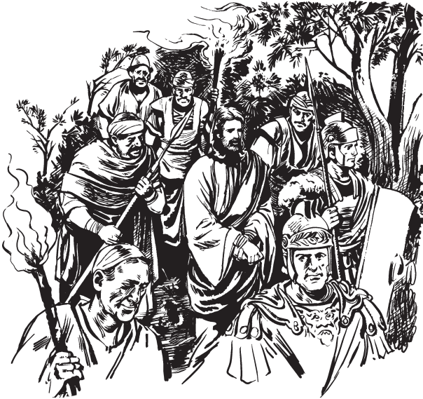
(San Juan 18:1-11)

yotuha lhe. Ka nuha udhelha ka nu loni ge ka bixxudiha kana lhe udhelha ka fariseo-ni kana. Diakana denkana espada lhe yaga lhe dengabakana ka lámpara lhe ya nalha gi lhe. 4 Ttaka kumu Jesús-ni chiba yubie iyá nu satebie, nianna biriabie gwatsee kana nna ree: