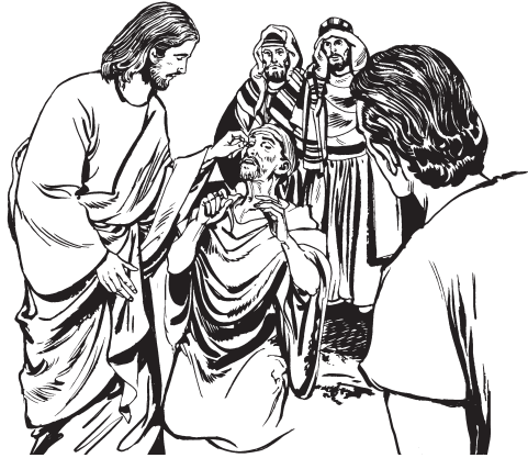
(San Juan 9:1-12)

—Labí ankana nu lo xua de bixa tulha benna, nigaba de bixa tulha ben ka tata nan geniha. Ankana aní kini eyoin Tata Do Yebáha na nna len nu unieha