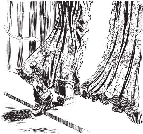
(San Marcos 15:38)

37 Jesús-ni nna uresi'e idisa, nianna utti ttebe. 38 Looraha nna bireda lari daa lhe'e yotuha, chubaa tí uka nuha biredana. Udulo xekini nna axtaba xani'ani bireda. 39 Soldadu nu baninna ttu gayua (100) ka soldadu ge Roma-ni, nuha duna gaxxaba arlo Jesús-ni nna tti biyieninna uresi'e lhe tti bilenna gasina uttie, nianna tti unnea, rana: