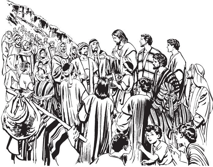
(San Marcos 6:30-44)

—¿Gasina tayo'otu nu go ka benne-ni? Ixeni belhiu iyasinri'i; ge chupa gayua (200) sá sina teeba nuha ise'e loo kini iyo'o nu go ka benne-ni.