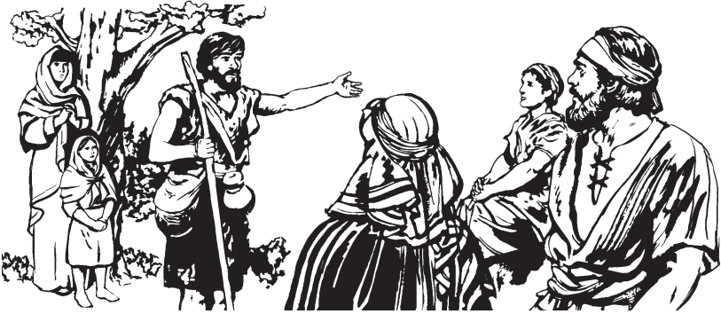
(San Marcos 1:1-8)

—Iki de neti nna si dala attu benne ra tsitsiru lebie attichula neti. Neti labí elha ralhaa iyettaa idhasia lo ka gwaracha geeha. 8 Gwalí galá neti tti rugadia le inda, suna indaba rixúti, ttaka benneha nna ugadie le Espíritu ge Tata Do Yebáha.