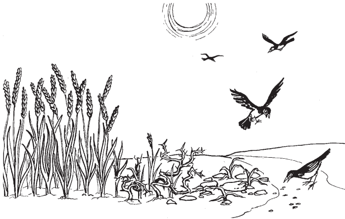
(San Marcos 4:1-20)

leke gatta geke, lhe anágaba lhe de ru'u xxatta leke ge adíru nu tee yiesi lo yu-ni, nuha-la rudoruna leke ruinke, de nuha nna richúbana lo ka tisaha. La'ania nna labí ruin ka tisaha sina lhe'e lastoke kini uin tseke. 20 Adíke nna ankake attiba ka xua ubinni lo yu tseha. Ka benneha nuha riyienkanie ka tisaha nna bedaxxuke ka tisaha. Laxkala gwa ruinba ka tisaha sina lhe'e lastoke. Ka benneha nuha ankake attiba ka xuxtila bete de rerua (30) lhe de gayuna (60) lhe de gayua (100) lhe.