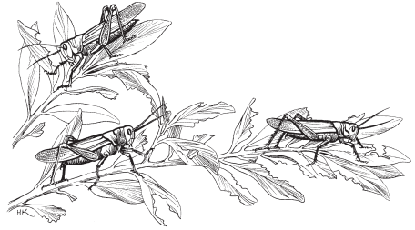
Ni tetniuu ia Dios tika langosta (9.3)

ndeva'a. Te ñua'a yun ni sa'a ja ni kune nuu nikandii ja tu ndijin ka. 3 Te nuu ñua'a yun ni kekuei tika langosta ja ni ka jitenuu ti nii nuu ñuyiu, te ni jiña'a ya jaka'nu nuu ti ja vi sa'a ti nagua ka sa'a ndilo'lo xeen ja ka oo ñuyiu. 4 Te ni tatnuni