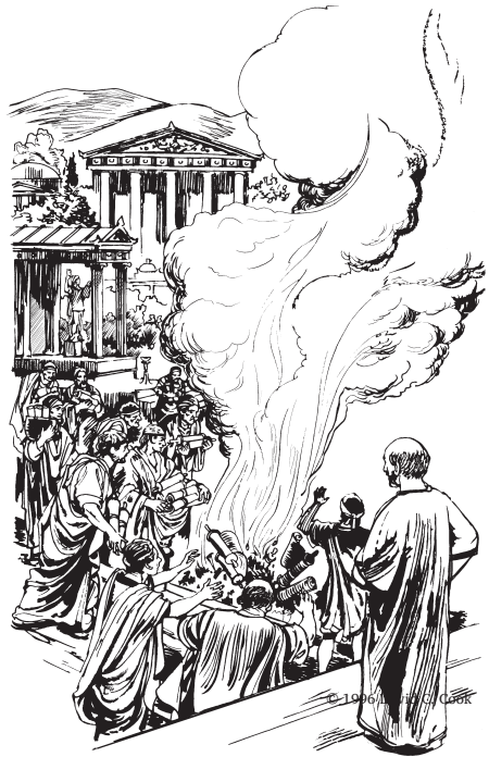
Ka teñu'u de liuru tasi jin nuu Pablo (19.19)

21 Tee nuu ni ya'a ndi'i yun, te ni ndakani ini Pablo ja ki'in de kaka nuu de nii Macedonia vi Acaya,