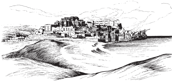
Ya'a ni okuu ñuu Jope (9.43)

Te ni ka'an ia jinokuechi nuu Dios: —Ja jini ia Dios ja ndakuatu ron, te ni janta'u ya nagua sa'a ron ja skuta'u ron ñayiu ka kunda'u. 5 Te tetniuu tee na ki'inkuei vitna ñuu Jope na vi junkuaka de Simón, tee suni nani de Pedro. 6 Oo de ve'e inka Simón, in tee xte'i ñii ja oo