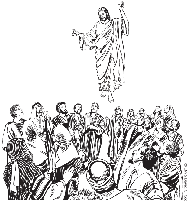
Ka ndia'a de mandaa Jesús (16.19)