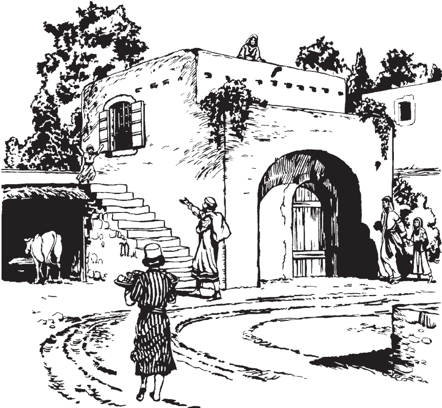
'Ri nhisiwi dasimasisizé Atusi 10.9

zama siwazari, ti'ai baba di'i na te te sina 're ãrobâdâ za'ra mono norĩ zama. Si zama te siwazari daba'wara. 13 Tawamhã Pedru, ma tô wapa, ni'wai mreme hã. ãne te 'mahã: