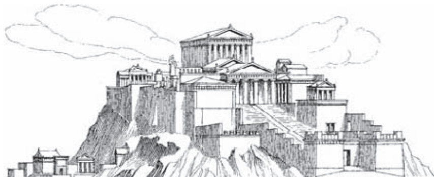
Are'opadu dasi'rã'ôtôzé Atusi 17.15-22

— Aibâ norĩ, âme Atena âma 're ai'ubumroi wa'aba mono norĩ hã ma'âpé ìwapari pese za'ra wa'aba. 'Re aihâimana za'ra wa'aba mono zé hã wa tô waihu'u. Romhâiba hã ahâ na te 're simasa, âma 're