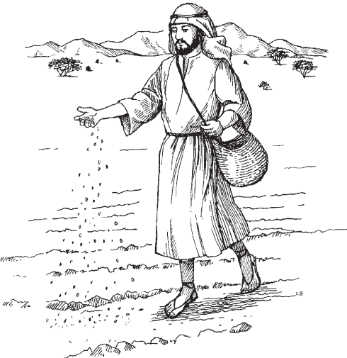
Aibã, amnho te te ãnhamra mono zé Mateusi 13.1-9

4 Tawamhã, amnho hã te te anhamra mono wamhã, nima norĩ hã bãdãdi zababa ma rere'e. Tawamhã sire hã ma te te uprosi uburé, poto mono õ ré. 5 Ëtẽ nhisiwi ma duré nima norĩ hã rere'e. Ti'ai baihãire di, ãtẽ nhisiwimhã. Ti'ai baihãire wa, ma tô 'wanhipré su'u, amnho hã. 6 Tawamhã bãdã hã oto 'rãiwatobro wamhã, rowa'ro wa, ma ro'wanhipré hã ti'wanhipré 'ré za'ra, ãsari