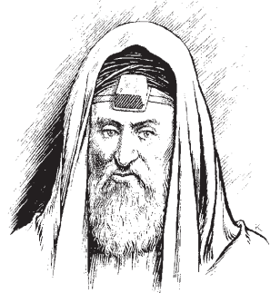
ĩbaihã nhemezé, powawẽ hã 'manharĩ 're Mateusi 23.5

3 Taha wa, parisezu norĩ nhimiroti hã te za 're ĩwapari pese za'ra wa'aba mo, âma 're anomro aba mono da. Tane nherẽ, 're ĩhâimana za'ra mono zéb zarina, ĩsine 're aihâimana za'ra wa'aba mono õ di za. E marĩ wa. Te te dama 're ĩroti za'ra mono zém na si 're sõpré mono õ wa, ta norĩ hã. 4 Danhoihi waptob âna, marĩ ĩpire uptabi hã da te 're 'wasari mono da, da te dama 're ĩromnhibu za'ra mono ne, te ta norĩ hã tinhimiroti na zama te te dama 're roti u'âsi za'ra, 'Re ĩhâimana u'âsi mono nhimiroti upana, taha na si 're danomro mono da, dama pire uptabi nherẽ, da te dasina 're ĩuwaimrami za'ra mono zéb da hã. Tane nherẽ, ta norĩ hã te te 're dapawaptob za'ra mono õ di, âma 're ĩdanomro wẽ mono zéb da hã. 5 Taré da te 're 'madââ wẽ za'ra mono da, te marĩ hã te te 're 'manharĩ za'ra, danho'a. Powawẽ hã 'manharĩ hã 'Re ĩhâimana u'âsi mono nhimiroti ui'ééré na ĩbaihã nhemezébre hã ĩsa'ětẽ uptabi na si te âma 're si'uihã wasisi za'ra, tipaihi wib zama, 're nomro wẽ mono newa, da te 're 'madââ wẽ za'ra mono da. Taha da, te duré ti'uza hâpa za'ru pa ré na 're si'uza za'ra. 6 Te duré te te sima 're pisutu za'ra, dama ĩpire norĩ simasisizém na si 're si'ubumroi mono da, dasa da te 're huri mono sidâpâsi, duré rowahutuzé mono bâ, 'ri hã 're ĩsimasa mono zéb 'remhã. 7 Te duré te te sima 're wẽ za'ra, dama ĩpire norĩ hã damreme ĩpire na da te 're ĩsawi za'ra mono ne, dahâimana prédup sina da te 're sawi za'ra