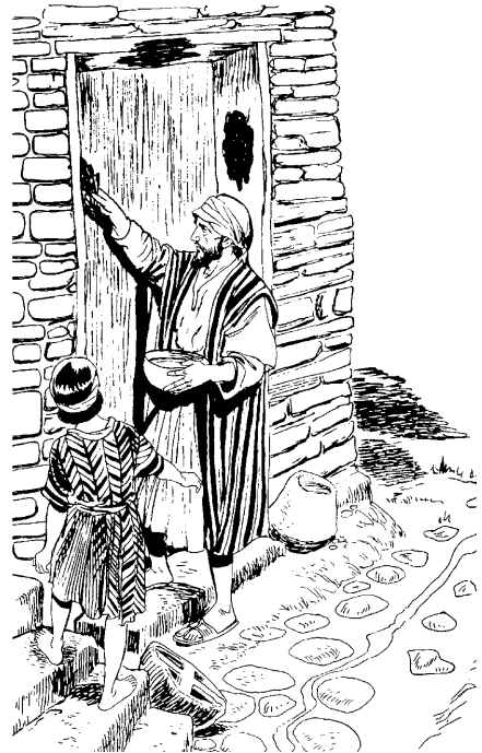
izai zichii-kaon paniinom toronna kida ida'a (11:28)

aimakaan Tominkaru pidananao tuma, una'azootapan ai oii kida'o aimakaan, aona'o ni'oraz una'an tomunu'iki. 26 Udi'itapan baiatin-karu Christ ati powa'a pa'an umanawunun ka'idiwau-karu ai ipai wuru'u umanawun kida'oraz aimakaan idi Egypt ia'oraz. Usha'apanum kau'an udi'itinpan pawinipa dau'u diina'iti'oraz Tominkaru taan ni'oraz u'ati. 27 Moses mishidan ida'an, uwa'akan Egypt Baara, aonaa utarian king to'oran ai. Moses aonaa ukaakinpan, ikoda'azo'o utukapanii Tominkaru aona'oraz turuu utukapa-kaon. 28 Na'iki Moses