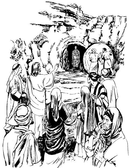
Jesus kian, “Lazarus, pukodita da'ati'i!” (11:43)

41 Uru'u naa pidannao kidu'ukan naa wuru'u kubaz. Udauna'an Jesus awunupan doko iti na'iki ukian, “Odaru, kaiman mishi manawun pugaru o'ati, puabata da'i o'paraduzon an pu'ati. 42 Oaitapa karikaonan da'i puabatauzon o'paradan. Mazan o'paradan pu'ati kaikapa'a, di'oraz pidannao na'an idi'o, marii kizi