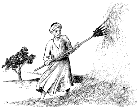
pidan kaudinan uwidau- pan papaoriba aka (3:17)

16 Aizii John kian ipai ĩnao ati, "Õgaru, õchikaawunuupan unao wunu idi karikaonan. Mazan kaini'iki'o nii pidan kaawan powa'a'o zii umanawun õ'ai. Õgaru aonaa õturuan õbuzuutan udazkidi