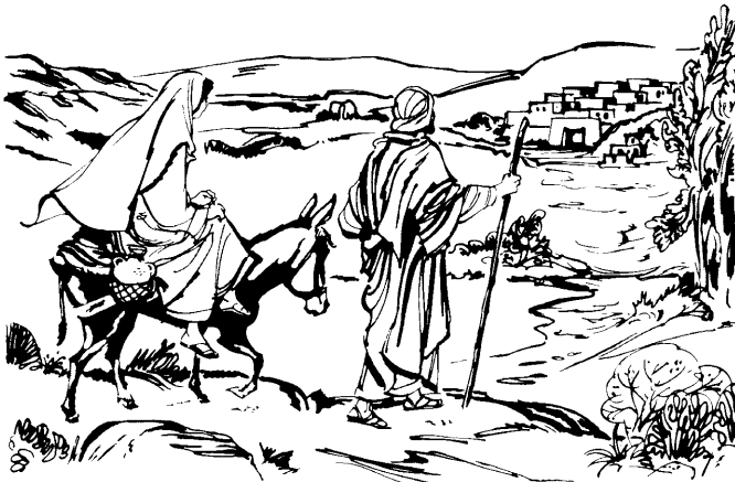
Mary na'iki Joseph makon Bethlehem iti (2:4-5)