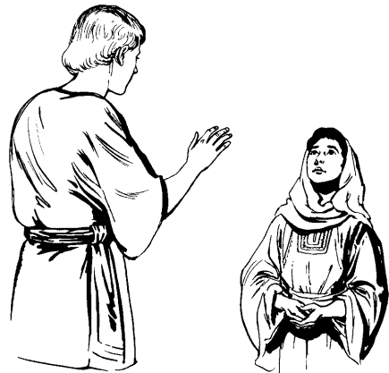
angel paradan Mary ati (1:26-33)

34 Udauna'an Mary kian angel ati, "Ōgaru pa'ina'o zii zun, aona'o zii daonaiora kiitauzon. Na'apam nii mooko ōkaudanin?"