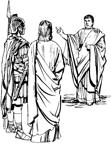
Pilate taan naa Jesus soldyaanao ka'u ati (23:3)