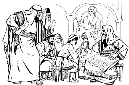
Illustration by Dawid Durrheim. © United Bible Societies, 1989 Nairobi Kenya. Used with permission.

49 Sariapa Jesus kian padaro ati, “Kandii nii mooko wuru'u udorotapanuz ōgaru di'ii'aka'a? Aonaa mooko uaitapan da'a ōgaru'u, ōdaru dapu'u?” 50 Mazan aonaa ĩaitapan na'apa'oram ati'o wuru'u una'apanuz.