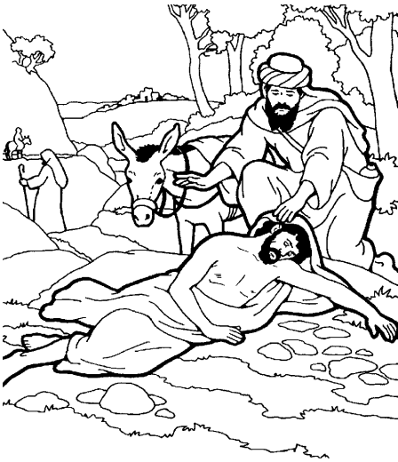
kamunanba'o Samaria san (10:25-35)

daun kidaz. Uipaian dauna'an pachikaanuz, uru'u naa uzichian wuru'u ba'izi-daun kidaz kiwinii idi. Udauna'an uruu ubazobatan naa wuru'u ba'izi-daun kidaz. Uipaian dauna'an pasaabaanuzu, uru'u naa uzaida-kidanuzu pakawaron chaakashi n barau iti. Una'akan naaz atii ikaawan wiizai di'iti. Na'ia'a naa kaiman usaabaanuz, atii ukawinipinaata sookapa-kizai kabaun nazoo u'ati, na'iki ipai utorian uwanyukunu nii.