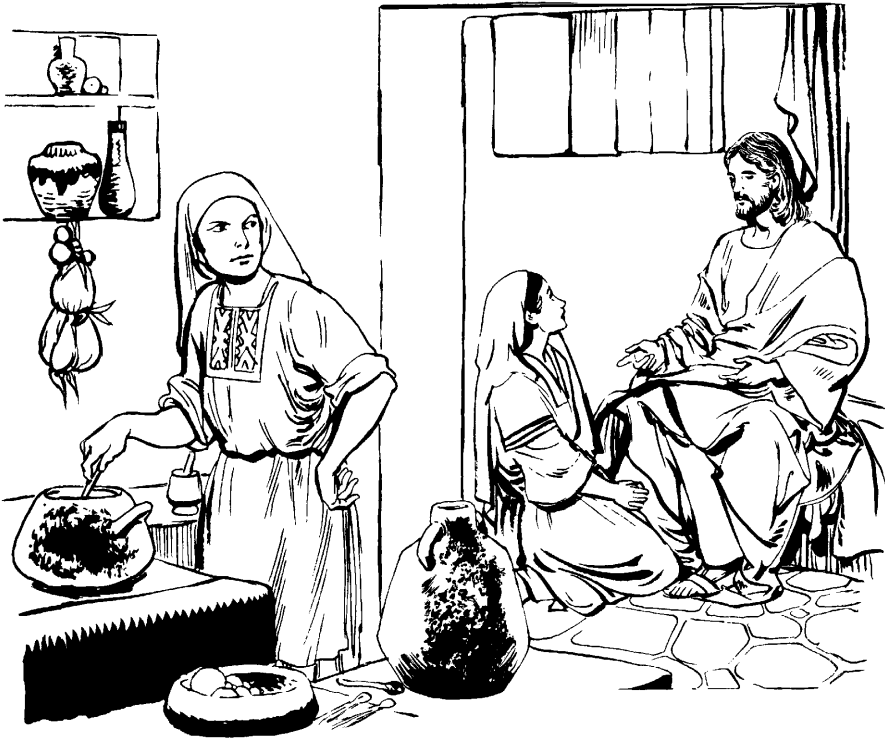
Mary na'iki Martha (10:38-42)

41 Sariapa Jesus kian o'ati, "Martha, kandii nii pudopiidinan pusha'apata'azoonii kida dau'an?" 42 Kaina'a soo bauda'apa aimakaan tuukia'o uaiapa-ka. Aizii wuru'u Mary sha'apaapaniaz aimakaan, kaimana'o manawun wuru'u, aona'o nii na'apainim ukazata-ka o'ai."