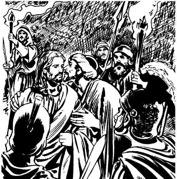
Judas kissitan Jesus (22:47-48)

47 Jesus kadakotinan pu'u zii patominapa-kidaniinao ati, uru'u naa pidannao wa'atin kasaba'u, kasaba'uan Judas dawu'ati. Uruu 12, Jesus tominapa-kidaniinao bii iki'o. Aizii ikaawan, sariapa Judas kissitan Jesus. 48 Mazan Jesus kian u'ati, “Judas, pukissitan ida'an pukaaka-