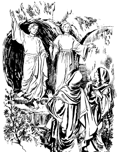
angelnao na'iki zunnao baaranai ia'o (24:4)