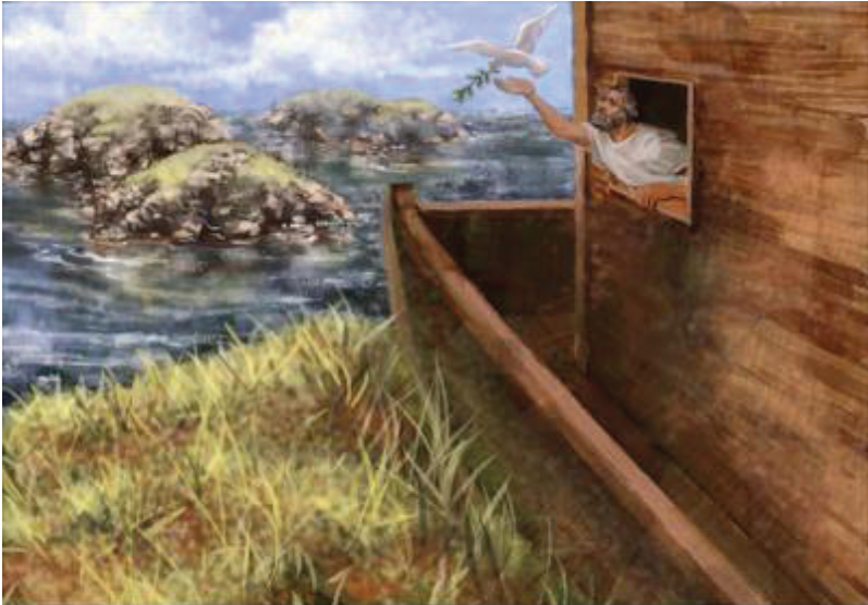
Illustration by Carolyn Dyk. © 2001 Wycliffe Bible Translators. Used with permission.

16 —Keta tichi varku chi'in ñasi'un, chi'in se'un, ta chi'in chanun. 17 Ta tava tandi'i cha-tyaku yi'i chi'un nuu varku, kiti ndava nuu tatyí, ta kiti kuvi sana ñayíví, ta tandi'i kiti chika chi'in tichi nuu ñu'u tyi ku'un-ti nuu ñu'u ñayíví ta nakuña-ti ta koo kua'a-ti.