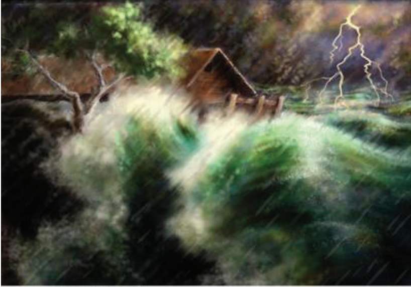
Illustration by Carolyn Dyk. © 2001 Wycliffe Bible Translators. Used with permission.

indi'i inaa. Ta nuu-ñi Noé ikaku chi'in cha-iyi'i chi'in-ra nuu varku. 24 Ta iin syendu sava kivi iyi'i ndutya nuu ñu'u ñayíví.