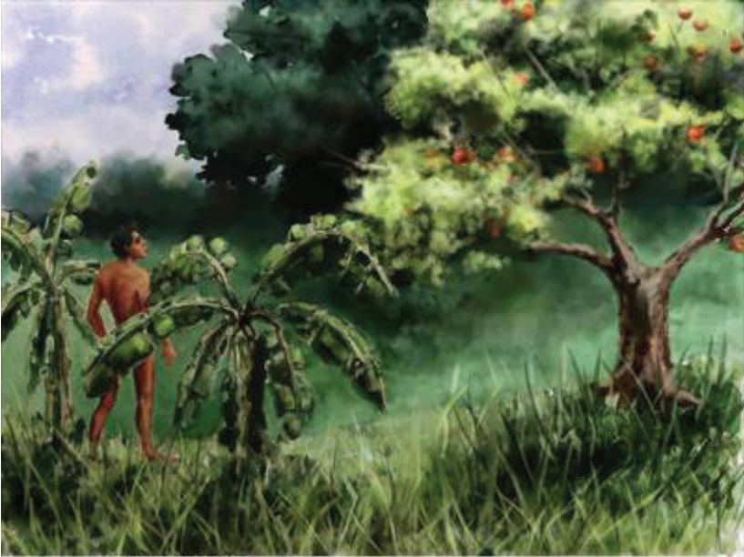
Illustration by Carolyn Dyk © 2001 Wycliffe Bible Translators. Used with permission.

18 Yukuan ta ika'an Ndyoo Sutumañi-yo ta katyi-ra: “Ñava'a kaa tyi nuu-ñi rayii iyo. Kuasava'í nuu cha-kuta'an chi'in-ra ta tyindyee chii-ra.”