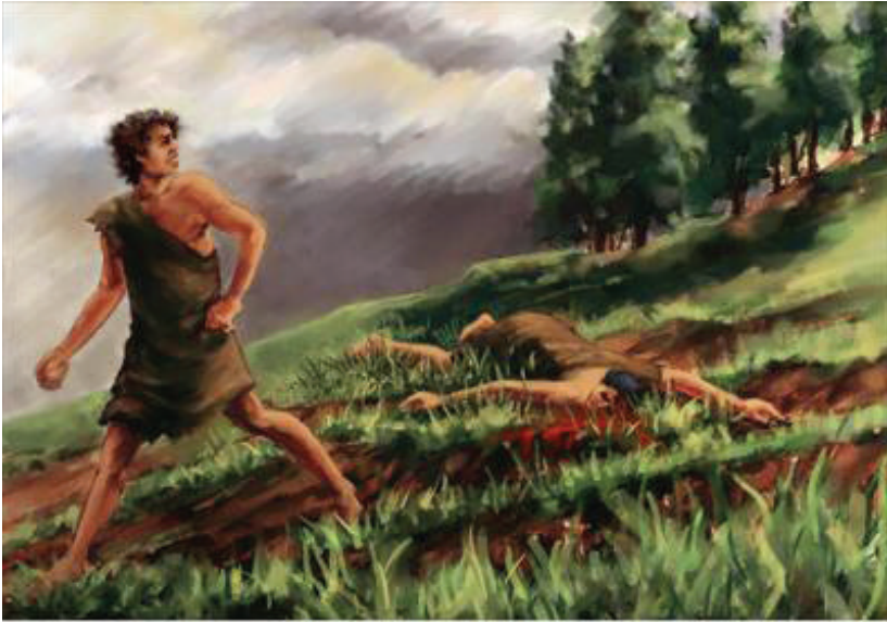
Illustration by Carolyn Dyk. © 2001 Wycliffe Bible Translators. Used with permission.

Ta nuu kua'an-ra chaku'u, ta icha'ñi-ra chii-ra. 9 Yukuan ta indukutu'un Sutumañi-yo chii Caín ta katyi-ra: