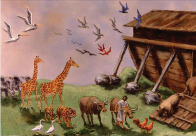
Illustration by Carolyn Dyk.

22 Ta takuan isa'a Noé tandi'i tañi ku'va ika'an Ndyoo chi'in-ra.