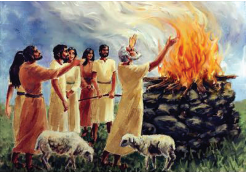
Illustration by Carolyn Dyk. © 2001 Wycliffe Bible Translators. Used with permission.

20 Yukuan ta isava'a-ra nuu naa chi'in yuu nuu kuasaka'nu-ra chii Sutumañi-yo. Ta iki'in-ra tandi'i nuu kiti va'a nuu Ndyoo, ta tandi'i nuu kiti ndava cha-kuu kiti va'a nuu Ndyoo, ta icha'mi-ra chii-ti nuu naa. 21 Ta ku'va ichaa ñu'ma-ti nuu