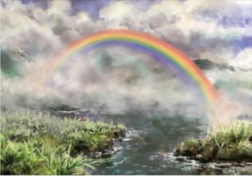
Illustration by Carolyn Dyk.