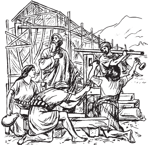
Illustration by Katie Voigtlander.

Nooea tisiwa weruma pawekakera netena wehjoari si'riipoio, ahpo ku'kuiwa ahjama. (3:20)