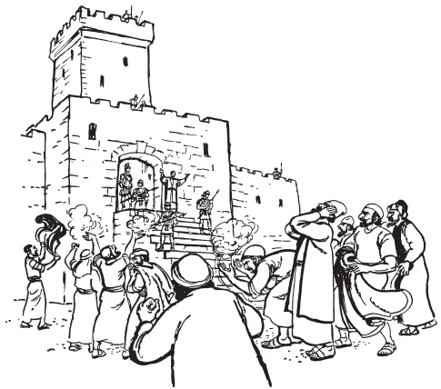
Yeeni nekarewa ka'chi yorame teewetewaa, Paoro merinarena. (3:6)

9 Teemea taamo yeenie wa'api, kaawe chaachapamepua tewekachi taamo Paamirao, pu'ka taamo yeenieo wa'api tiameo, na'ariame teemea aatao, napatika ti'tijoeo ooweruopua tiame, teeme ti'tijeria. Riosi e'rachitia erakoamekapapua. 10 Wa'api taamo yeenieo tiameo, ka'karuma nayewame teemea, ki ka'karuma tiame. Nape teeme