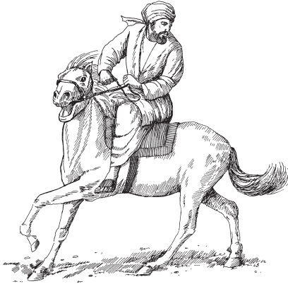
Yekajipuraa ki werumakoieo, kaawe ye'kaniamepua werumakoi kaawaio. (3:3)

taamo yeeniai, kiisi werumakaipua taamo weerewachio, pukae yeenieo, ki nu'uti oijerari chaachapame teemea. Na'iai teesa tajenakaio, ki ku'ichisi kosoyamepua tajenakao. 6 Taamo weerewachio taamo yeenia, na'ika ihsiamepua, taamo nayewasoopua, ki nu'uti nekarewa tajenatiame taamo aaatachiopua. Taamo ki kaaweruma nayewaa, taamo na'itutiamepua, taamo wahjachichi kaawe te'teriaio.