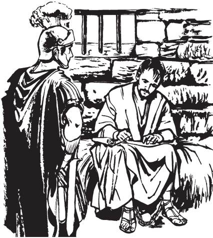
Paoroa perekarichio, tarachi kaarenae o'yeraeka yasitenia. (2:9)

pahtetekao, achin tiamekoopua no'o aamo chiiao.