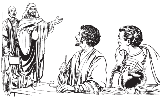
Paoroa ku'iwa ihkokenia, Iiripo o'inia Eesusichi paparamee. (4:16)

15 Neeea aamo Iiripo mochikameo, nane'riamenia eemeche no'o ku'iriamekopua, Maseronia o'inia no'o machenoioipua, wahjachi mochiwachiami no'o nayewatumia simirioio, i'ka Riosichi simiyame kaaweruma tuuyewario. Waikami taawechio ki'tiainia aata