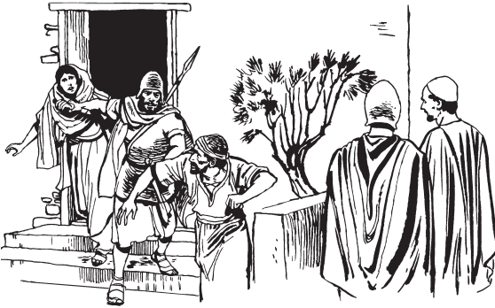
Paoraa Eesusichi paparamemo, utewaame cheeka chapinurani. (1:13)

eina nokaka Riosie Weratiame tuuyewario, sewina aamo ijikimichiopua pukachio. 8 Nape aaataoi sewina tiame masitesoopua ki taamo aamo masiteriachitia, taamooio enesoo, Riosi ku'iwarikooi tewekachi eenakamekooipua, pu'ka se'wi masitiamechio neea,