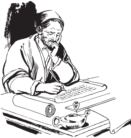
Paoroa Rooma muuwarichi mochikamewichio iyotena. (1:1)

1 Kúíra Rooma muuwarichi mochikame. Ka'karuma mochikame enesaa eemea, kaawe enemiipua, yooma eeme Riosichi poponiwao pipiniwaopua tiame. Teemea i'wao, ka'karuma mochikamepua. Nee Paoroa, Eesusi Riosie Weratiamechi tekipanamea i'wa yasakaoinia i'ka aamowichio iyotemo erapakania, itapiti Riosichi simiyame naawesari. Nee Paoroa Riosie Weratiamee poanataka uutiamenia, i'ka Riosichi simiyame yomatiami weechi