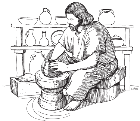
Sikoritamea, ihta itapiti ahpo netenaria netena wehchorie. (9:21)

22 Riosiai iinuemeopua tiameo, ahpo ki nahsinepaka puuemiao, ki ka'karuma nokayame ti'tijoeo ooweruopua tiameo, ahkasi apochi e'enaka ka'karuma enepachisio, nape ki apochi paparamia e'enanarekameopua, Riosia pu'kao iinuemeopua tiameo, kokosamiaoipua. 23 Riosia, ahpo ki nahsineka puuyeriaa, te'ta tísia ahpo tesiwewa e'ria tetewitenariapa wa'a teereriaipua. Puuu ki ka'karuma nokayame puuyetiam, teeme puuu tiameo, Riosia pukeri ahpo iintomia inatariachi o'inia, taamo ahpo tesiwewa uupuame inatakamepua, taamo ka'karuma enepatesaapa, ahpo ahjama mochipuachi i'tonariapa. 24 Puuu kakupachi i'topuamea, teemeopua te'ta i'isaeri