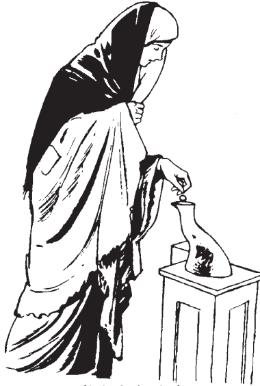
(2 Corintios 9:7)

c'axc'ob' laj awanmak chi jye'ic jwi'l Kakaj Dios tijlok'aji' jun cristian ri nojel ranm chi jye'ic. 8Kakaj Dios jwi'l rutzil ranm chawechak trana' chi tiwa'x juntir kelen awechak lawi' ri tichocon awi'lak pire atcwintak chi jb'anic utzil rechak yak nic'j cristian chic. 9Chapca' tz'ib'al li wuj re Lok'laj Jyolj Kakaj Dios ri tijb'ij jilonri: