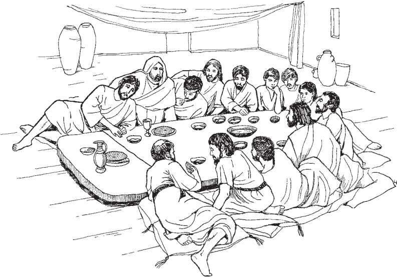
(1 Corintios 11:23-25)

xc'am man nejb' y xij: Man ri wi' li nejb' ri, ri' inquit'uel ri quiek la' xaan man aac' chomorsa'n. Nojel b'welt cuando tati awechak man ri wi' li man nejb' ri, b'antak pi cuxtib'iwe, xche' Kakaj Jesucristo.