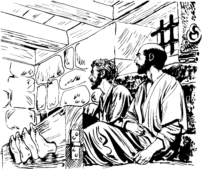
Pablo ruq'uin Silas ptz'on chan chpam jun che'. (Hch 16.24)

ruq'uin Kjawal Jesucristo jo' chpam wuchoch, tzra' quenya' wa' epsad. Cara' xbij chka, npors xuban chka che nokec'je' kaja ruq'uin. 16 Xkaban jmul okobnak chpam lwar abar nba'n wa' oración tak xkawil jun xtan. Jawra xtan c'ola jun itzel espíritu ocnak pranm y rmal jara' itzel espíritu necwina xtan nuch'ob je' achnak jq'uemjana tbantaja. Ja' xtan ec'ola rjawal y congan pak nquech'ec tzrij rmal jnuban. 17 Ajoj ruq'uin Pablo kamjon binem y ja' xtan tren ela chkij. Ja' xtan xumaj rakic ruchi' y cawra xbij chca wnak: —J-ewra ach-i' e ajsmajma' rxin nimlaj Dios y quemjon rbixic chka nak nkaban che nkototaja. 18 Q'uiylaj k'ij cara' xbij jawra xtan. Per jun k'ij xc'owa ruc'u'x Pablo rmal, arja' xuya' volt y cawra xbij tzra itzel espíritu: —Prubi' Jesucristo quenbij wa' chawa, catel ela pranm xtan. Y njara' hor xel ela itzel espíritu y xuya' cana xtan. 19 J-e' c'a rjawal xtan tak xquetz'et chmajo'n chic pak nquech'ec tzrij c'jara' xequechap Pablo ruq'uin Silas y xequec'om ela pq'uebal abar tzra' c'ol wa' k'atbaltzij. 20 Tak equey-on chic chquewech e k'toy tak tzij cawra xebij: —Ec'ola e c-e' ach-i'