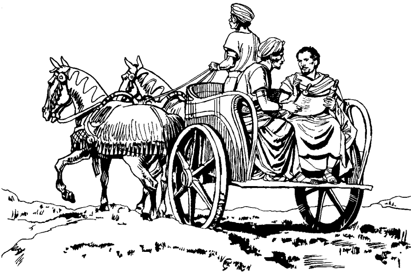
Felipe remjon rch'obic chwech acha nak rbanic Jesús. (Hch 8.31)

achnak nbij chca je nquebnowa lowlo' tzra, cara' nuban ajni' jun carne'l tak nch'upuxa rlan je rc'an. 33 Xruq'uix nqueya', me pril ta je nba'na tzra cmal e k'toy tak tzij. Je' wnak jec'ola pretiemp, arj-e' congan lowlo' xqueban com xeccamsaj. Cara' rtz'iban cana profeta Isaías. 34 Ja' acha cawra xbij tzra Felipe: —Tebna' jun utzil, tbij chwa ñnak chu tzra nbij wa' tzij profeta, le tzra ja' kaja, o tzrij jun acha chic? 35 Ja' Felipe arja' xumaj rch'obic chwech nak rbanic tzij y xuch'ob chwech nak rbanic Jesús. 36 Kas quemjon binem chpam caret tak xequewla' jun ya'. —Tetz'ta' mpa' jun ya' la. ¿Mex utz quenba'na bautizar camic? Cara' xbij ja' acha. 37 —Wneyke'a ac'u'x ruq'uin Jesucristo per ne che njelal ac'u'x y che njelal awanm jara' utz ncatba'na bautizar. Cara' xbixa tzra rmal Felipe. —Anen ykula nu'c'u'x ruq'uin Jesucristo che arja' Rlec'wal Dios. Cara' xbij tzra Felipe. 38 C'jara' xuya' jun orden che npe'a caret y xekaj ta chpam y xe'oca chpam ya' che c-e'. C'jara' xba'na bautizar ja' acha rmal Felipe. 39 Tak xe'el ta pya' chek q'uenjral xec'mar ela Felipe rmal Espíritu Santo. Ja' acha majo'n chic xutz'et xta rwech Felipe, xumaj chic wjic rubey y congan nquicota. 40 Ja' Felipe c'xuna' c'o pon chic chpam tnamet Azoto. Xumaj chic rubey y tak nk'axa ptak je' tnamet nuya' rbixic utzlaj tzij rxin Jesucristo. Cara' xuban y xekaja chpam tnamet Cesarea.