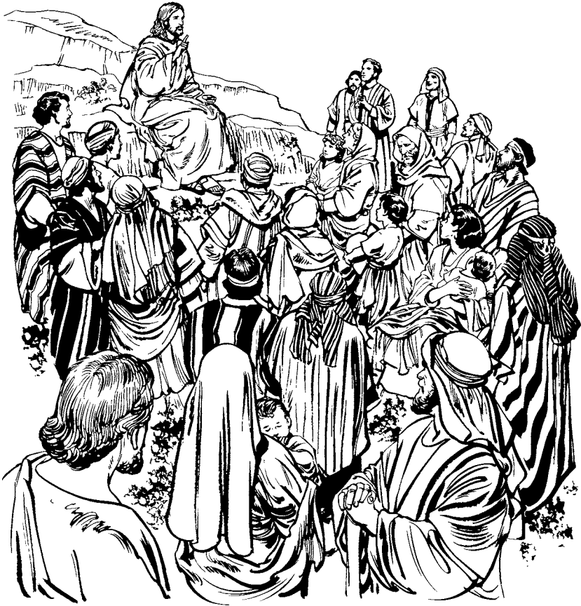
Jesús xumaj ctojxic wnak. (Mt 5.1-2)

e rlec'wal Dios. 10 Congan quicotemal rxin Dios nyataja chca wnak je nba'na lowlo' chca rmal je nqueban rbeyal rxin Dios com cxin c'ara' jgobierno rxin chcaj. 11 Congan quicotemal rxin Dios nyataja chewa tak nquixtz'u'ja y nquixyo'k'a y tak nba'na njelal rwech lowlo' chewa y tak nbixa njelal rwech rtzilal chewa jme ktzij ta y xe nmal anen tak cara' nba'na chewa. 12 Tak cara' nqueban chewa quixquicot c'a, per ncongan quixquicota, com jara' c'ola jun nimplaj rtojbaliil nyataj na chewa chcaj. Quixquicota com cara' xba'na chca ojer tak profeta, congan lowlo' xba'na chca.