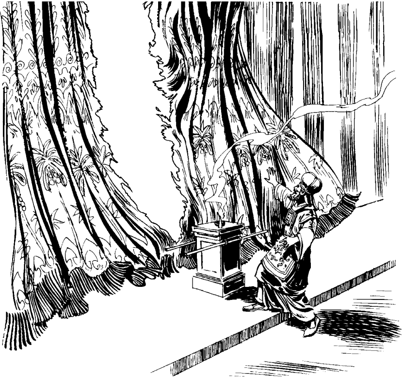
Chek q'uenjlal xraktaja mant jk'otben rpam santlaj rtemplo Dios. (Mt 27.51)

tzra Jesús chnutaj. 49 Per jle' chic cawra xecbij: —Tey-a' tzra', katz'ta' nc'a k'alaj we xtpeta Elías che nret-o', cara' xecbij. 50 Ja' Jesús xurak chic jmul ruchi', xujach ranm tzra Dios y xcom kaja. 51 Y chek q'uenjlal xraktaja mant jk'otben rpam santlaj rtemplo Dios, chek c-e' xuban. Xraktaj ta, nq'ue chcaj xe'el twa' y xerkaja penlew. Jruch'lew congan xusil ri' y c'ola nmak tak abaj xuch'or ri' rmal. 52 C'ola je' jul cxin cnomki' xjaktaja y je' cnomki' je rxin Dios e q'uiy chca xec'astaja. 53 Arj-e' tak c'astanak chic Jesús xe'el ta chpam jul abar ec'o wa' y xeba chpam santlaj tnamet Jerusalén, y e q'uiy xetz'towa cxin. 54 Jcapitán e rexbil jec'ola ruq'uin che necchajij Jesús arj-e' xquetz'et cbarkan jxuban, xquetz'et njelal je xbantaja y congan xecxibej qui' rmal: —Jala acha ne ktzij wa' che Rlec'wal Dios, cara' xecbij. 55 Y e q'uiy ixki' jec'ola tzra' xquetzu' pona chka' je xbantaja. Arj-e' etren ela tzrij