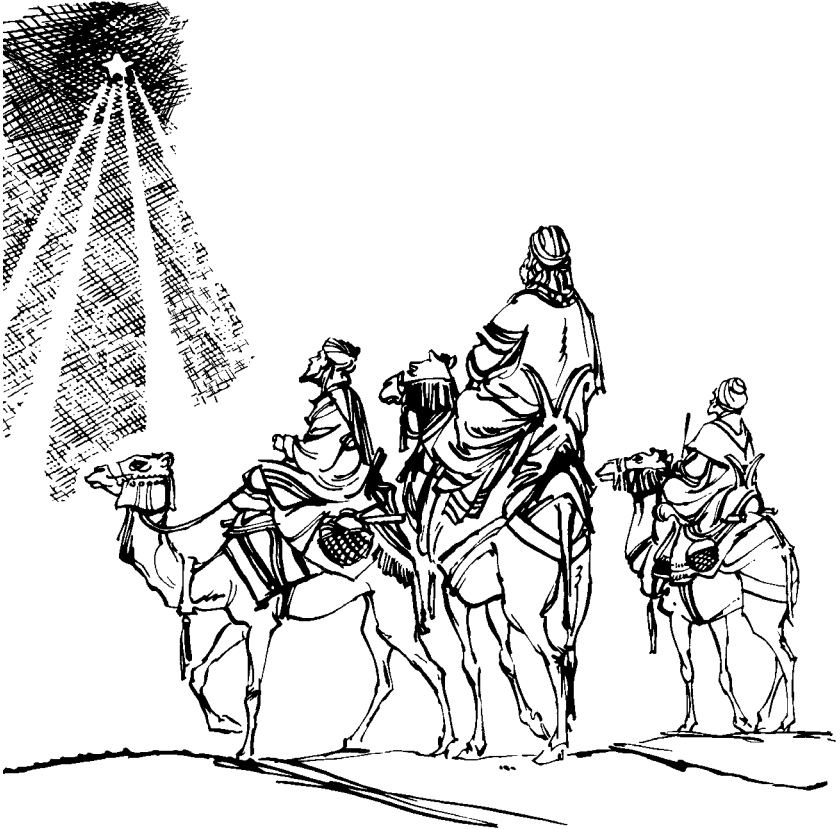
Jch'umil rec'mon ela quebey magos. (Mt 2.1)

6—Je tnamet Belén jc'ola precwent Judá, ajni'la nim ruk'ij ntz'e'ta cmal ja e k'toy tak tzij rxin Judá. Cara' nba'na tzra com tzra' nwanker wa' jun k'toy tzij, arja' nc'ana cxin netnamet Israel, cara' xbij Dios. Cara' tz'ibtanak cana rmal profeta. Cara' xecbij tzra. 7 C'jara' ja' Herodes pnalak' xutak quesic'sic ach-i' je nmak tak cna'oj. Tak xe'ekaja ruq'u'in kas congan xuc'ot quechi', xc'axaj chca nak k'ij kas xwankera ch'umil. 8 C'jara' xerutak ela pBelén y cawra xbij ela chca: —Jix pBelén kas bien ecanoj ac'al abar tzra' kas xtewil wa'. Tak xtewla' tetka' ta rbixic wq'u'in ch-utz c'ara' quenba anen chka' che cney-a' ruk'ij, cara' xbij ela chca. 9 Tak xc'axaja cmal je xbixa chca rmal rey c'jara' xeba. Per jch'umil jquetz'ton ta pnoriente jara' xec'mow ela quebey. Jch'umil tak xekaja nmer pe rwá' abar c'ol wa' ac'al majo'n chic xbin ta.