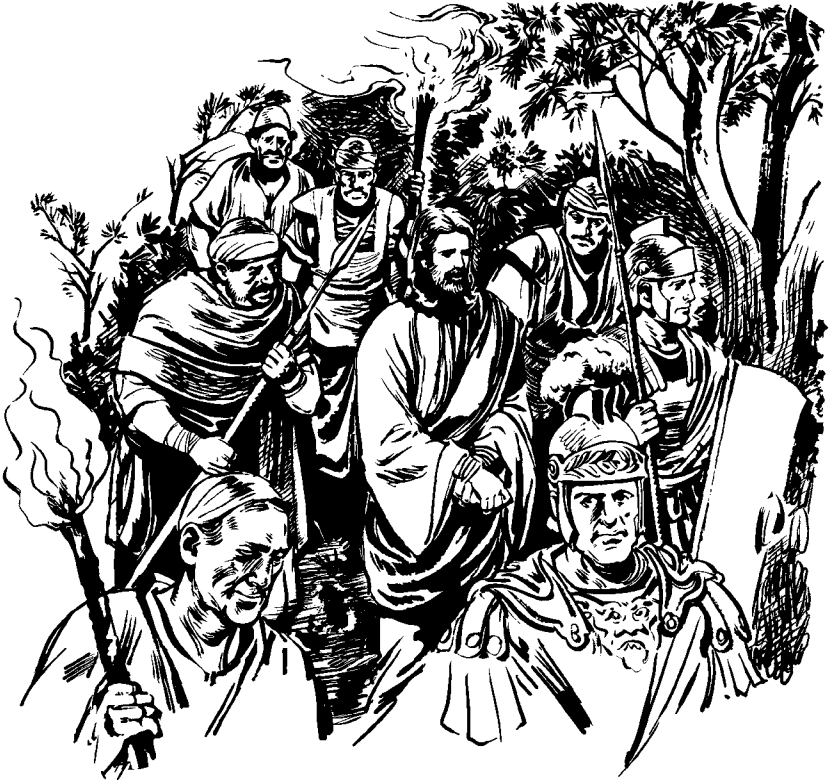
Jesús xec'mar ela cmal soldado. (Mt 26.47)

Tecsaj awespada chpam rc'olibal com nak xtecsana espada, tzan espada ncamsbex wa' chka'. 53 ¿Lmajo'n c'a ewutkin ta che anen wexte c'ola ngan quenc'utuj nto'ic tzra Nedta' Dios arja' chanim nquerutak ta jle' ángel che nto'ic? Per congan e q'uiy nquerutak ta, e ajni' e cbeljuj ejército soldado je nquerutak ta. 54 Per che mquita quenk'axa chpam ja enc'o wa' camic majo'n c'ara' nbantaj ta cumplir jtz'ibtanak cana chpam rtzobjal Dios che nc'atzina quenk'ax na chpam, cara' xbij tzra. 55 Jara' hor ja' Jesús cawra xc'axaj chca wnak: —¿Le en elk'om anen rmal c'ara' tak ec'mon ta espada ec'mon ta che' chwij che nchapic? Per xenc'je' wan chpam nimplaj templo rxin Dios y k'ij k'ij xentijoj wnak chpam per majo'n wan xnechap ta tzra'. 56 Per njelal jawra majo'n chek ta xbantaja, rmal che nbantaja cumplir jtz'ibtanak cana chwij ojer cmal ja e ojer tak profeta rxin Dios, cara' nbij chca. C'jara' je' rdiscípulo xqueya' cana y xenanmaj ela.