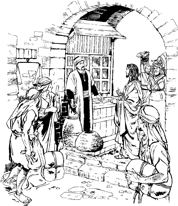
Jo' catetre' ta chwij y catoca ndiscípulo, cara' xbij Jesús tzra Mateo. (Mt 9.9)

jquembij tzra jawra acha che quency ril rumac, o wquembij tzra che nyictaja y nba? 6 Anen quenwajo' quenban jun achnak chewech camic ch-utz c'ara' newutkij che Rlec'walxel jxoca alxic cuq'uin wnak yatanak tzra chnucuy quil quemac je' wnak wawe' chwech ruch'lew, cara' xbij Jesús chca. —Catyictaja, tec'ma' ela awarbal, jat pnawuchoch, cara' xbij tzra acha sic. 7 Cara' xuban, xyictaja y xba chruchoch. 8 Je' wnak congan xel ta quec'u'x tak xquetz'et jxuban Jesús y xquemaj rya'ic ruk'ij Dios rmal. Com Dios arja' pruk'a' jun wnak rey-on wa' jawra nimlaj poder je xquetz'et rmal c'ara' tak xqueya' ruk'ij.