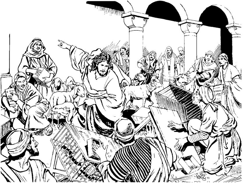
Jebnon tzra rtemplo Dios xe cc'olibal elk'oma', cara' xbij Jesús. (Mt 21.12)

o' camic, xpeta Rlec'wal ja ojer rey David, cara' necbij. Y congan xpeta cyiwal rmal je xquetz'et y jxecc'axaj. 16 Y cawra necbij chic tzra Jesús: —¿Le mtawc'axaj c'a quemjon rbixic ac'ala' chawa? cara' xebbij tzra. —Quenwc'axaj nc'a per ixix ðmajo'n c'a jmul esiq'uin ta jawra jtz'ibtanak cana chpam rtzobjal Dios? —Dios, je' ac'ala' e quexbil ch'tak ch'uch'a', atet ay-on pquechi' jnecyabej ak'ij y kas tz'kat nqueban tzra, cara' xbij Jesús chca. 17 C'jara' xeruya' cana y xba, xel ela chpam tnamet, xba pBetania y tzra' xwar wa'.