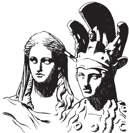
(1 Corintios 8.7)

9 Eyta cuácayat baat ruwa sirir bin quin wijac cohn cuácayat yají çawí. Tan sihwār cohwi. Eytair báreyra, çbaat ruwa bachuti cohquíc oquís urá bow conu eyin urá cuecwa áyajaqui? 10 Ba urán cuít binat sirir bin usar ruwa cóhyeyra, çistiyát baat cohquíc ístajaqui? Eyta ístír çeyat cat im eyta cóhjoqui? Çur icar cohjor bi cohquíc sehwa rabar cóhjoqui? Çruwa sirir acu bin sehwa rabar cóhjoqui? 11 Eyta cóhyeyra çba urán cuít cuar baat eyta cohquíc oquís cahujín urá cuecwaajaqui? Behmár urán cuít sihwā cuar çbehmár oquís rabin urá