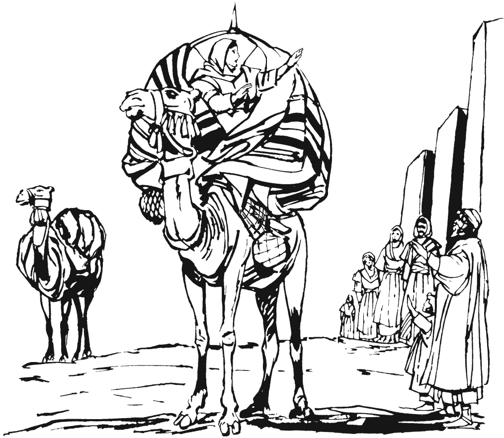
Na'ti-ngawúún anguiin Rebéká dí najka. (24.61)

gándxa'wá-mina' náa xanáá, ikí niyaxjì ndi'yoo dí naguwá' kaméyú. 64 Xú'kui-má niyaxjì Rebéká mangaa, ikú ndi'yoo Isaák. A'kui nìkajtaa náa sūdū kaméyú. 65 Ikú nirajxuu xtajmá: