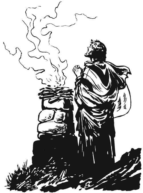
Abrám na'ni mbaṭa Anulú. (12.7)

8 A'kui nigájnuu ikí, nijka mbá kúbá dí gí' náa na'ka jka' níjiúun xujuin Bet-él, ikí-má nigí' gu'wá xtiin drígoo. Dí Bet-él niguanúu xígíi' náa narámáa' jka', xujuin dí mbi'yuu Aí gí' náa na'ka jka'. Ikí Abrám nirngujxi isí náa ma'ni