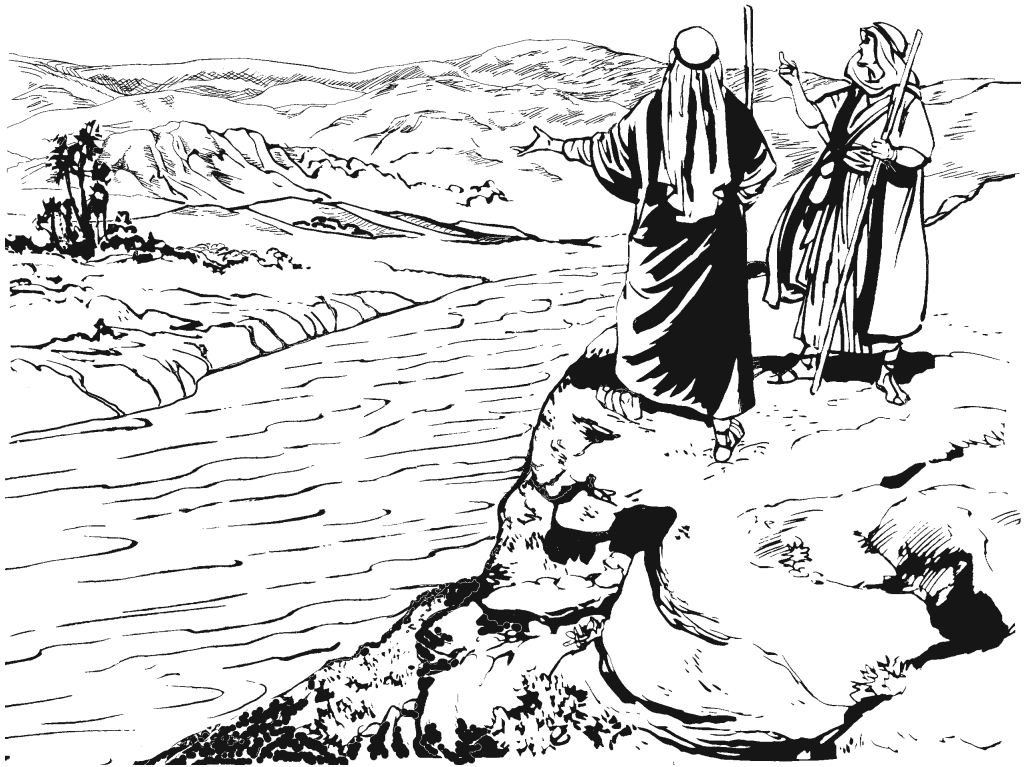
Abrám gajmaq Lót nura'wíi jmbaa' náa dí maquwá. (13.9)

kananéó gajmiúú xabú fereséó náa jmbaa'-má rú'kuí. 8 A'kuí dí Abrám ni'túun Lót: «Ragí'maa dí maqí'dulú ikáán', xú'kuí-má bú nduñúú xujkiáa' ikáán jmaq bú nduñúú xujkiú' ikúún, numuu dí kaníkáán'. 9 Atayáá, a'kuí-má ríga mbá xúguíí' jmbaa' dí mandoo maatra'wíi. Naṭa-káñáa' táan dí maṭani kaní-mina' náa ikúún. Mú dí ikáán gídxú' náa ñawún-xti', ikúún gá'gá náa