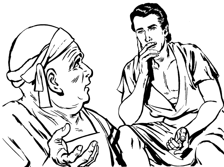
Mbáa xabü na'túun José dí nigúndaa náa guéjuaan'. (40.9)

iyoo', najni' náa awúun rgúxiuü. A'kui dí najxnuü na'gaan ndiyoo.