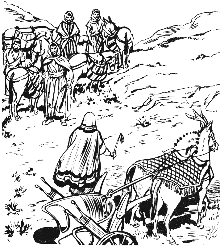
Xtajmá bu ginii nijka rajxkúún anguiin José. (44.4)

4 Ndóo dí nigájnaá ikiin náa xujuin, jndu xoó tágúún-má sínguán' wéñúú' ndóo José ni'túun xtajmiúú bu na'tí-ñájun': «Ayu' kidxúún' xabu bu'kui. Ndóo gátaxkamii xígi gáratuun: “Ndéjuun' dí nurtangaa dí ramíjián' jmaa dí míjián' rú'. Ndéjuun' dí niní ku'wá' rgúxí dí ajuan' mi'xá drígoó xabu níkií rá. 5 Lá ra'káa rígi najmuu na'gaan jmaa iya' xabu níkií drígó', xú'kui-