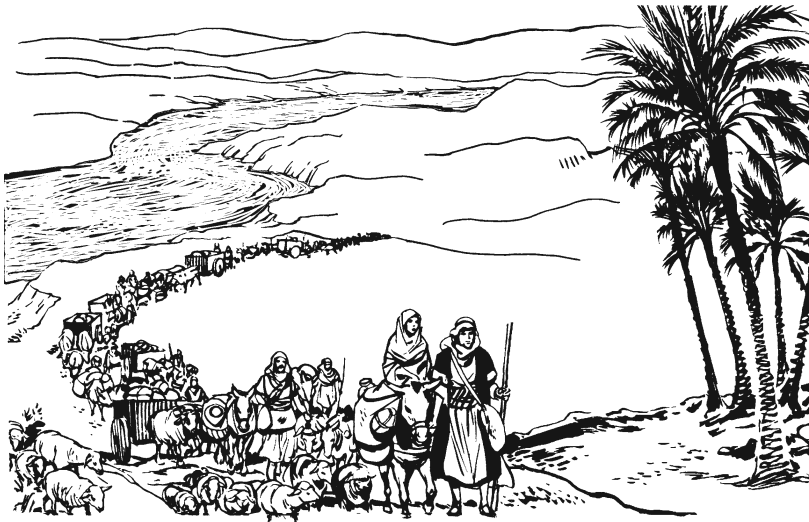
Jakób najka gajmú mbá xúguíin' xabii náa Ejíptó. (46.6)

—Ikúún ñajun' Diúu, bu Diúu drígoo anaa'. Xámiñaa' dí midxu' náa Ejíptó, numuu dí ikí maní mbá xujuin mbaa jmaa majiaan' ikáán. 4 Ikúún ma'gá jmaa