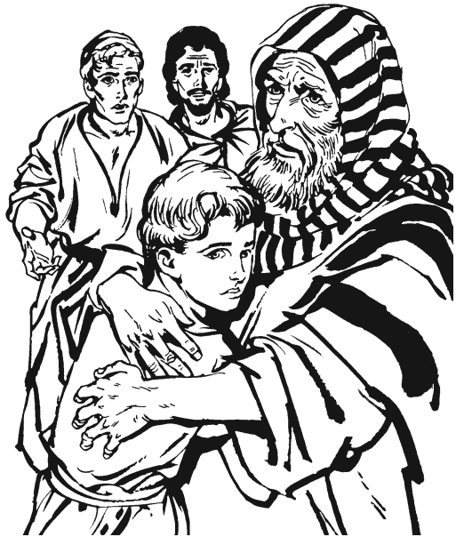
Síyoo Jakób dí ma'ga Benjamín náa Ejiptó. (42.38)

—Arajxniú'-má ikúún gi'tio', mu dí ikúún-má gá'káa' kayaa.