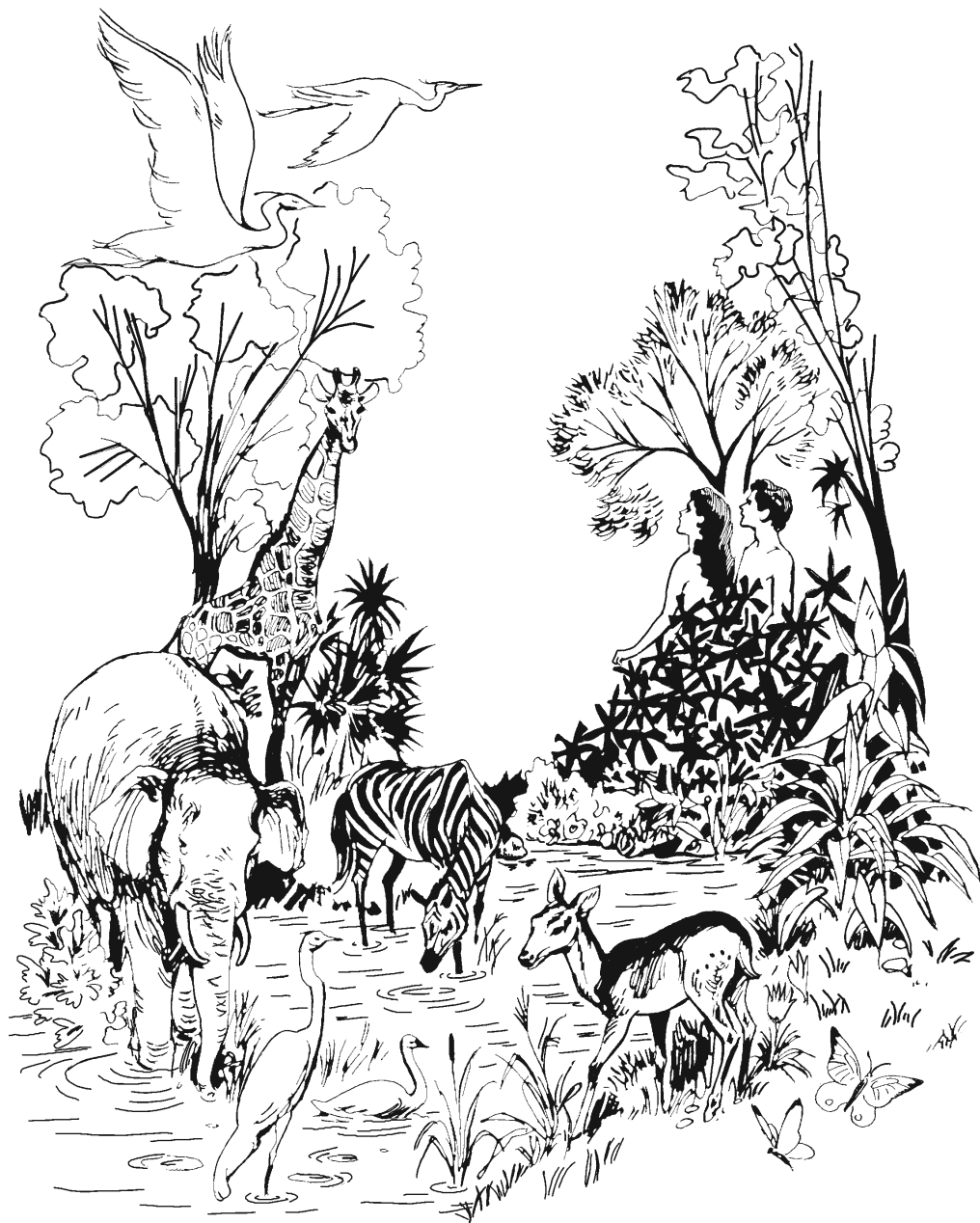
Anulú ni'ni-kumii xujkú' gajmiúú-má xabu. (1.25)