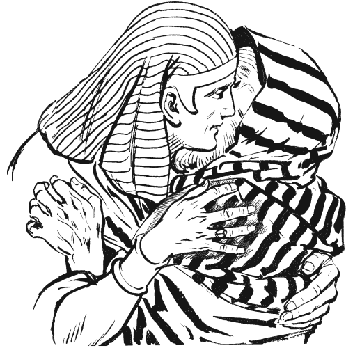
José naxkama-minaa' jmaq anuu. (46.29)

31 Ikú José ni'túun anguin , xú'kui-má bu kúwá náa go'oo anuu: