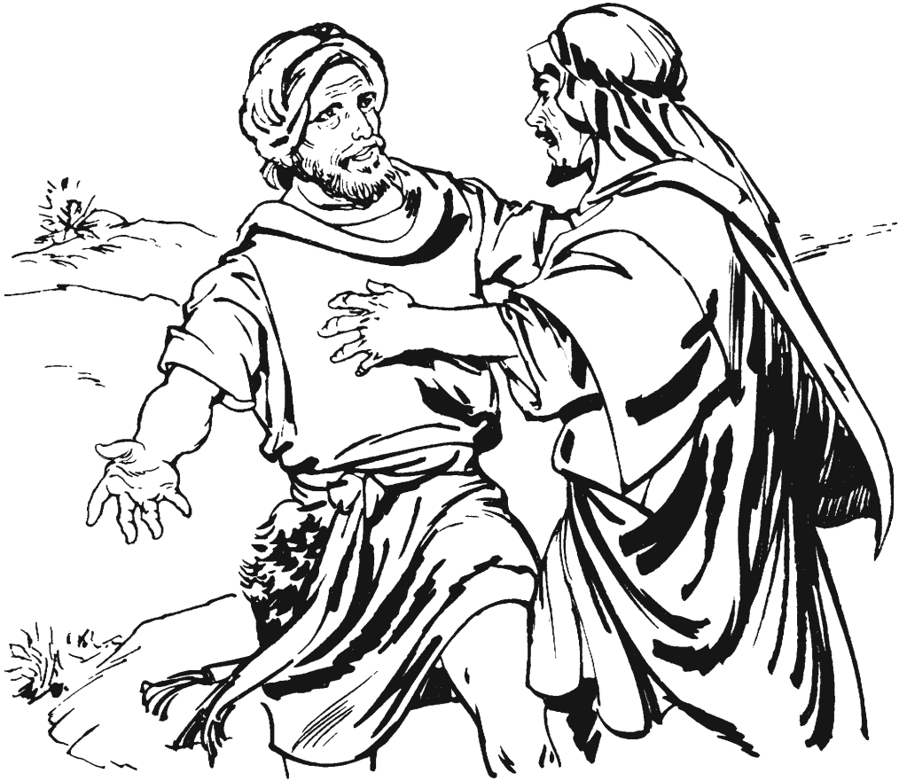
Naxkama-minaa' Esáú gajmaq Jakób. (33.4)