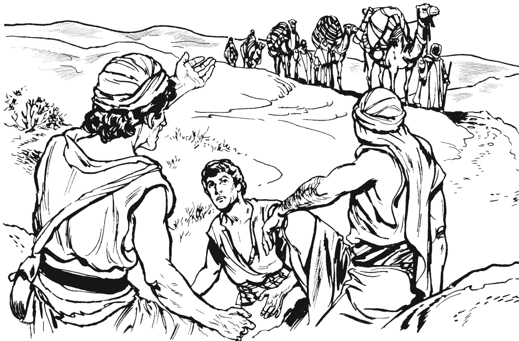
Nixtagujuaa José nini anguiin. (37.28)

33 Ikú ikaa nininuu', a'kui ni'tí: —Xtíńúu a'diód' ñajuun' rígi. Mbáa xujkú-xáná ni'kuu, niémboo nirujku-rigaa José.