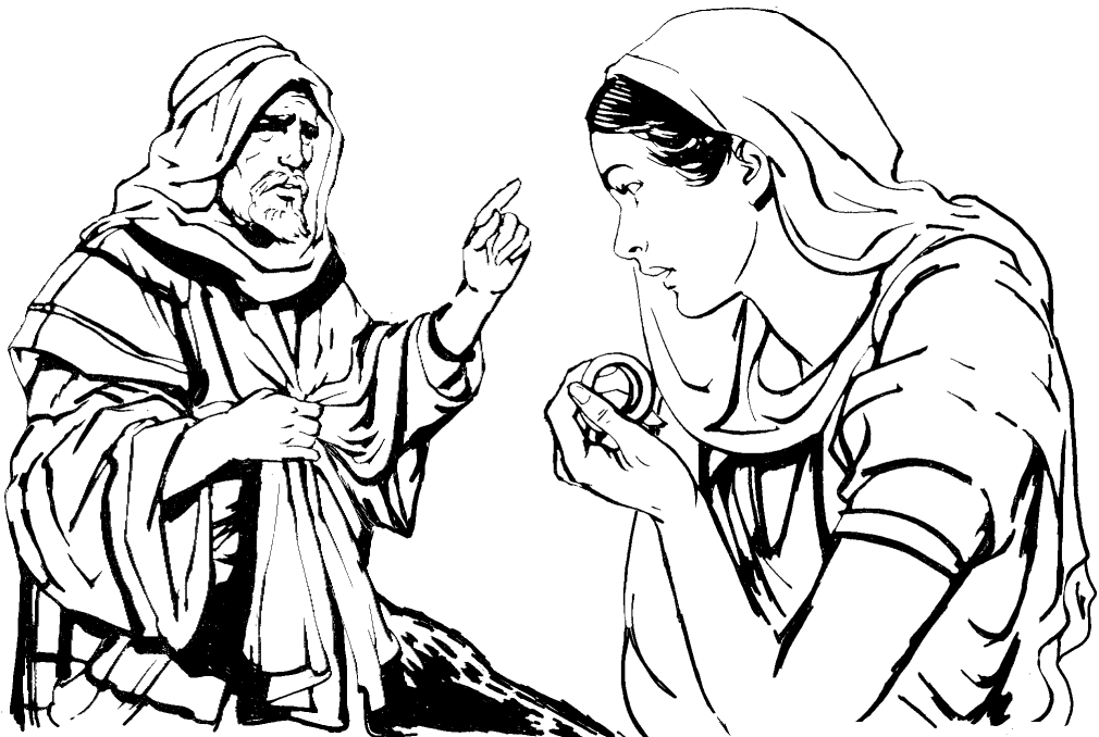
Nakánáa xábi dxá'gú e'ni xtajmá. (24.22)

22 Ndóo niémbúun ni'waaan iya' kaméyú, a'kui dí xtajmá nijxnúu Rebéká mbá xábi ajuan' mujmu' dí mbá tiku síkló m dí kiwun,