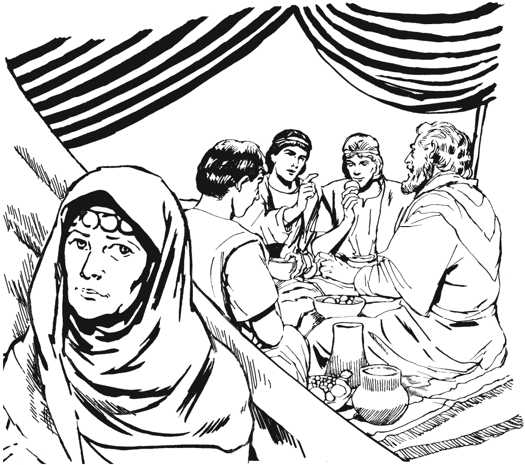
Na'dxawuun a'gú-nikii Sára dí maḡi'daa a'diáo. (18.10)

má a'dá-xédí bu niguma míjiáan', nisruwán náa inúú xabú bu'kui. Ikí-má niwiji Abraám mangaa náa agoo ixi dí ndoo nipi'su.