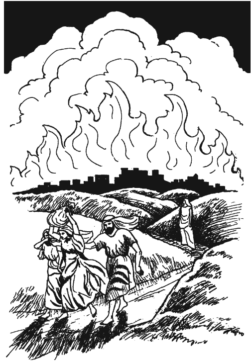
Nagájnuu ragáyúu Lót náa xuajin dí na'ni-gámbaa Anulú. (19.17)

—Atani kríya-mina'. Xátangáán matiajxi kidxaa', xú'kui-má xáñajún kayuu' mbá xúguíi' xkuá rígi. Mbá nacha