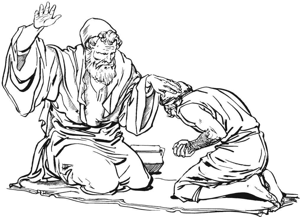
Isaák na'ni sajku-rámáa' Jakób. (27.27)

29 Ganindxuún xtajmiáa' xabu mba'a xujuin, xú'kui-má mbá xúguíin' xabu