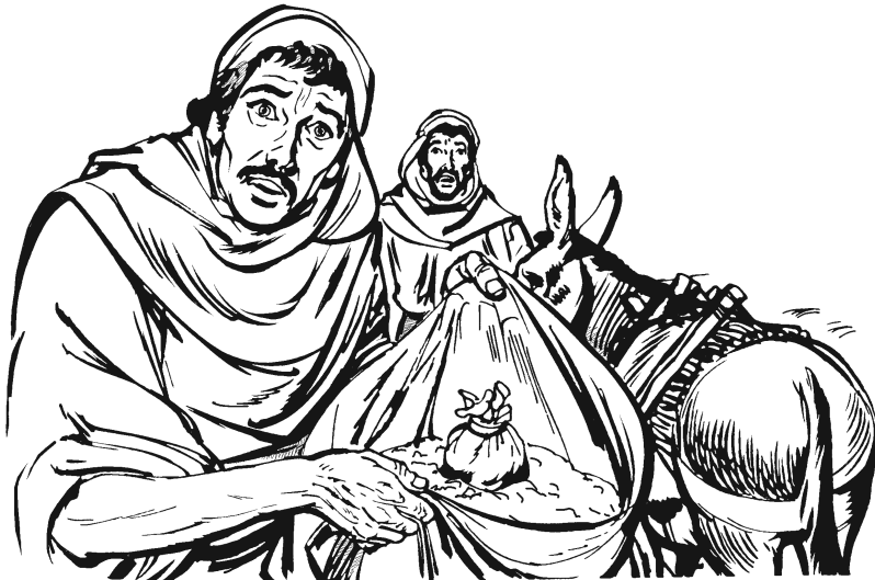
Siéngué ni'ni ajkiüün mbáa dxájuu José ndóo ndi'yoo dí kartangaa bójkoo. (42.27)

27 Ndóo niguá'nú náa muguajún munu', ikú mbáa nimbá'too gújxtaa dí maguwíi dí majxnúu dí miku búriiü. Ikí gíwán' bójkoo náa awúun gójxtoó ndi'yoo. 28 Ikú ni'túún anguiin: «Tiáá lá ján', juirtangaa-lá bójko' jún. Guyaa dí náa awúun gójxto' gii gíwán'!»