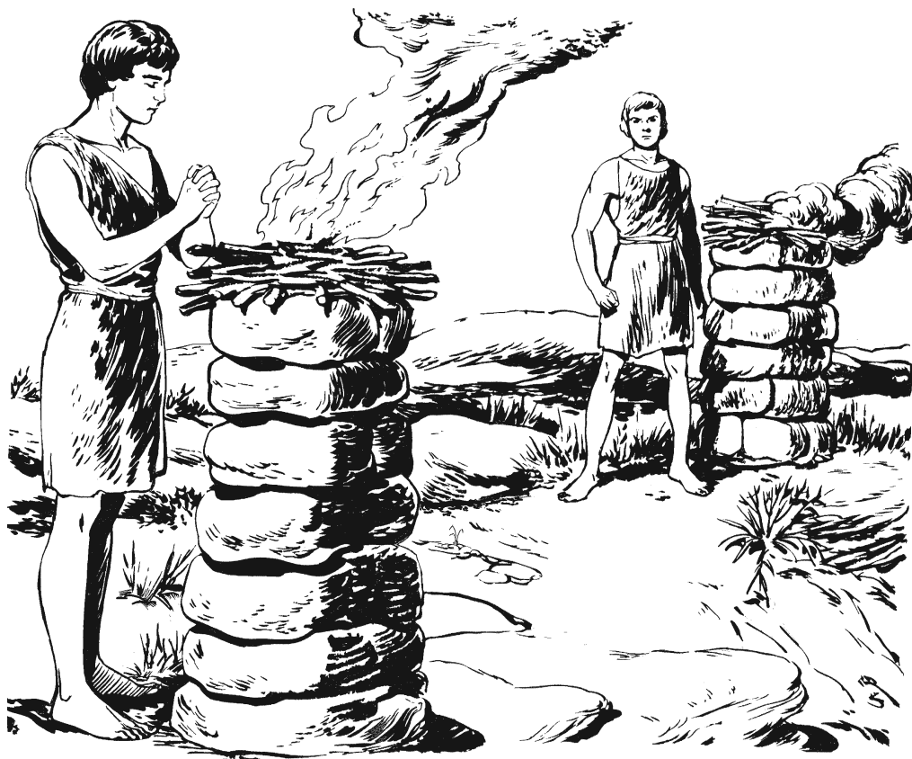
Anulú niniguu' ka'núú bu nixnájxiin Abél. (4.4)

inuu kuba'. 4 Xú'kuí-má Abél ni'ka kaguin mangaa mugu bu nigumii ginii kayuu', bu itaán rangín'. A'kuí dí Anulú Mekuíí niniguu' ka'yoo Abél, xú'kuí-má bu ni'ka kaguin nixnájxiin. 5 Muú dí tániguu' Anulú ka'yoo Kaín, ni-má dí nixnájxi. Ikaa jngóo pú niki'náa wéñúu' Kaín, ajndu