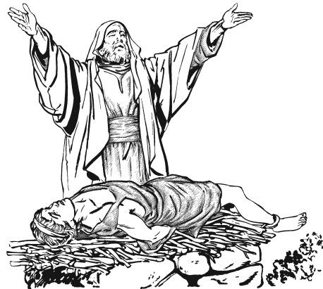
Abraám naxnájxi a'diáo dí maqañúu. (22.9)

Mbóó-má xú'kui egúún. 9 Ndóo niguá'nú náa dí ni'tí-má Anulú