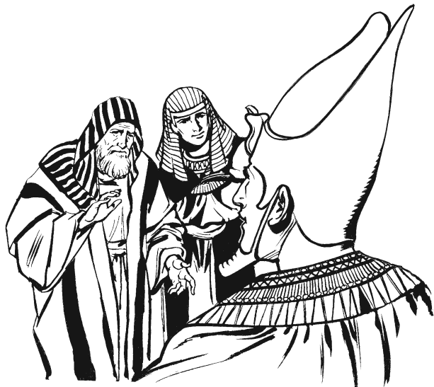
José najka kayáa anuu náa inuu Faraón. (47.7)

—Nguátá-lá siguaa' ikáán rá, xabü nikii.