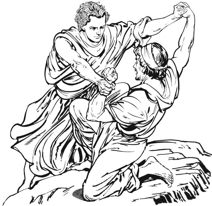
Jakób naḡi'duu gaḡmaḡ mbáa xaḡiya. (32.24)

Ikú-má ni'ni saḡku-rámáa' ikí. 30 Ikú Jakób nijxná mbi'yuu Peniél náa jmbaa' rú'kui, numuu dí ni'tí: «Ndiyoo mijngii xíḡi inuu Anulú, xú'kui-má nikríñuu' tákáñú'.»