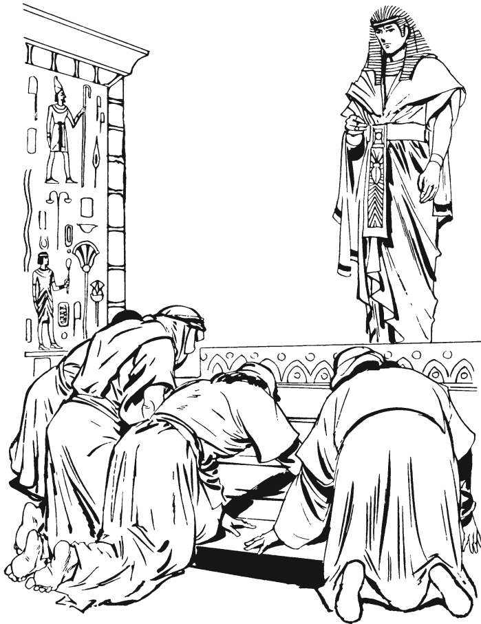
Nduya-majkuít anguiin José. (42.6)

5 A'kui niguwá' ejiin Israél gajmiúú i'wíin' xabü bü naguwá'- má gúsi, numuu dí ríga ewi' mbá xúguí' náa jmbaa' Kanaán. 6 Xú'kui-má José ñajuun' bü na'tí- ñájun' náa jmbaa' rú'kui, ikaa-má