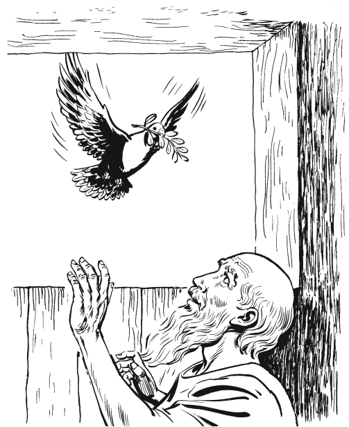
Nitangaa ni'kaa rigu náa kra'aa Noé. (8.11)

7 Ikú nikunguaan' mbáa yuwa' bu nijka rajngruigoo mbájni, ajndu nigituun náa nijndoo' inuu kuba'. 8 Xú'kui-má niku'maa mbáa rigu mangaa, mu dí mba'yoo má dí niguu' iya' náa inuu kuba'. 9 Nanguá nixkamaa nditáan náa magrigu rigu, ikú nitangaa ni'kaa náa gu'wá rguwa', numuu dí ka'nií kajni' iya' mbá xúguíi' inuu kuba'. Ikú a'kui nikruiya' ñawúun', nigrigu nikudaa' bujúu' náa gu'wá rguwa'. 10 Nigituun imbá-juan mbi'i, ikú a'kui niku'maa bujúu' rigu, nigájnuu náa gu'wá rguwa' nijka. 11 Najka rakí'