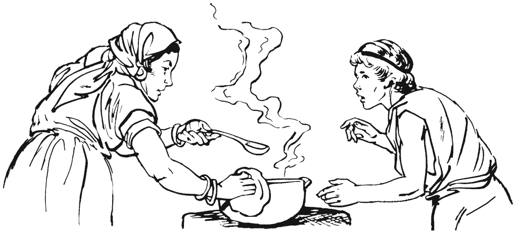
Naguma m̄jiúun' ganisu dí m̄iku anuu Jakób. (27.14)

—Aya rá. Sáa-lá a'diό' ñajuaan' ikáán rá.