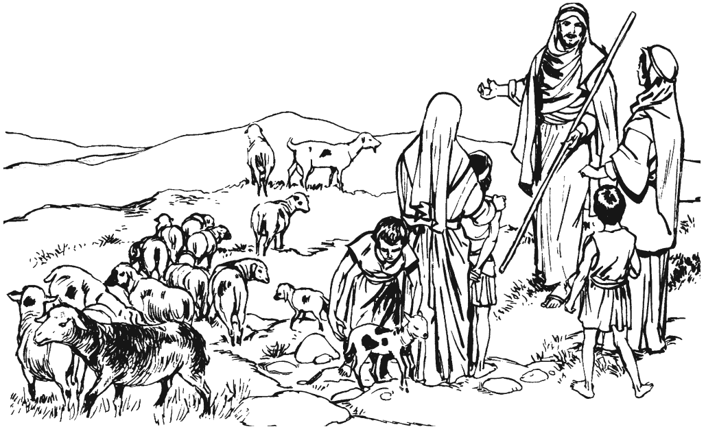
Jakób na'túún gu'wii dí matangaa náa xuajiun. (31.4)

mijxtiin ejiuún. Má dí ikaa na'tí: “Bū sma'níi' ma'ni bū matadaa' ikáán”, a'kuí dí mbá xúguíin' nagumii sma'níi' ejiuún. 9 Xú'kuí ka'nii dí Anulú nigruigú ká'yúu' xujkiúu anala, dí nijxniú' ikúún.