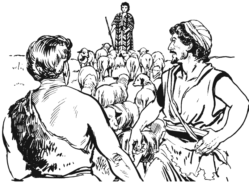
José najkanú náa kajchúún anguiin ruñúú mugu. (37.18)

A'kui dí José nijka náa nigúún anguiin, nixkamií jndu náa Dotán. 18 Ndoó ndiyáá José