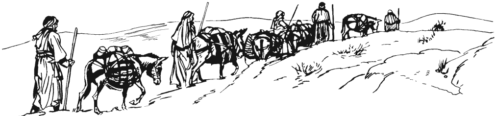
Naguún xígíí ejíin Jakób náa Ejiptó. (43.15)

20 —Tani mbaa ajkiaaán', xabu nikií. Ikáan'xu pú gajkuun-má dí nigúwá' gúsixu ganisu náki ginii. 21 Ndóo dí nijkuánúú'xu dí náa mbuyaa-xujxu a'kuí niraajkuí' gújxtuxu. Iki gíwán' bójkoó mámbáa náa awúun gójxtoó ndiyaaaxu, mbá káxixi-má bújkuxu. Ikaa jngóo dí kuya-má gúwaa'xu xúguí. 22 Xú'kuí-má kuya-gúwá'xu bujúu' bújkaa dí musí-má ganisu. Nanguá eyaa sáa ñajuun'