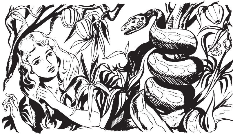
Ju lu okxchok'oi ju chako'ulh

Pus ju p'ulhnan lapanacni lacapuxanti ju ixtavilanalh. Chai ju yuchi puxanti lanach va c'us ixnavita ju Dios. Pus ju lu lana k'ox lai ix'a'okxchok'onun. Para ju ali' atapacxat ixnavita ju Dios palai jantu ixta'a'okxchok'onun.