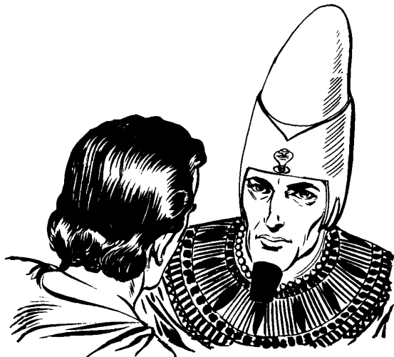
Ju Ose mavalalai ju aklak'avanti

Pus ju faraón laca'ilhch ni na k'ox ju chunch atalacpast'ac'at. Pus ju yuchi lhca'ulalhch ju Ose ixpu'ucxtin. Pus chunch ju puvalhch ixlhipumat'ui ucxtin ju Ose ju xalak'achak'an Egipto. Chai vachu' ju faraón xtaknilh