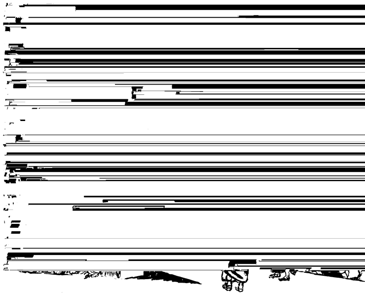
Ju lapanacni tayajui ju putank'ai chaka'

Pus ju anchach lacat'un tapastaclich ju lapanacni ixnavica ak'atam chaka' ju na putank'aich cava. Chai ju yuchi chaka' laich catalhicha'alh ju ixlhiputank'ai tus lact'iyen.