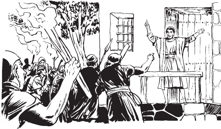
Ju lapanacni talakp'akx'ulaniputun ju ixmalhtich ju Lot

Pus ju ixpumat'ui'an anquilhnin tok'oxatach tacha'alh ju Sodoma. Pus ju Lot anch talhitaju junta ixlacxtuvi ju laxamalhtich ju ixpulak'achak'axnucan ju lak'achak'an. Pus acsni alakts'istuclh ju Lot lana alh alaclak'apakxtoktaina'.