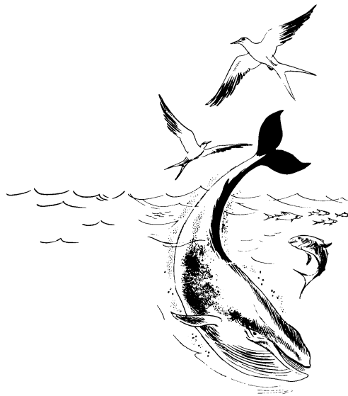
Navicalh ju pamata'

Pus ju ixlhilakaquis avilhchan alacnavi ju ts'oknin chai chux ju atapacxat ju tat'ajun lacxcan. Pus ju aecnich lakts'ilh ni lana k'ox c'us ju tuchi ixnavita. Chai alacjunilhch ju lac'atapacxat ju tat'ajun ju lacxcan chai ju ts'oknin ni na lhu catamak'ampup'ak'atnalh. Pus ni ixlhuch'an catajuna' laich catalacaputoc'ak'o ju lacat'un.