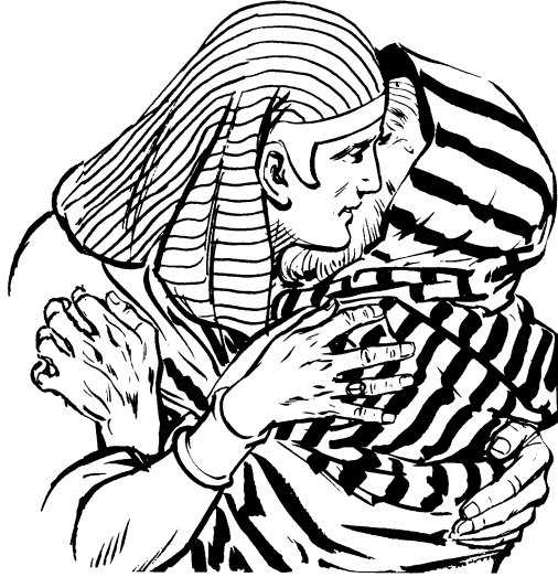
Ju Ose t'alalak'atanui ju ixpai juncan Jacob