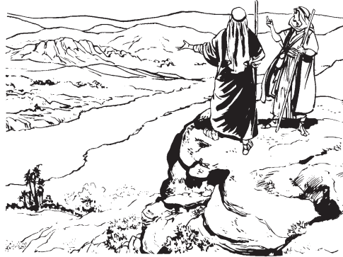
Ju Abram sacmi tas anchach ju lhitolhputun ju Lot

Pus ju Lot lakts'ilh ju k'ai acpujun ixma vanin ju laxak'aixcan Jordán. Chai ju anch lacat'un na k'ox ixjunita ju pucuxtu. Chai na lhu ix'alin ju xcan. Pus ixlhiyuchach pusacxtulhch ixtolaca ju anch lacat'un. Chai yaulich ju ixlonachaka' vanin ju xalak'achak'an Sodoma.