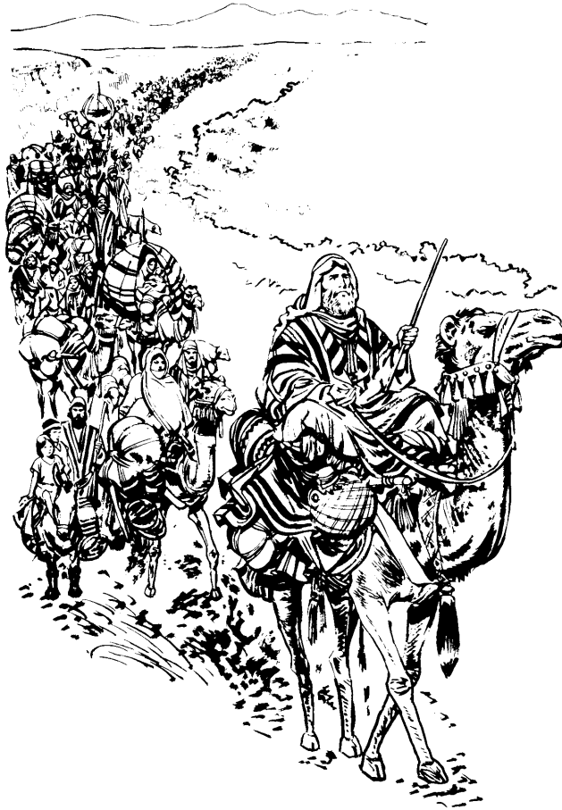
Ju Abram taxtui ju la'ixt'un

'Pus ju Abram quiclaca'i ju Dios. Chai taxtulh ju xalak'achak'an Harán. Pus ju acsnich ixpacxantach ju 75 c'ata ju Abram. Pus alacchi'alh ju ix'amachaka' juncan Sarai chai ju ixpuxlimtich juncan Lot. Chai vachu' alact'alhi'alh ju ixlapanacni chai chux ju ixlactaxtokni. Pus acsni tataxtulhch ju Harán ta'alh ju Canaán.