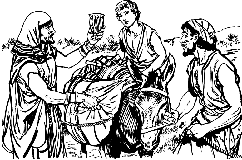
La'ixcuxta Benjamín lhitajunicalh ju xcopa ju Ose

ix'okxtapalhni ju Benjamín. Pus ju chunch jantuch palai na catimak'alhk'ajnalh ju ixpai'an.