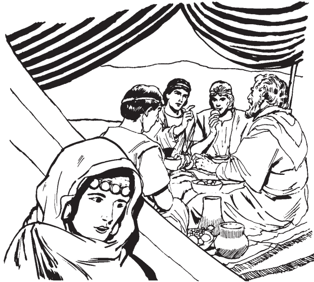
Ju Abraham alact'avajin ju ixpumat'utu'an lapanacni ju taquilakquilalh

la'ixchaka'. Pus ju pumatam ixlhiyu'unch ju ixta'alakxcavatayananta yuchi ju Dios. Pus ju yuchi tach lapanac ixminta. Chai ju yuchi junilh ni catasp'itchokoyanta ju ixlhitam c'ata. Chai ju acsnich ju Sara ca'alinach pumatam ists'alh.