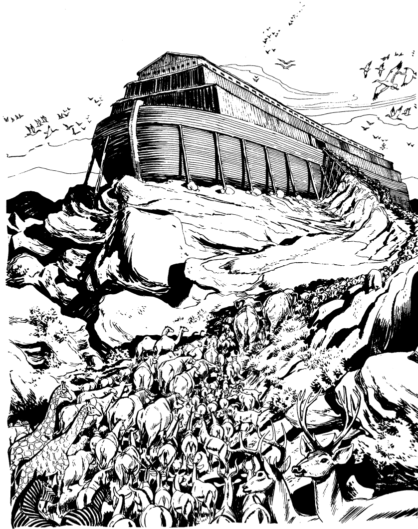
Ju lac'atapacxat tatanui ju lacabarco

vaclhunch ju ixlacta'acxtui ju xcan. Chai lana lacapuch'apak'o ju lacat'un. Pus ju acsnich ju barco tsuculhch ta'akst'ana' ju la'ix'uexni ju xcan. Pus ju xcan lana akxt'akmak'o chux ju talhpa.