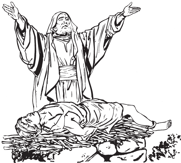
Ju Abraham mamai ju Isaac ju la'ix'ucxni ju ixpulkan'ayacan ju Dios tach tam lhak'ailakts'inti

Pus acsni tacha'alh ju anu' lactalhpa, ju Abraham navi lakatam ixpulkan'ayacan ju Dios. Chai ju yuchi si chiux ju lhinavi. Chai mak'aixtoklich ju q'uiu ju capumalhculayach. Pus ju astanch makch'ilh ju Isaac. Chai mamalhch ju la'ix'ucxni ju q'uiu. Chai saclich ju cuchilu ju capumakniyach.