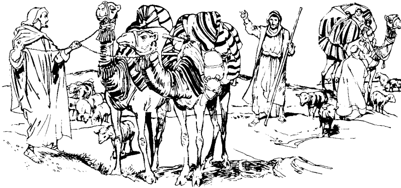
Ju ixlapanacni ju Jacob alacpumuc'ai ju camellojni

Pus acsni tataxtulh ju Raquel lack'alhonilh ju lact'icst'i ixlacdios ju Labán. Pus va ixtanavin lapanac ixjunita ju ixlac'ak'ayai ju Labán. Para ju yuchi lana jantu tu'u' ixjunita ju Jacob ixlacata ju tuchi ixnavita.