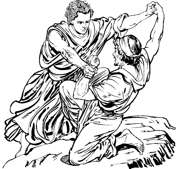
Ju Jacob t'alsai ju Dios ju lacati