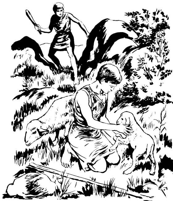
Ju Caín makni ju ixp'isek'e

lana va lacats'unin ju a'iya' ju xatoc'at ju min'ach'ananti. Chai lanach k'ox makat ju a'ucxup'ina' minch'alhcatnat. Jantuch va ani.