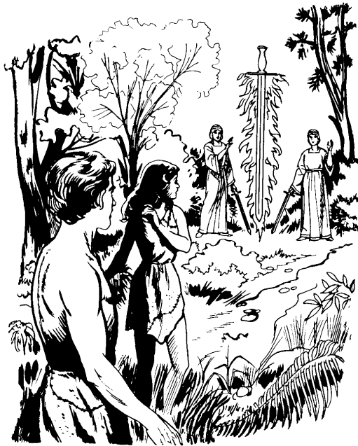
Alacmxtucan ju lacapuxanti chai tatayai ju anquilhnin junta putanucan

Pus ju acsnich ju jok'at Adán ixjuncan. Chai ju Adán va nomputunch t'un. Chai ju ix'amachaka' Eva lhimapaka'u. Pus ju Eva va nomputun atsucunti. Pus yuchach ju xanatich cajuna' chux ju lapanacni ju catatsucuya' astan.