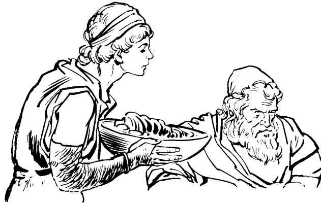
Ju Jacob lhimini ju ixvaiti ju Isaac ix'okxtapalhni ju Esaú

Pus ju acsnich ju Rebeca malakch'inilhch ju Jacob ju ixlacpumpu' ju Esaú. Chai ju la'ixlacmaca' lacmacmuc'alhch ju ix'axt'ak'an ju tentson. Chai pixtumuc'alhch vachu' ni na pixtupalhilhich cava tach ju Esaú. Chai xtaknilhch ju ixlak'oxitach ju vaiti. Chai junilhch ni calhi'anilhch ju ixpai. Pus ju chunch laich capusq'uiniya' ju ixpai ju Dios ju k'ox atsucunti ix'okxtapalhni ju Esaú.