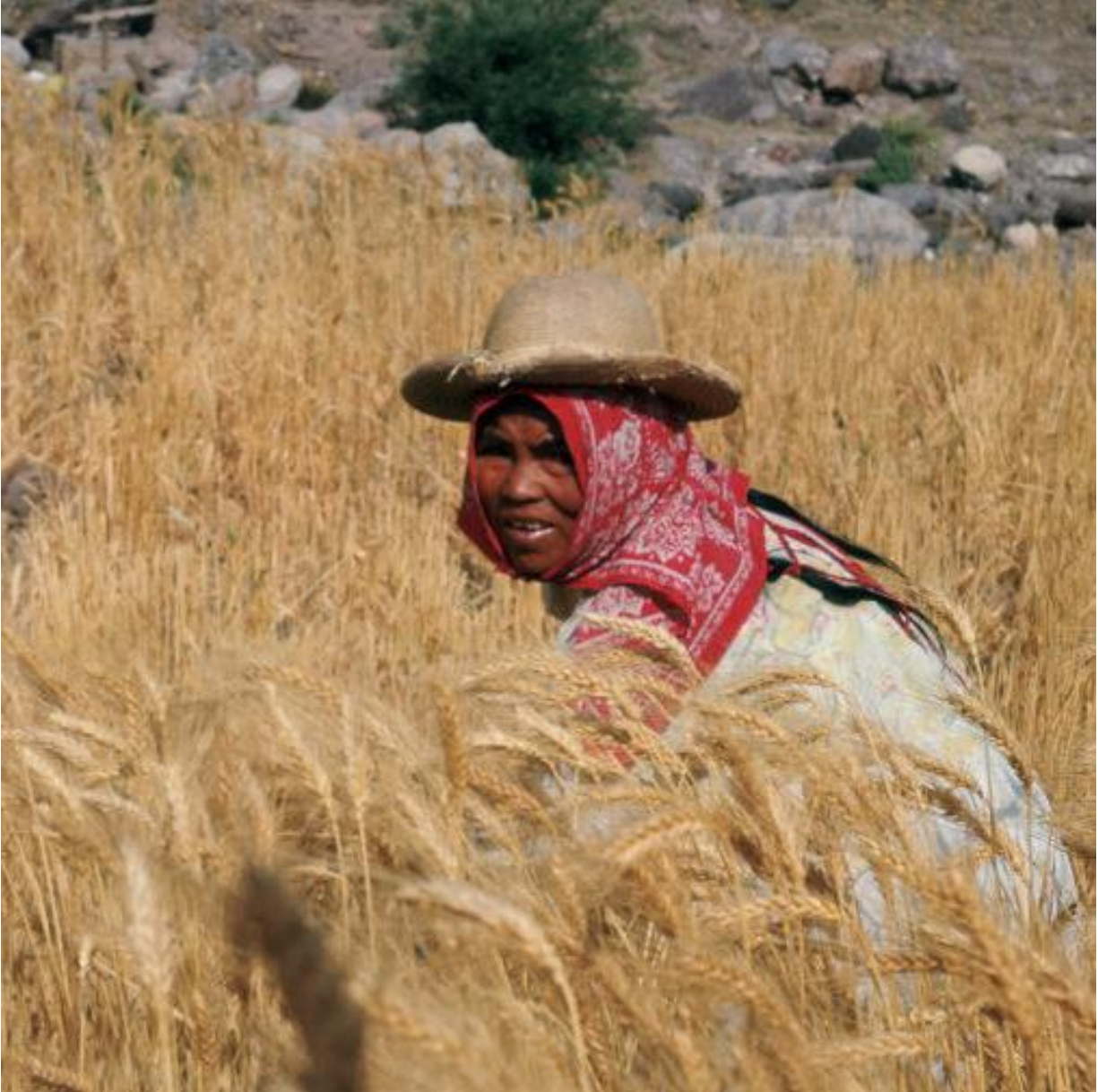
ri'ligó 'wíami (Salmo 4)