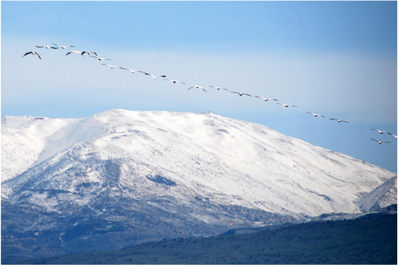
alé Israélichí rabó Ermoni anilíachi (Salmo 121)