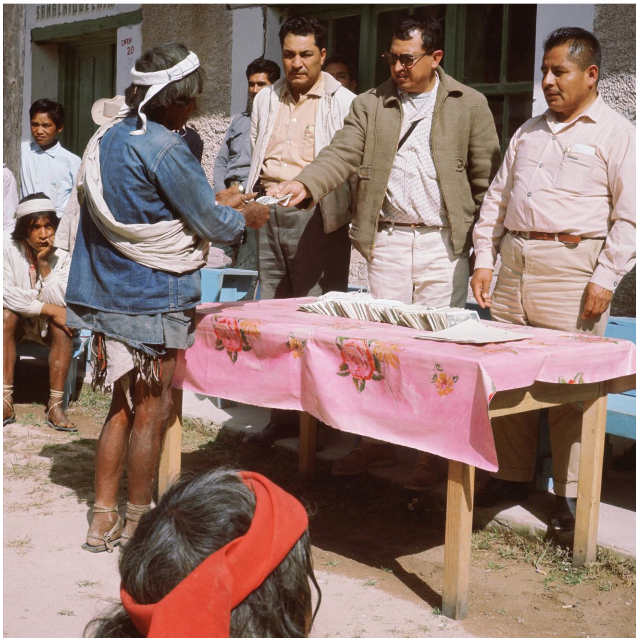
wenomí nachuta (Salmo 15)