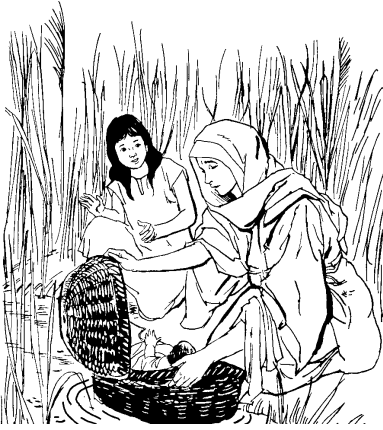
मोसा कली खुइशशो