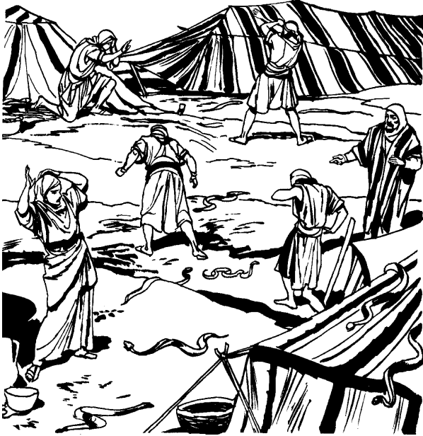
Dios tanaax, ronobaon natexa mawákana.

3 Jaskáribiakindra jatíxonbi, ja Diossenbi jato menia piti jawékiakana iki.