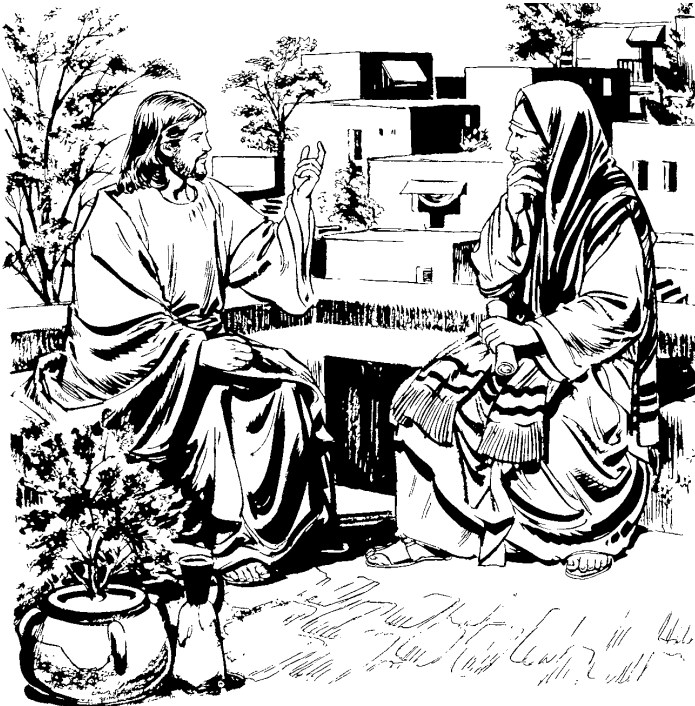
Nicodemo, Jesús betan yoyo ika.

6 Ja jonin aká pikota bakera ja keska joniressibi iki. Ikaxbi ja Diossen