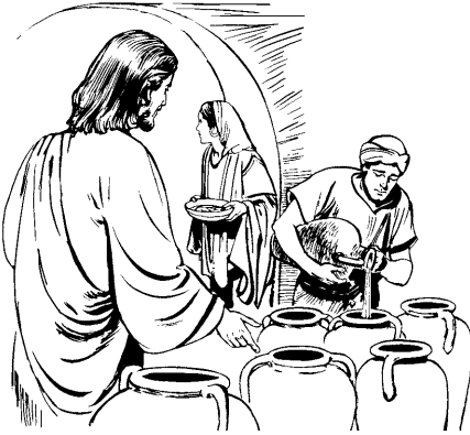
Jesussen onpax vinomaa.

ikinnai koshi boxontankanwe —akin. Jato jaskáa boxonkana iki.