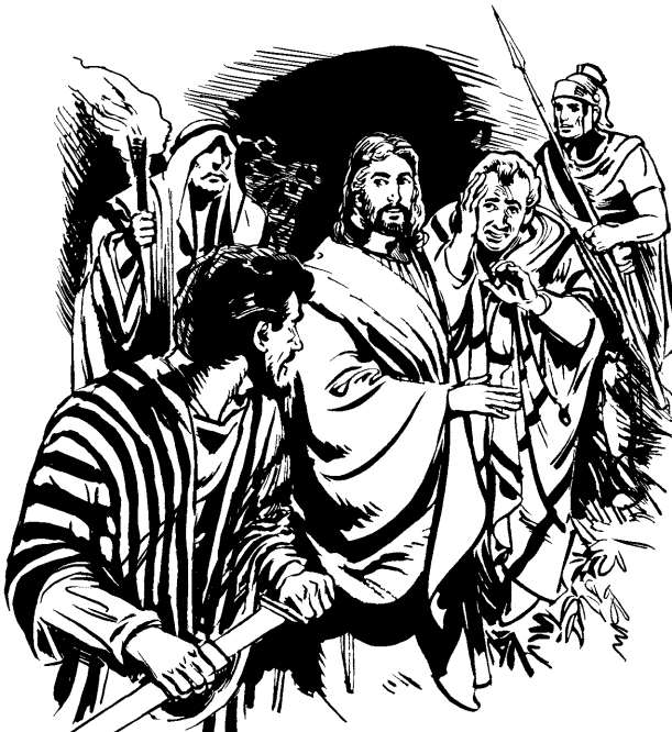
Pedron Malco paxtea.

13 Jaskáaxon Anássibapari bokana iki. Ja Anás iká iki Caifásen rayos. Ja