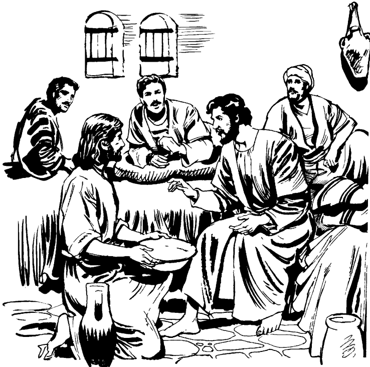
Jaonmea onannaibo Jesussen tachota.

8 Jaskáa Pedron yoiribia iki: —¡Jawetianbira en mia nokon tae