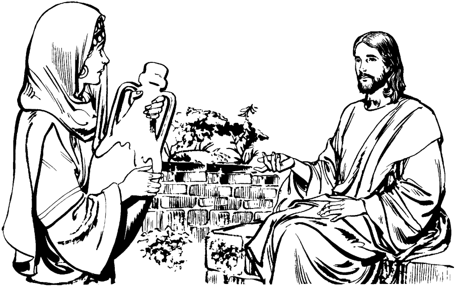
Samaria ainbo betan Jesús yoyo ika.

¿Jatian jaweranoakayaki ea jan jatibitian jamati onpax min ea meniti iki?