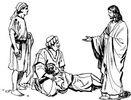
Bake yoshina Jesussen benxoa.

39 Yoshin já meran jikixonra, sion imai jaskáakinra pakeai, jainoaxa bakox