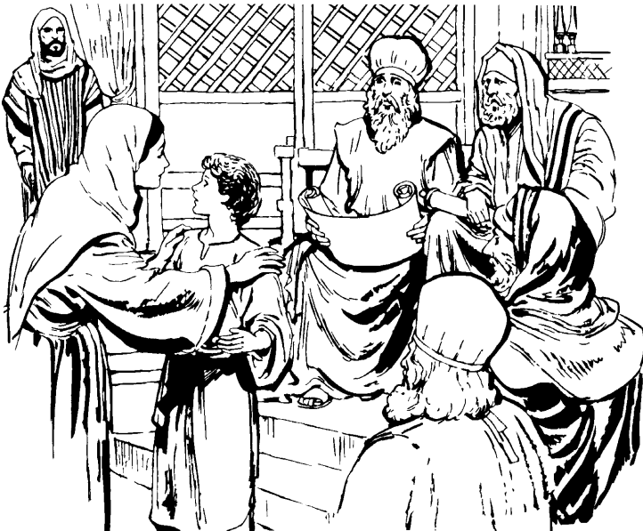
José betan Maríanin Dios rabiti xobonkonía Jesús nokoa.

44 Ja Jesussen anibaon shinanna iki, ja joni icha bekanai xaran joái. Jaskáakin