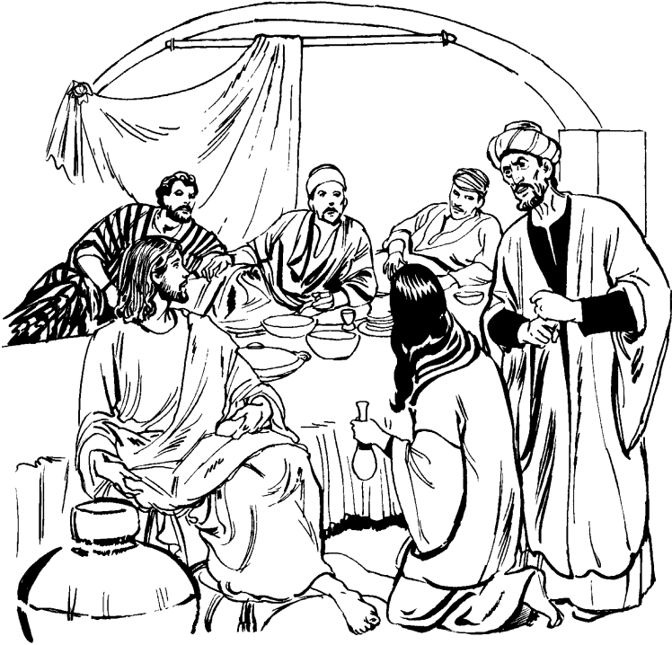
Ainbaon Jesús inintinin tachota.

43 Jaskáa Simonman yoia iki: —En shinannara, ja bebon icha ribinya jonin aká iki —akin. Jatian Jesussen yoia iki: —Ikonra min yoike —akin.