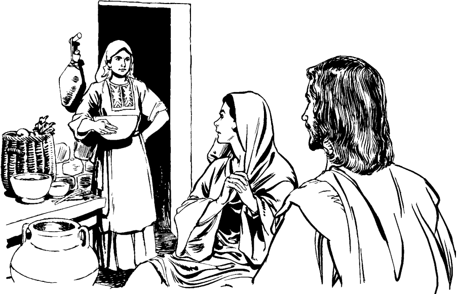
Martha betan María.

wetsan eabicho tee amaiki min oinyamaa? Ea yoixonwe ea akini jonon —akin.