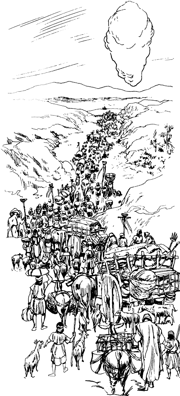
Israelitabo nai koin chibani bokana.