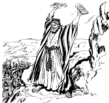
Diossen esé Moiséssen bia.

22 Jatianra Aarónman yoia iki: —Nokon ibó, eki sináyamawe. Minra kikinhakin onanke, nato jonibo jakonma atin keenbo.