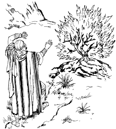
Moiséssen zarza jiwí tiritai oinna.

3 Jatianra shinanna iki: “¿Jawe jawé-kibira jaskaisma iki! Oinparibatanon,