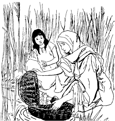
Moisés bake tasakan toxbata merakana.

2 jara toota iki, jaskatax westíora benbo bakeya iká iki. Jan oinna ja benbo bake metsá iketianra, kimisha oxe senen jonea iki;