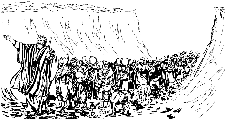
Israelitabaon aniparo shita.

24 ikaxbira ja nete xabataitian ja chii tiritai pania meraxon, itan nai koin