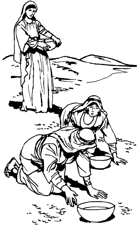
Israelitabo Diossen jato maná menia.

33 Jatian Aarónra yoia iki: —Tasá bixon, jain rabé litro maná napówe.