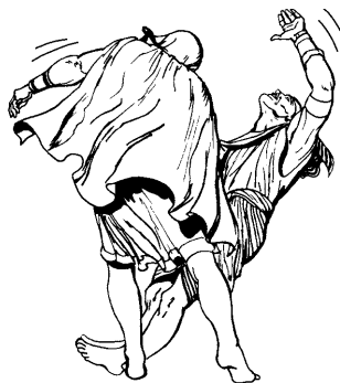
Israel jonibo faraónman jakon-maakin yonokin masá tenemea.

12 Jatianra jatfíbiain oken oinbekonabi jain tsoabi yamaketian, ja egiptio joni retexon, mashin miinna iki.