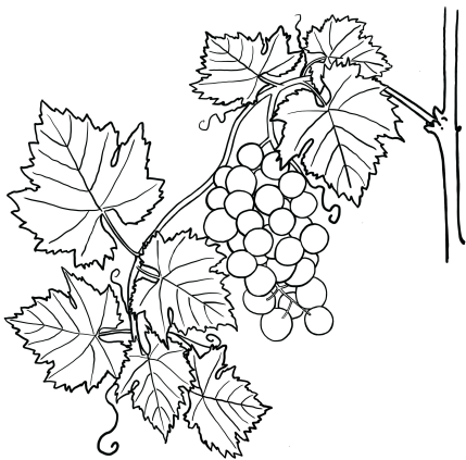
Hoova hant ihiti quih haa ha. (15.1)

5 »He hehe hant quti cap ihpthaa ma, me iiselca coi haa ha. Hisoj quij iti quiiij zo haquix piih ta, isoj quij iti hpiij ta x, anxö sisi aha. He hiiqui mapomoocp x, ziix seehe cömocoaaj quisil ipi haquix smahca aha. 6 He hiiqui imoocp zo haquix piih x, hehe iiseja quih ziix z imahsiiijim, himo cooit, taax oo ipomis x, cösootij caha. Ox popacta ta x, ptiti