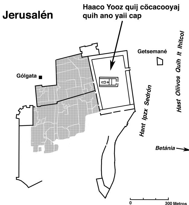
Heezitim Jerusalén quij imozit hac haa ha. (18.1)