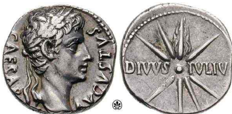
Tom caaiscan denaario hapah coi zo haa ha. (6.7)

—¿Háqui hapiihtoj, ziix hapahit zo hapitalahaajö ta, isiitøj ca siihi? —ox imii.