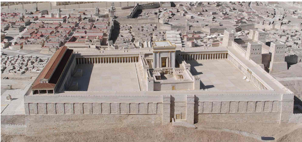
Haaco Yooz quij cöcacooyaj quih ano yaii cap iiqui hapaii quisil iha. (7.14)

† Icaaitom Caaixaj : Ziix hant ihiiip Yooz quij xiica quiistox jodíoj hapah coi oo cöitah, hantx moca Moisés quij cöiyacohot iha.