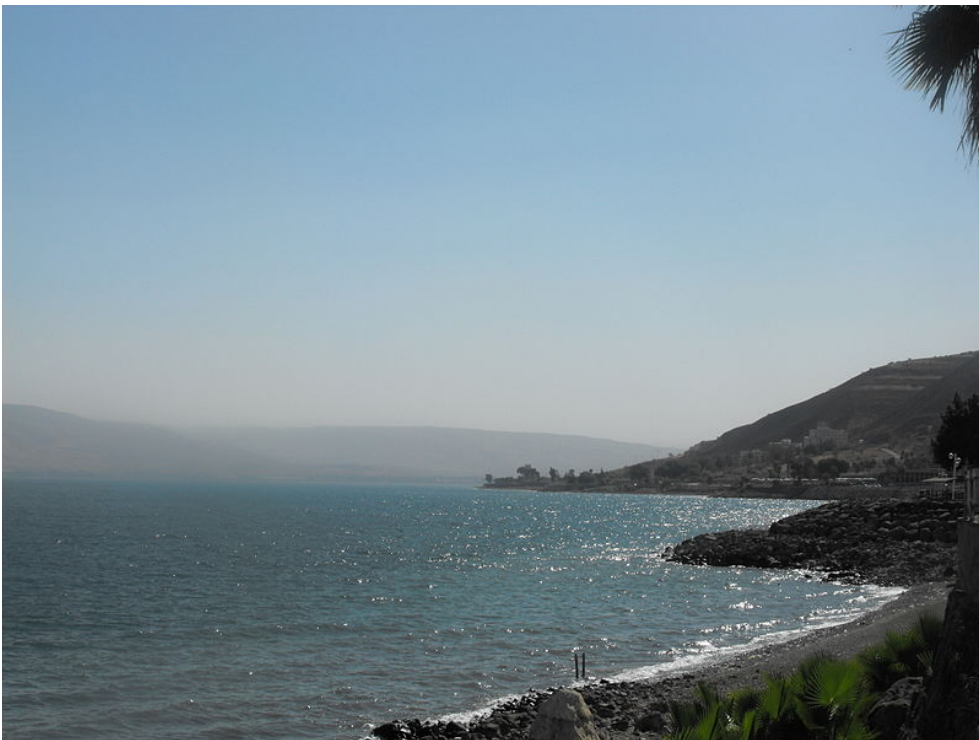
Háx caacoj Galilea hac ano coom com haa ha. (6.1)

me siitom taa camjöc iha xo tii oo mazi siih caha. 46 Moisés quij he hiicp hac ziix quih iic caahca, taax oo hapaspoj quih it hant ooquim iha. Iitom hac cömayahiihj poquex, hiicp hac mos cömasahiihj aha. 47 Ox oo mpacta xo, icaaitom quih hant ooquim coi cömimahiihj hac, ¡¿zó popacta ta, he hiitom zo cömasahiihj teee?!», ox mee.