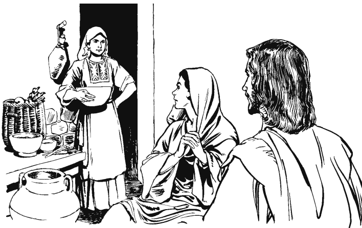
San Lucas 10.38-42

38 Jerusalén marcapa aywaycashan'chu juc marcaman purishijnincuna-ima Jesús chayaran. Martapa wasinman chayaptin, pachächiran. 39 Martapa ñañan caran María. Jesús willapäcuptin, jamacuycur María sumaj wiyacuran. 40 Martam ichanga wasi rurayninwan