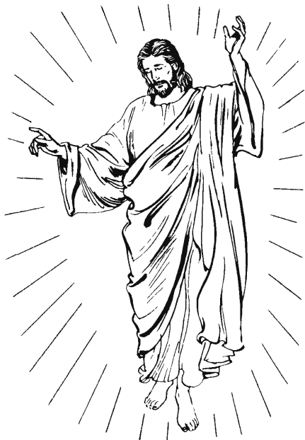
San Lucas 24.50–53

52 Apacuptin purishijnincuna jungur- pacuycu, Jesústa manchapacuran.) Jinarcu Jerusalén marcaman cushi- shalla cuticäriran. 53 Chaychu waran- waran Tayta Diosninchipa wasillanču Tayta Diosninchita alliman çuraran.