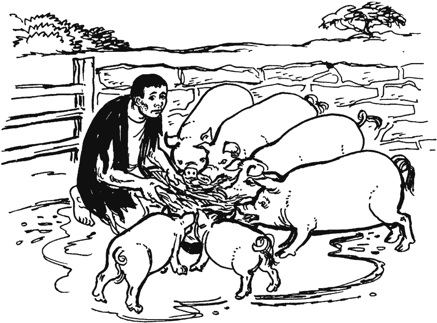
San Lucas 15.11–32

llucshircur, papänin jayaran. 29 Jayaptinsi mana munarshi, niran: «Papä, chay-chica wata maquiquichu juyä. Shimiquitapis llapanta wiyacuschá. Chaypis mana juc capshillatapis jumashcanquichu tünata rurar micupacunäpaj. 30 Ñuñushniquipämi ichanga allinnin türütutaraj pishtaycachishcanqui. Payga runan-runan puricuj warmicunawanshi llapan jillayniquta ushyasha.»