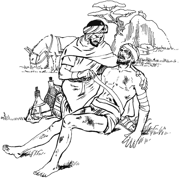
San Lucas 10.25–37

caycan. Shunguyqui munashanta llapanta camacächishcanqui, Papä.»