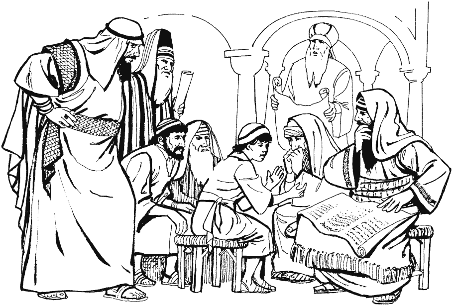
San Lucas 2.41–52

marcachu Jesús caycashantam ichanga maman-taytan mana musyaranchu. 44 Manchäga runacunawan tallucash aywaycashanta yarparan.