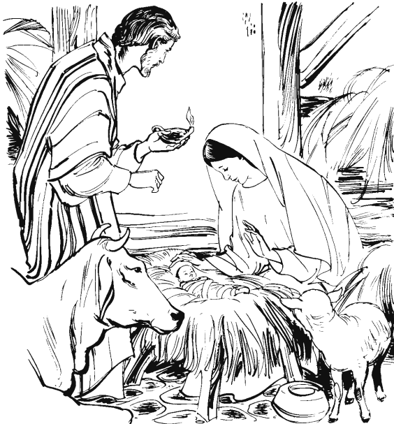
San Lucas 2.1–7

3 Yupacänanpaj lllapan runa yurishan marcanman-caman cutiran. 4-5 Chaymi Josépis warmin Mariawan aywaran Galilea quinranöchu Nazaret marcapita Judá quinranöchu Belén marca- caman. Chay marca unay auquillun Davidpa marcan caran. Davidpa