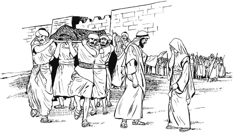
San Lucas 7.11–17

apaycaywan tincuran. Juc biyüdapa japallan wamran wañush caran.