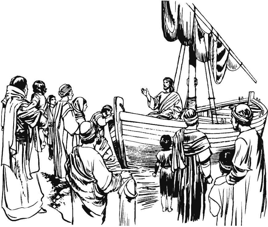
San Lucas 5.1–11

pacuycur, niran: «Tayta, manchacujmi. Witicunquiman. Juchasapa car, ñaupayquiéchu caytapis pingacü.»