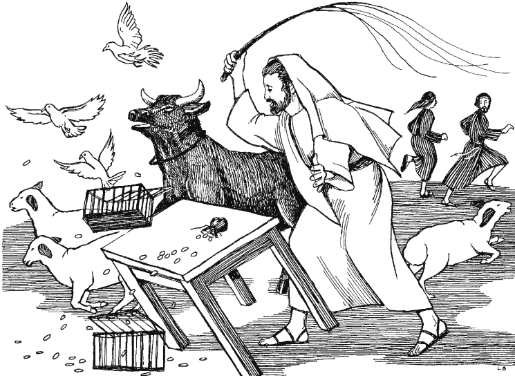
San Lucas 19.45–48

Jesús jishyačhucunata allchacächisha. Supaycunatapis jargusha. Wañushcunatapis cawarachisha» nir.