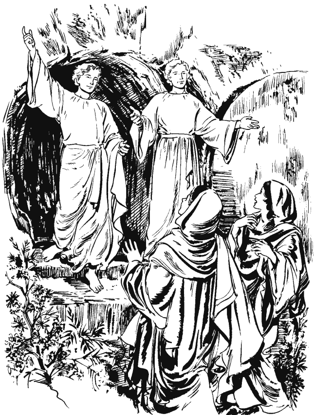
San Lucas 24.1–12