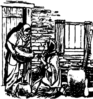
CO20968 Ruth shows basket of grain to Naomi

14. Chihuasha Boozpa chaquibi puñusha pagarira. Ña punzhayaushcái chara ansa acllaita atarira. Booz yuyarira mana pihuas yachanauchun nisha shuc huarmi caima shamusha puñushcata. 15. Chihuasha nira --Canba aparinata allpái mandai. Chibi churara cebadata aparina jundacta. Rigrái aparichicpi llactama rira paihua cari mama huasita.