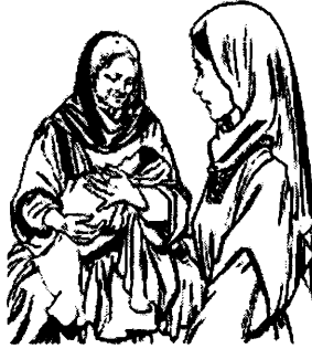
CO0097: Noemí ho'áa ba'á: Obed, Ruth ho'áa en

17. Paihua mayanbi tiyacuna shuc shutita churanaura nisha Noemíraicu shuc churi ña charinmi. Chasna nisha shutichinaura Obed. Cai man Isáihua yaya, Isái randi Davidpa yaya. 18. Caiguna manaun Faresmanda miraiguna, Farespa churi mara Jesrón. 19. Jesrónba churi mara Ram. Ramba churi mara Aminadab. 20. Aminadabpa churi mara Naasón, chimanda Naasónba churi mara Salmón. 21. Salmónba churi mara Booz, chihuasha Boozpa churi Obed mara. 22. Obepa churi Isái mara, Isáihua churi David mara. ( Rutga rey Davidba yayahua apamama mara. )