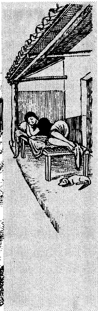
Mana Allin Warmi