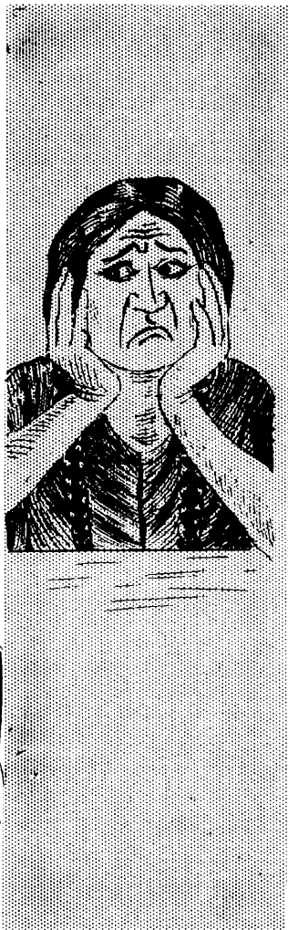
Mana Allin Warmi