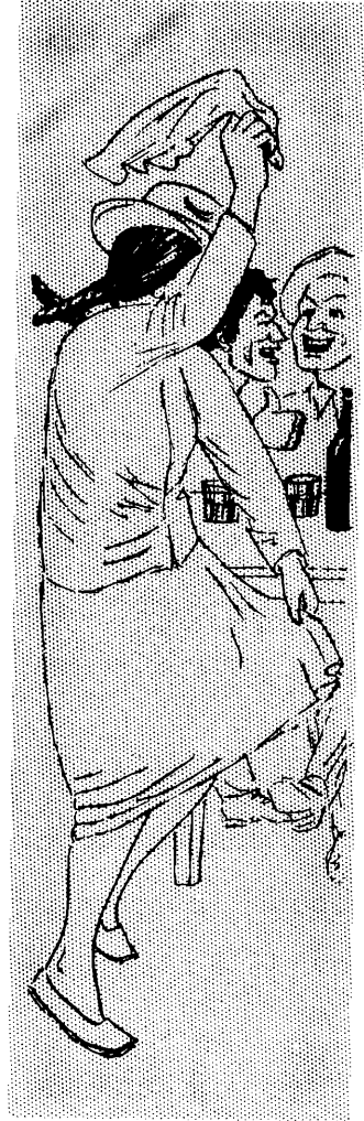
Mana Allin Warmi