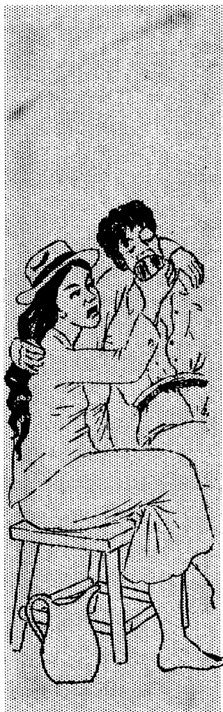
Mana Allin Warmi