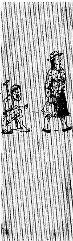
Mana Allin Warmi