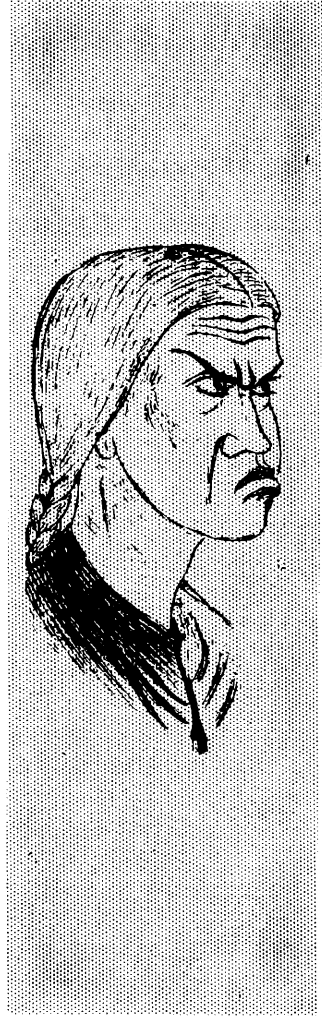
Mana Allin Warmi