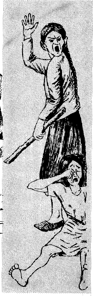
Mana Allin Warmi