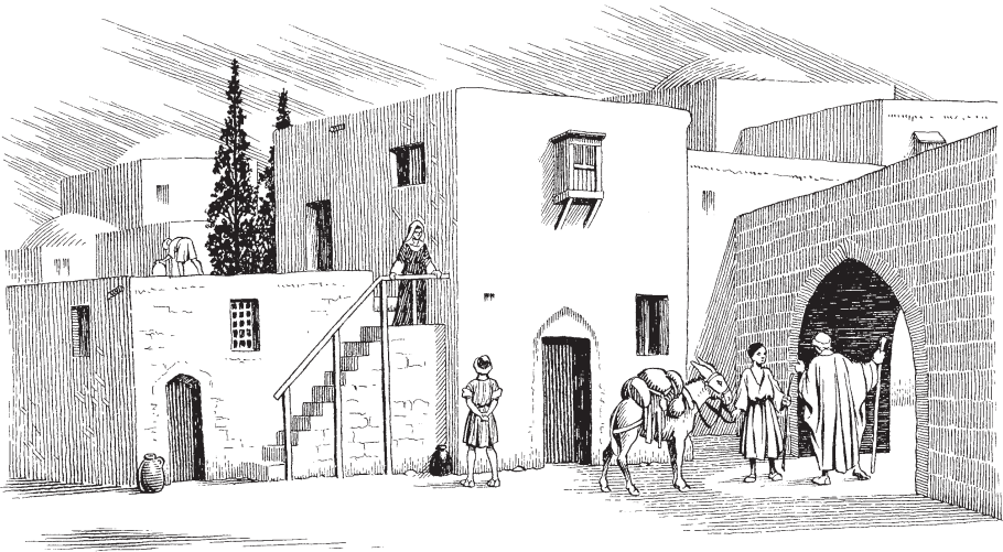
Siudáman yaucuna puncucho parlashan (Eze. 33.30)

mana munashä cajtami rurarcaycanqui. Llapayquipis majajoy-purami cacunqui. ¿Chayno ruraycarchu yarpañqui nasyunpa duyñun cayta?»