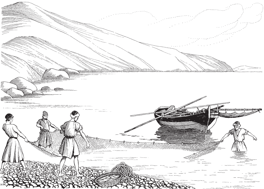
Pescädu charejcua (Eze. 47.10)

Nircorga mayu cantullanpa cuti-chimaran. 7 Chaycho ricarä mayupa ishcan-lä cantuncunapa aypalla yöracuna caycajta. 8 Chaymi runaga nimiran: «Cay yacuga aywaycan inti yagamunan caj-lämanmi. Chay yacuga Arabäpa pässhpan Cachi Lamarmanmi chayaycan. Chayman chaytintin lamar yacuga mishquej-manna ticraycan. 9 Maymanpis cay yacu chayashan cajchöga tucuy-niraj animalcunami cawanga. Chaynömi aypalla pescäducunapis canga. Cay mayu yacuga ashgaj yacucunata mishquej yacumanmi ticrarachenga. Chauraga llapanmi imapis yacuwan cawaj cäga cangana. 10 En-gadi partipita Engelaim particamami pescäduta charej-cunapis canga. Chay quinraychömi redancunatapis chaquichenga. Chaychöga Mediterráneo lamarcho cashan-nöraj aypalla tucuy casta pescäducunami canga. 11 Mitu-mitucunacho,