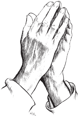
Tayta Diosta mañacushan (Salmo 57, 58)