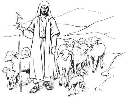
Tayta Diosmi michimajnë (Salmo 23)