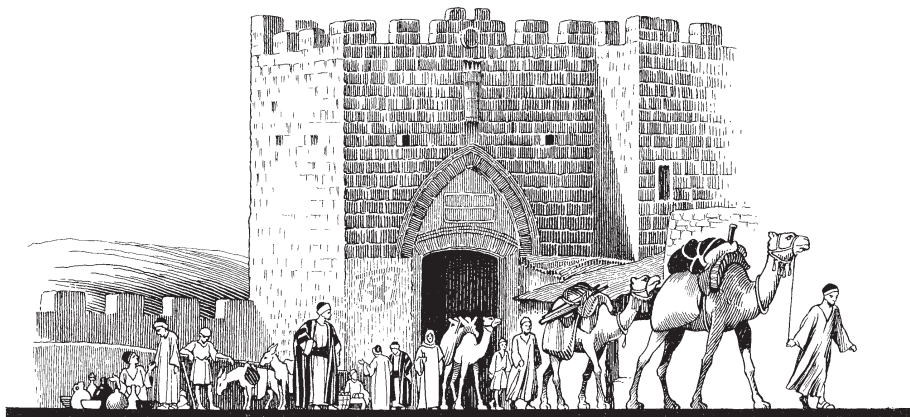
Siudäman yaucuna puncu (2Crón. 32.6)

9 Senaqueribga llapan suldäruncunawan Laquis siudächo carcaycashanpita