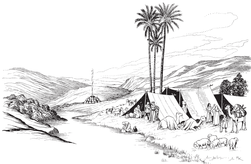
Abraham tiyashan tolducuna (Gén. 18)

18 1 Mamrepa chacran encina yöracuna caycaj ñaupanchó Abraham tiyaycaran. Chaychömi inti pullan junaj fiyupa shanapтин Abrahamga toldun puncucho jamaraycaran. Chay örami TAYTA DIOS