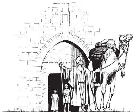
Cargata apaycaj camëllu (Gén. 31.34)

33 Labanga ñduluncunata ashej yaycuran Jacobpa toldunman, chaypita Leapaman, chayno Jacobpa ishcaj uyway warmincunapamanpis. ñduluncunataga mayganpachöpis mana tariranchu. Leapa toldunpita llojshirir yaycuran Raquelpa cajman. 34 Payga ñduluncunata charircur pacariycuran camëllucunapa carunancuna rurinman. Nircur janman jamacuycuran. Labanga chay toldu rurita auchiypa auchir intëruta ashiran. Ichanga mana tariranchu.