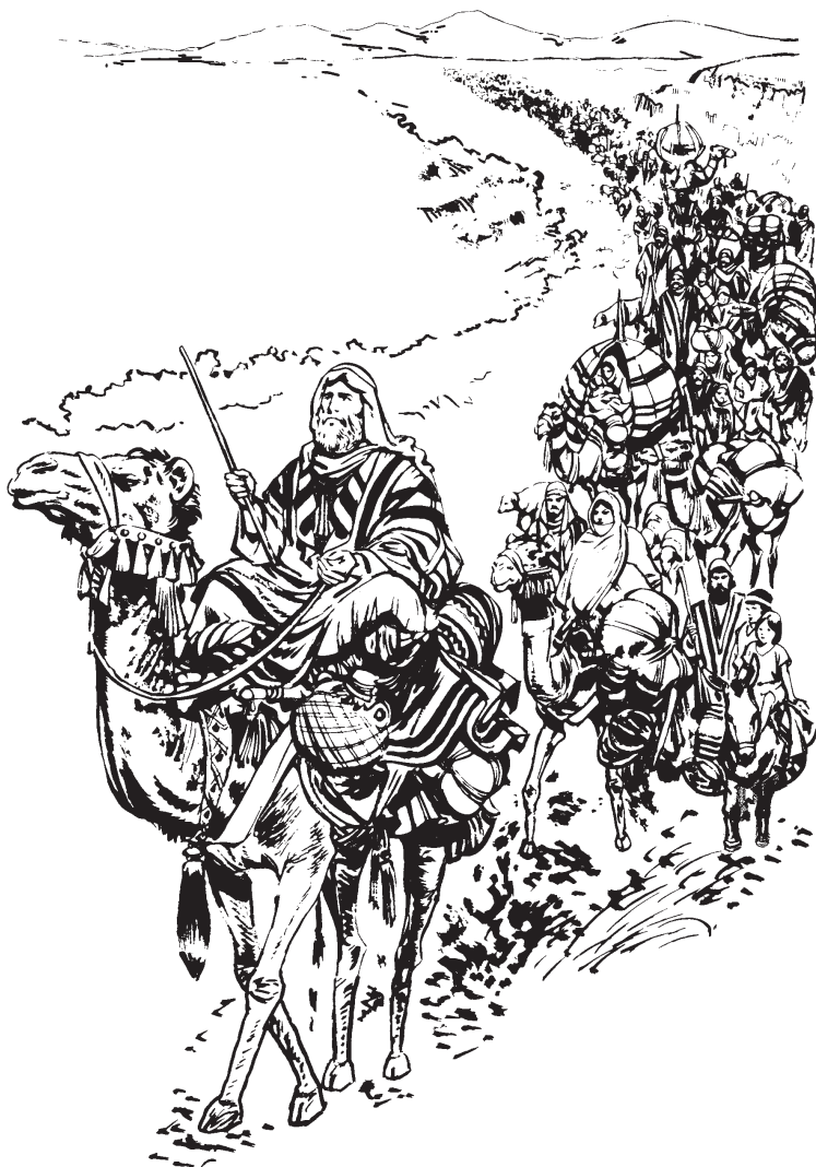
Ismael nigusyanticuna (Gén. 37.28)

33 Wamranpa tünicanta rejsircur Jacobga niran: «¡Cayga wamräpa röpanchaj! Tincuptinchari wamrä Josëtaga jirca animal micucurcusha.»