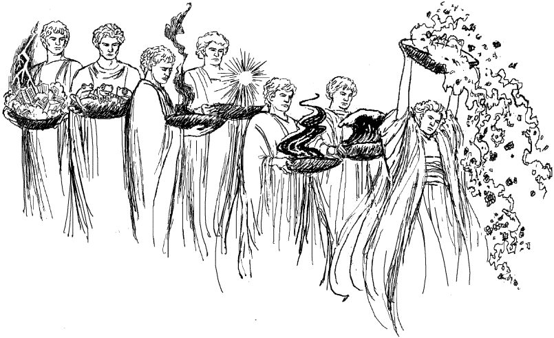
Yaato ángel ko yaato thi tangi tsu'en (Apocalipsis 15:1)