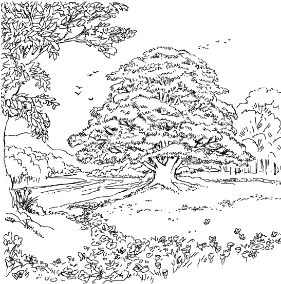
Ntha nchegechon ni (Apocalipsis 2:7)

ko ithjue'a choo ra inchin are nakuexinxon ra bithikaon ni ra. 5 Mexinxin xraxaon ra thinoo kuexinxin ra binche'e ra thi jian'a, ko danchia ra sitjaña'a ra thi jian'a binche'e ra ko kjan nche'e ra inchin are nakuexinxion ra bithikaon ni ra. Ja sinche'a ra ji'i, ja'an tuin saso ngajin ra ko sinthjianxin ngajin ra candelero. 6 Aro ja'an nchexruxinna naa thi ja'a ra nche'e ra, ko mee ixin ningaku'en ra thi nche'e chujni nicolaítas inchin ja'an kai ningakuan thi nche'e na. 7 Ja'a ra xro thi'in ra, thinxin ra jian thi ndachro Espíritu Santo ngain ni'ngo te'i: Kain chujni tsixi'in ko sinche'a thi jian'a, ja'an ruchja'a na juachaxin sine na thuchjuiin ntha nchegechon ni, ko ntha mee