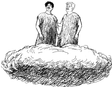
Yoo chujni rua'an Ndo Dio (Apocalipsis 11:3)

—Dingathjen ko dathechu'a ningue Ndo Dio ko altar, ko thekin keja'in chujni nchesayexin ndo nthi'a. 2 Aro dathechua'a patio jii no ndujaxin ngain ni'ngo ixin nthi'a ubayee chujni dithikaon'a Ndo Dio, ko chujni te'i chrjuin'a sinche'e na nguii yoo kan ko yoo kunithjao ngain rajna binchenaon ndo. 3 Ko ja'an rurua'an yoo chujnina ko sengaa na luntho dengaa ni ta juachjaon ko runichja na ixin ja'an 1260 ncha'on.