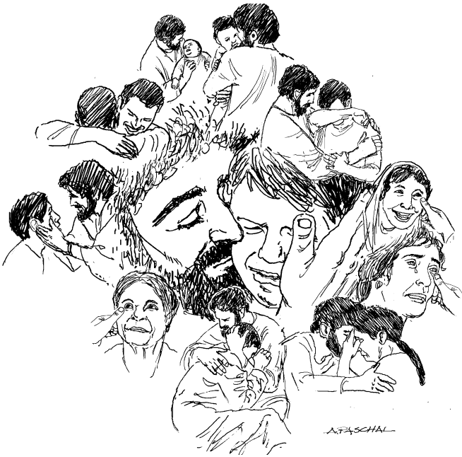
Ndo Dio suni kain ndakon chujni (Apocalipsis 21:4)

ise'a juachjaon ko ixru'in thi tsiin nã ixin kain thi be'e are sa'o, ise'a.