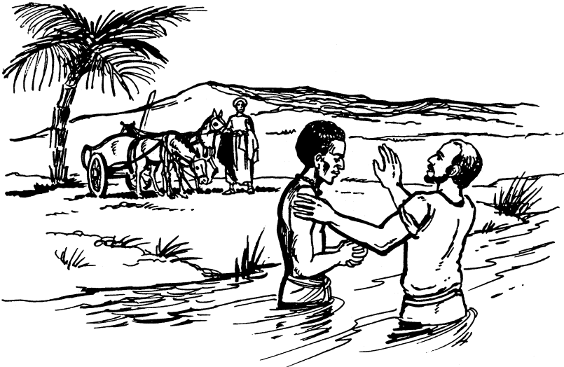
Felipe binchegithe naa xii eunuco (Hechos 8:28)

33 Ko chujni kjuanua nā je'e ko xru'in kensen binche'e jię ixin je'e.