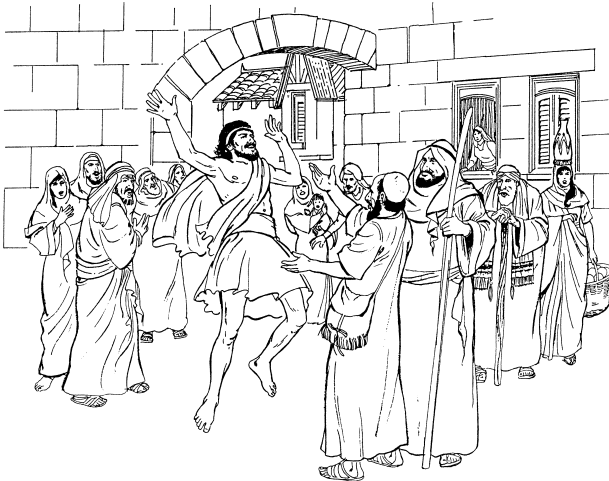
Kuxrue'en naa thi chro'a bakji (Hechos 3:8)

7 Kuthejan Pedro tse'e rajian ko binchengathjen, ko tuenxon kusuji kayui ruthee. 8 Ko thi chro'a bakji nakua chrinka ko bingathjensexin ruthee, ko thinga jichrinka ko anto jichee bikao Pedro ko Juan ngaxi'in ni'ngo.