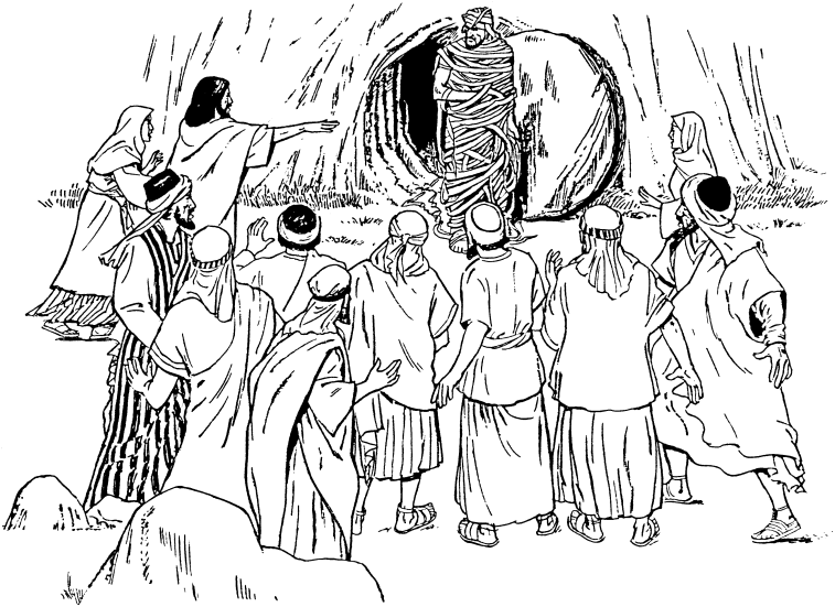
Xechon Lázaro (San Juan 11:44)

manta, ko ngakon jisia inaa manta. Ko Jesús ndachro: