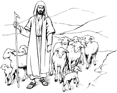
Jesús, thi jian thingaria kuleko (San Juan 10:11)

inaa chujni narua, ko xru'in sitje'en na. 11 Ja'an thi chujni jian thingaria kuleko, ko thi jian thingaria kuleko xrajon de'en ixin je'e ba, 12 aro thi thjenge'e na 'na ixin thingaria kuleko, are dikon thii kundanixra, je'e sathinga ko tathinthu'e ba ixin je'a kulekue, ko kundanixra duen ba ba ko tunchjekee ba. 13 Ko thi dacha ixin thingaria kuleko, ndusen'a ixin je'e ba.