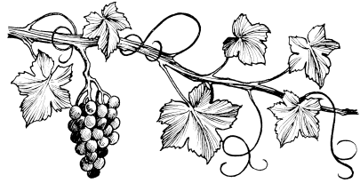
Jesús thi ndua ntha uva (San Juan 15:1)

15 1 Ja'an thi ndua ntha uva, ko Ndudana thi nche'e xra ngain ntha. 2 Ko kain chaan ntha uva dajon'a thuchjuin, Ndudana tsunchrijin ntha, ko kain chaan ntha dajon thuchjuin Ndudana sincherua ntha ixin sajón ntha icha thuchjuin. 3 Ko ja'a ra ukurua ra