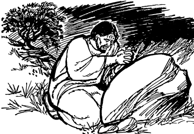
Jesús nichjee Ndo Dio ngain Getsemaní (San Marcos 14:35)

35 Ko Jesús sakjui nchion icha kjin ko nthi'a bethuxin ko biseta'a nunthe ko nichjee Ndo Dio. Ko banchia ixin ja nchao, rugatho'a thi anto tangi ruku'en. 36 Ko are jinichjee Ndo Dio ndachro: