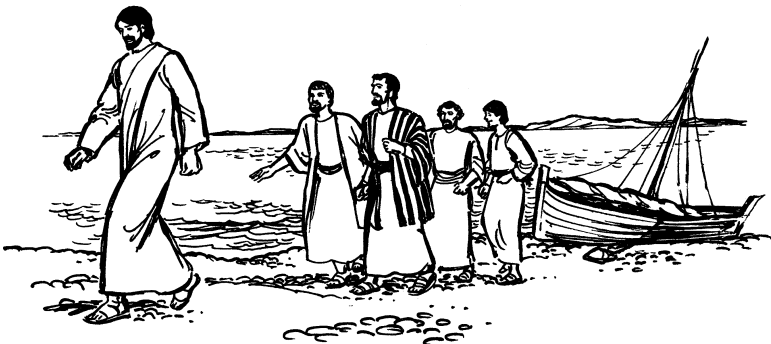
Jesús bayee noo xii banthetse kucee (San Marcos 1:16)

21 Kuthimejan Jesús ko ni bayee biji na ngain rajna Capernaum ko are binkee ncha'on nchejuga'a