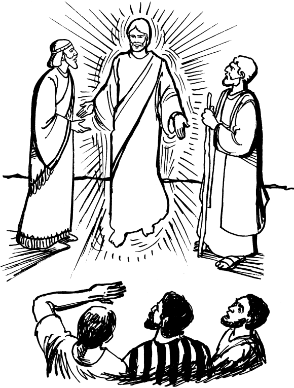
Bikon na Jesús anto ujee (San Mateo 17:1)

ja'an ná sinthachjian ná nii nchiachjan: naa nchiachjan ixin suixin, naa nchiachjan ixin Moisés ko inaa nchiachjan ixin Elías.