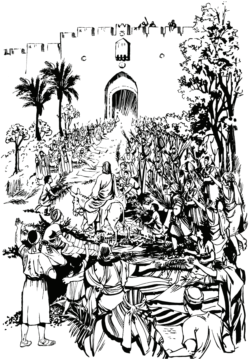
(San Juan 12.13)