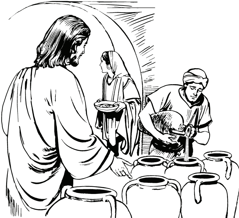
(San Juan 2.7)

—Ahri suturire acore pio sã nemoña. Quehnoano wahpo dapoya, nidi Jesu.