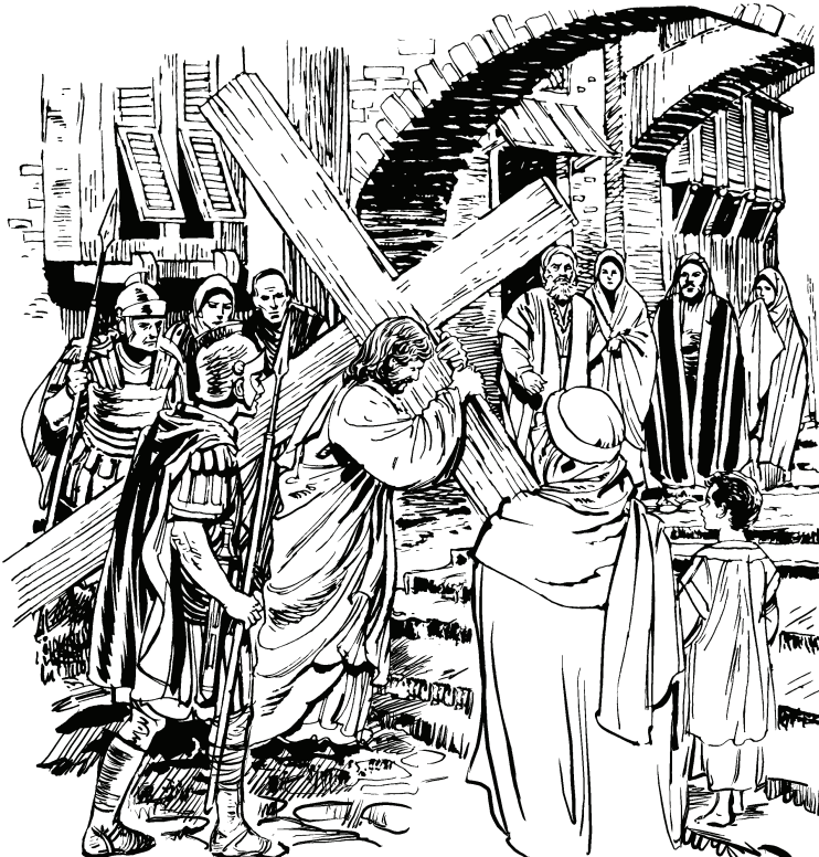
(San Juan 19.17)

Sa ye tiqaina Jesure ne wijjari. 17 Tiqaina ne wijjagũ Jesu pehe tiqairo ya curusare tiqairo basi wɛa ne, dapu pehtoro wame tiropɛ esari. Usã judio masa ye mehna Gólgota wame tiri. 18 Topɛ esaye tiqaina Jesure quẽ biha ohõri. Sa ye apequina pɛarore ihcãqairo tiqairo poto pehe, apeqairo tiqairo cũ pehe pehe quẽ