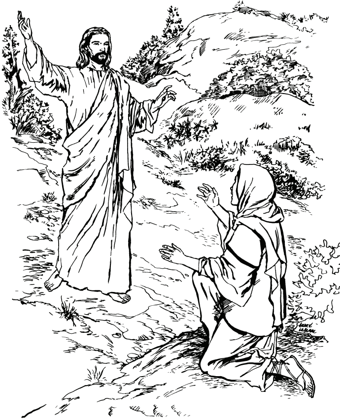
(San Juan 20.16)

25 Tiquiro sa mariedagū usā mehna cjēna tiquirore yahumedi.