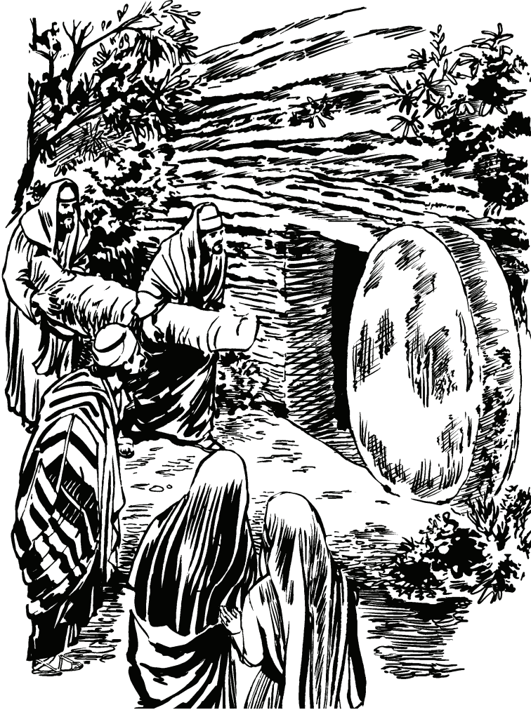
(San Juan 19.40)

tiqairo dapu timediroꝑu dujiahye. Apeqiro tiqairo dahpocāri timediroꝑu dujiahye. 13 Tiqinare ticoro ihñagũ tiquina pehe ticorore sinituahye: