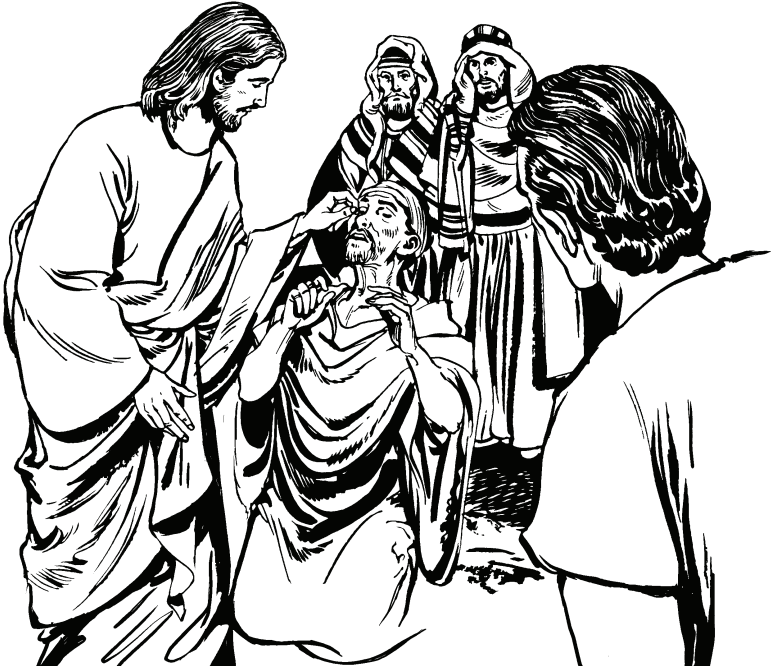
(San Juan 9.6)

Siloé usâ ye mehna niñe “Ohori cope”, niñe nidi.