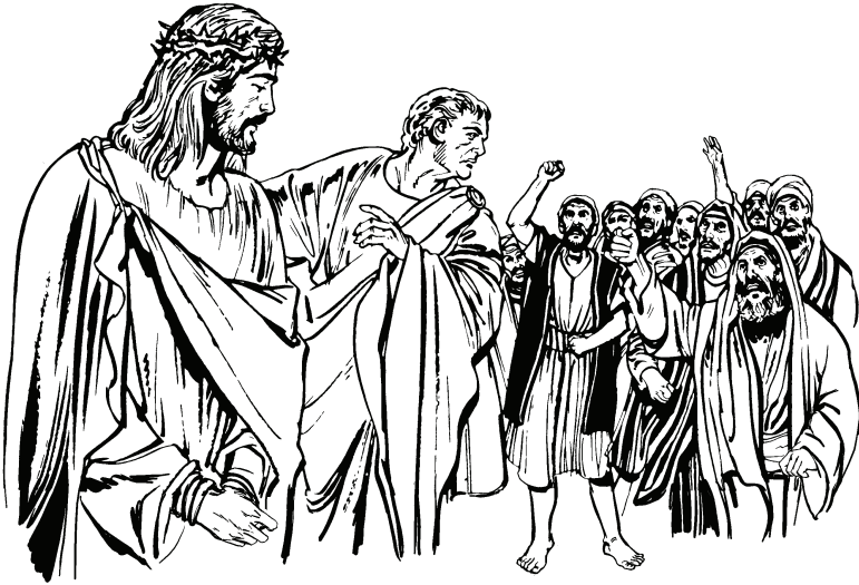
(San Juan 19.3)

8 Tiquina sa nigū tūhoro cue yūhdūa wahari Pilato pehe. 9 Sa yero pari turi wūhūpūre majare sajā, Jesure sinituahye tja: