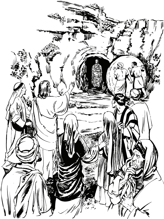
(San Juan 11.44)

tiquinare. 47-48 Sa ye pahia puhto, fariseo masa puhto gũhu cahmecoa, tiquina basi ohõ saha ni yahuducuahye: