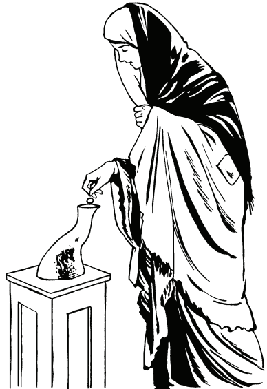
(San Lucas 21.4)

—Quehnoano yeya musa. Sa yena musare apequina tiquina ni mehoñene tuhueracãhña. Peyequina masa “Cristo ijiaja yuhu”, ni mehoñequina ahtaeta. Sa niñe, “Yojopure pihitiati deco ijia to mehenogã duhsare”, nieta. Tiquina sa nigũ tuhueracãhña. 9 Sa ye apequina “Cahme wejẽne nine”, musare nieta. “Yojopure puhtoare masa cohãne nine”, nieta. Musa tire tuhona cueracãhña.