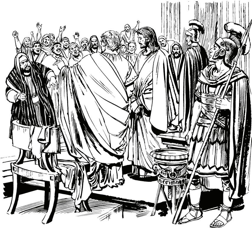
(San Lucas 23.18)

22 Tiquina sa nigũ Pilato ihtia taha waro ohõ saha nimahye tiquinare: