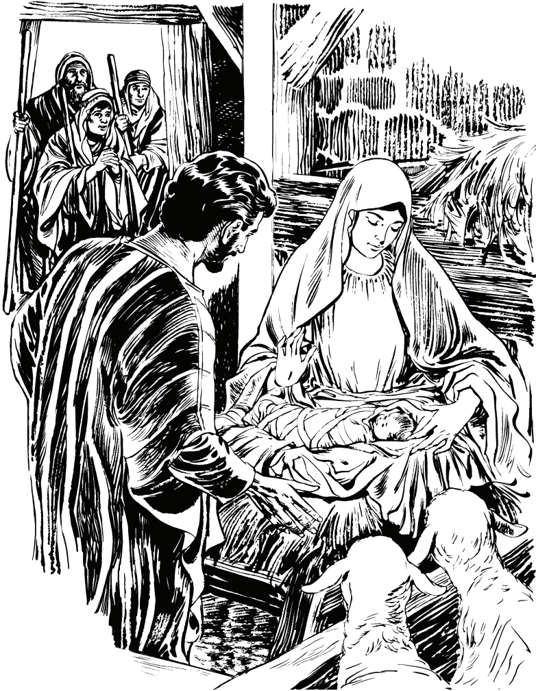
(San Lucas 2.16)

tiqiro yahurire yahuahye apequinare. 18 Tiquina sa ni yahugū ijipihtiyequina tiquinare tūho maria wahahye. 19 Ahri ijipihtiyere María wacū tūhotuahye. 20 Sa yeye ovejare ihña ihboyequina pehe angel tiqiro yahuriro saha ijigū ihñañe, “Cohācǰū tutuariqiro ijire”, ni bucueahye. Sa ni bucueye tojoaa wahahye.