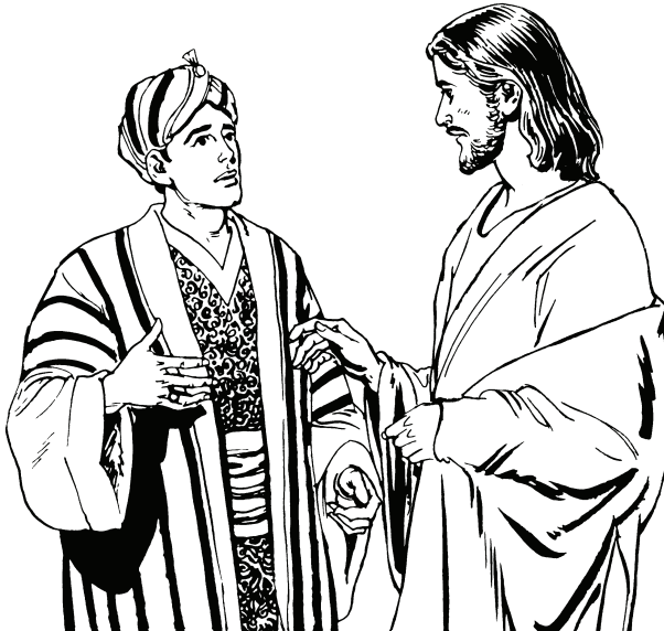
(San Lucas 18.18)

22 Tiquiro sa nigũ tũhoro, Jesu tiquirore ohõ saha ni yahuahye: —Mehenogã dũhsare m̄hũre m̄hũ ye pehoati. Ijipihtiyere m̄hũ yere duagũ wahaya. Sa yegũ ijipihtiyeh m̄hũ wapatari niñerure pejesũoyequinare ohoya. M̄hũ sa yegũ peye m̄hũ ye uhmũserũ, Cohãcjũ cahapũ ijirota. Sa ye tuhasagũ yũhũ mehna cjũ ijicjũ ahtaya, niahye Jesu tiquirore.