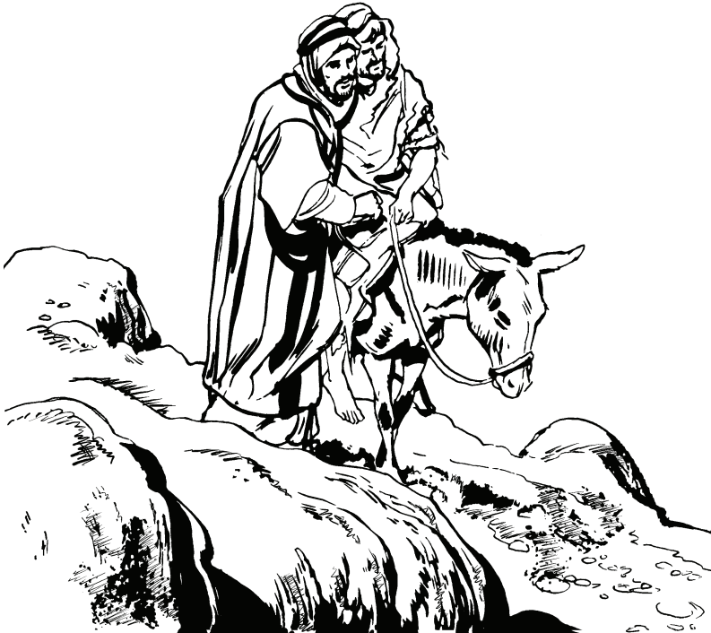
(San Lucas 10.34)

—Wahaya. Mũhũ gũhũ masare sata yei wahaya, niahye Jesu buheriqirore.