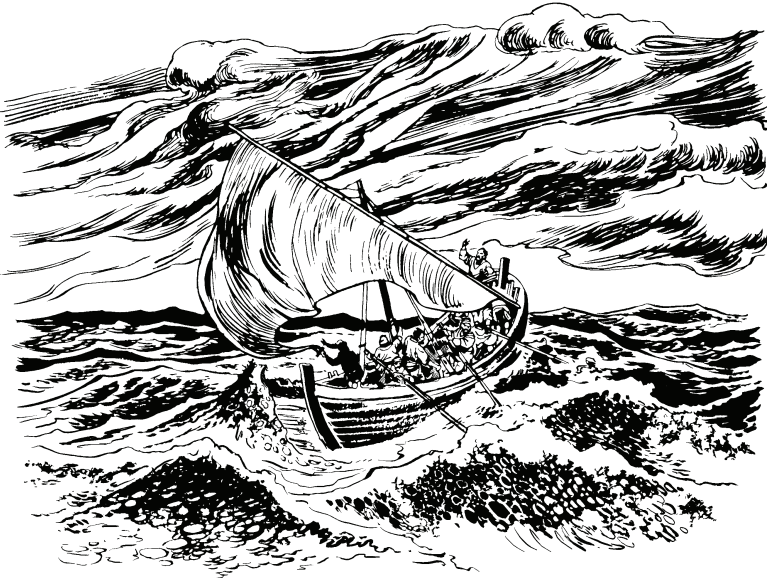
(San Lucas 8.23)

—¿Yohou, dũhse ijiriquiro boro masũno ijijari ahriquiro? Ahri wihnono, pahcõri gũhũ tiquiro dutigũ yũhdũdũcaerare tiquirore, niahye tiquina basi.