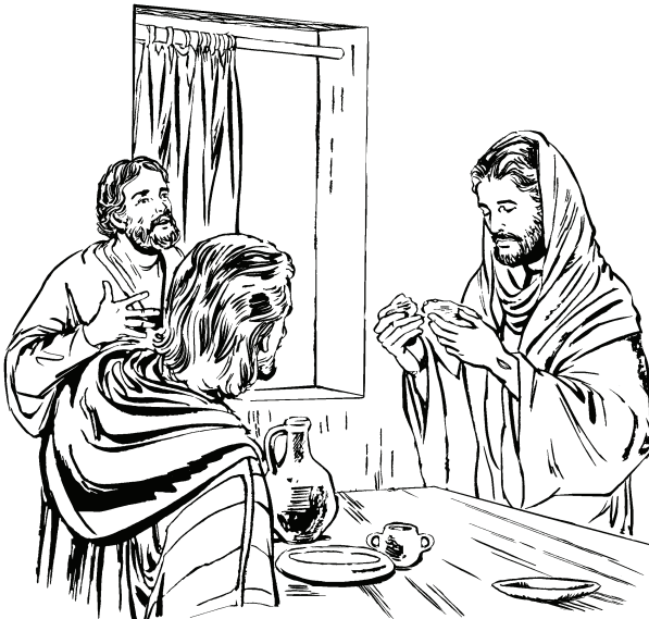
(San Lucas 23.30)

—Jerusalẽ cjãna numia, yũhure utieracãhña. Mûsa ye ijiatire, mûsa pohna ye ijiasi gũhure utiya. 29 Apeye decori ijigũ ña yũhduaro yũhdũnata mûsa. Ti pjere masa ohõ saha nieta. “Pohna mariena numia, pohna tiena numia, apũoedari