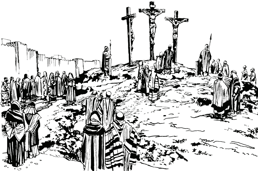
(San Lucas 23.33)

—Mũhũ judio masa tiquina pũhto ijigũ mũhũ basi yũhdũya. Sa yegũ yũhdũ witigũta mũhũ, ni, bũjũpeahye tiquina.