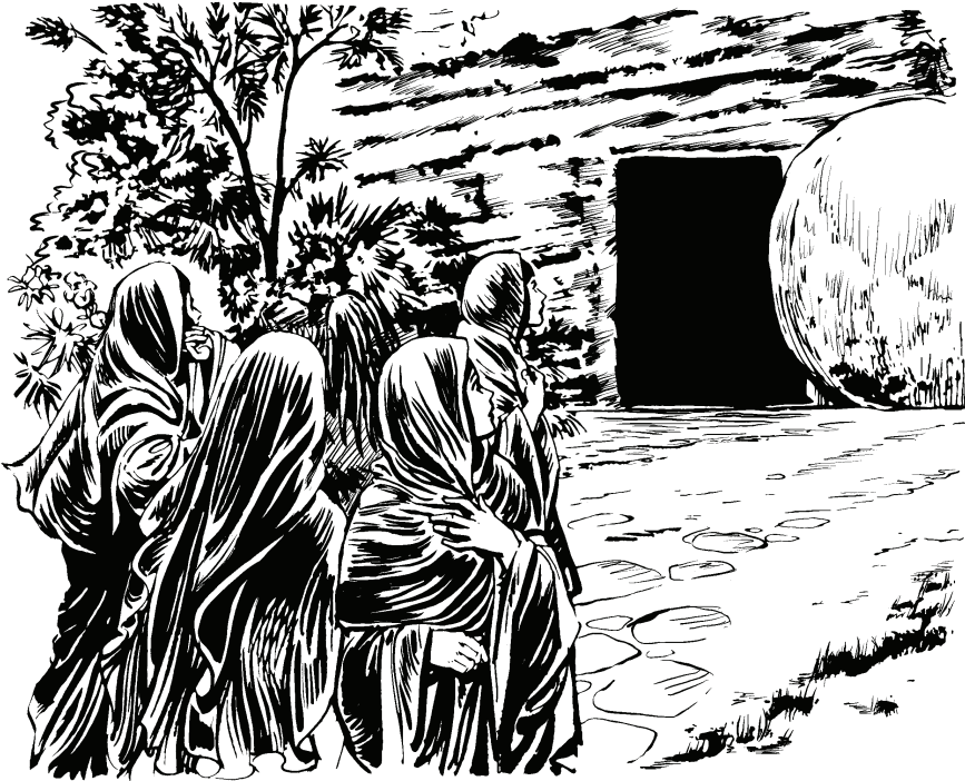
(San Marcos 16.4)