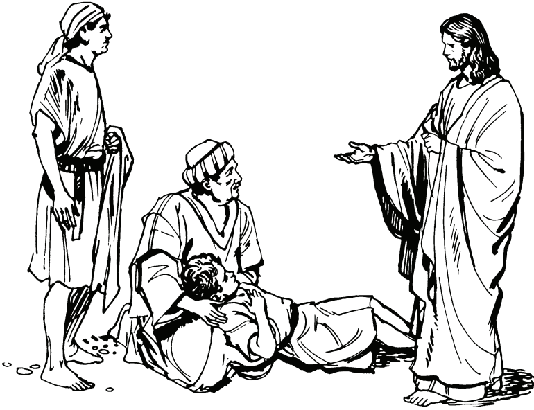
(San Marcos 9.20)

21—¿Noho puno yuari pje watĩnore c̄soajari ahriquiroy? ni, sinituahye Jesu pehe tiquiroy pacurore.