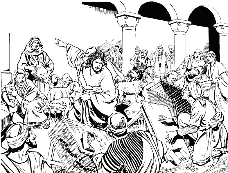
(San Marcos 11.15)

15 Tiquiro sa yeri bato tiquina Jerusalēpũ esahye. Topũ esaro, Jesu Cohācjũ ya wũhũpũ sajā saro apee boro duayequinare, dũyequina gũhũre cohā wioahye. Sa yero niñeru comesaye mesarire yo wahcũ, ne majare cũ mũjahye. Bujuaare duayequina tiquina dujiye pahtari gũhũre sata yeahye. 16 Sa yero apee borore ne sajā dutierahye masare. 17 Sa yero Jesu ohũ saha ni buheahye tiquinare: