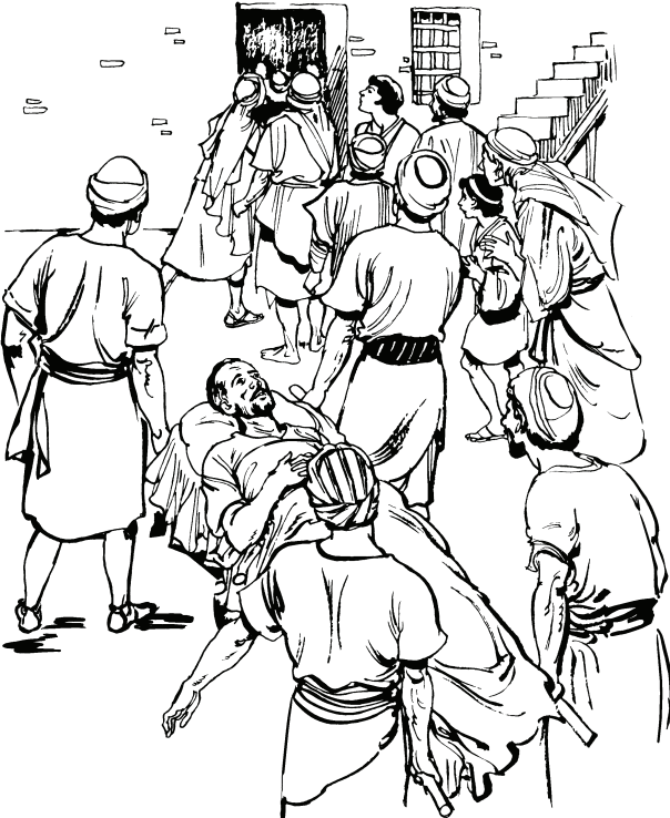
(San Marcos 2.4)

—¿Dũhse yena mũsa sa ni tũhotuajari? 9 “Mũhũ ñañe yerire cohã tuhasaja”, yũhũ nigũ, “Ni mehogu ijire”, yũhũre nina nine mũsa masiedapenata. Tiquiro tini masieniquiuro “Wahcãdũca, wahaya”, yũhũ nigũ, tiquiuro tinigũ ihñana yũhũ nidi potota ijigũ duita masinata mũsa. 10 Yũhũ masũ Cohãcjũ ohorigũ ahri yehparũre masa tiquina ñañe yerire cohã masiaja yũhũ. Yũhũ sa cohãrere mũsa masiatio saha ohõ saha tiquiuro wahagũ yeitja, niahye Jesu judio masare buheyequinare.