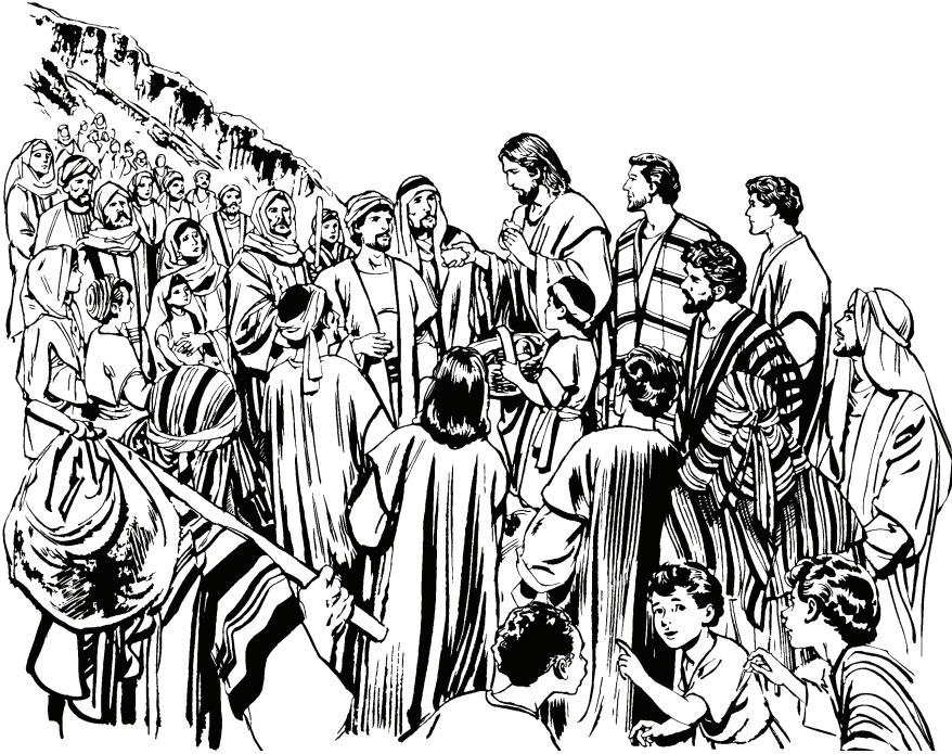
(San Marcos 6.39)

ihcāquirola tiquina pehā tariropu ijiahye. 48 Sa yero tiquina ñano yuhdu wajagū, tiquina pano wihnono wēgū ihñadoqueoahye tiqiro. Sa yero bohrea mija tato pano tiquina cahapu esaro, aco bui tini cā wahahye. Tiquinare tiqiro yuhdu cā duamahye. 49 Tiqiro yuhdu cā duepegūta tiqirore aco bui ahtagū ihñañe, cue niahye. “Yariariquiro ijiboaga”, ni ihñamahye tiquina. Sa ni tūhotuye tiquina sañuducuahye. 50 Ijipihtiequina tiqirore ihñañe, ihña maria wahahye. Tiquina sa ihña mariagū ihñano Jesu tiquinare yahuahye: —Wacū tutuaya musa. Ne, yuhure cueracāhña. Yuhuta ijiaja, niahye tiquinare.