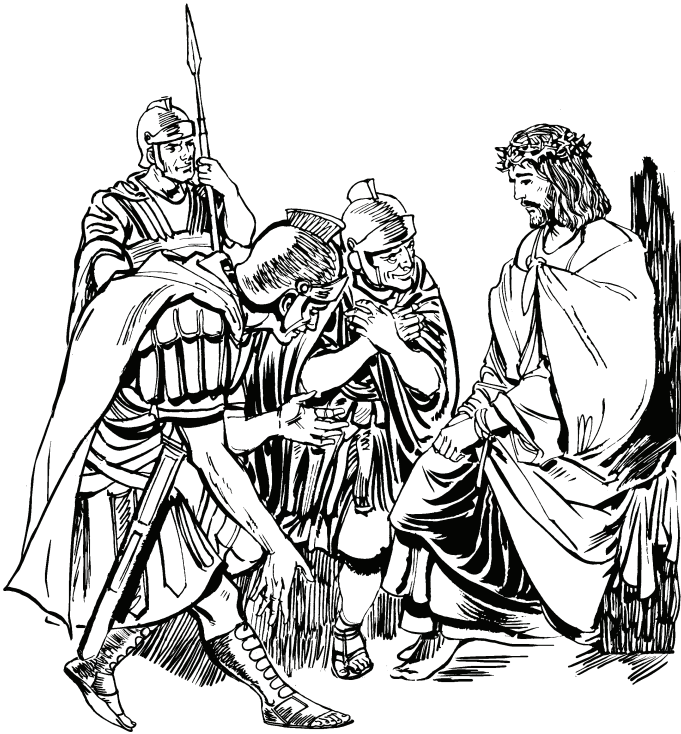
(San Marcos 15.19)

31 Tiquina yero sahata pahia puhto gũhũ usã judio masare buheyequina gũhũ tiquirore sa ni bujũpeahye. Sa ni bujũpeye ohõ saha niahye tiquina basi: