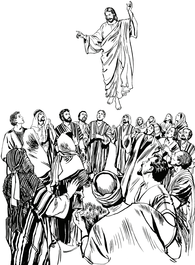
(San Marcos 16.14)

—Ahri yehpa ijipih̄tiropɔ quehnoañe buheyere ijipih̄tiyequina masare buhena wahaya. 16 Yũh̄re wacũ tutuayequinare tiquina wame yenhriquinare pecapɔ wahaboriquinare yũhd̄orota Cohãc̄jũ. Sa ye yũh̄re wacũ tutueyequina Cohãc̄jũ