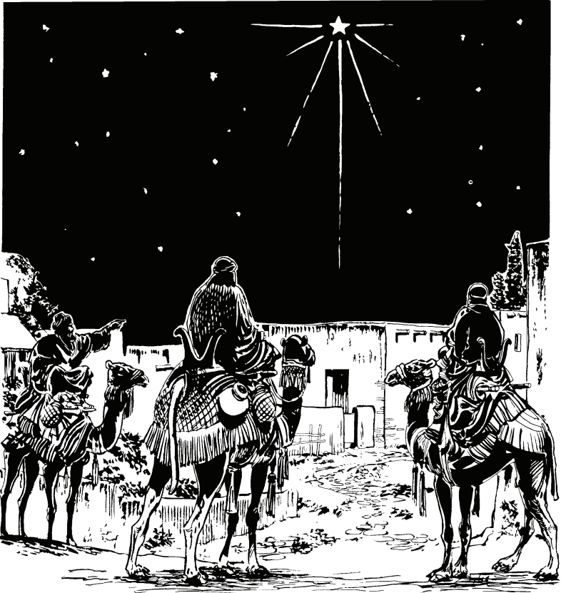
(San Mateo 2.2)

3 Sa ye apequina Herodere tire yahuahye. Tiquina sa yahugū tūhoro Herode pehe bujua witi tūhotuahye. Sa yeye ijipihtiyequina Jerusalē cjēna gūhū tiquiro yero sahata bujua witi tūhotuahye tiquina gūhū. 4 Sa yero Herode pehe ijipihtiyequina pahia pūhtoare, mari judio masare buheyequina gūhūre tiquiro piji cahmecoa peho, tiquinare sinituahye tiquiro: