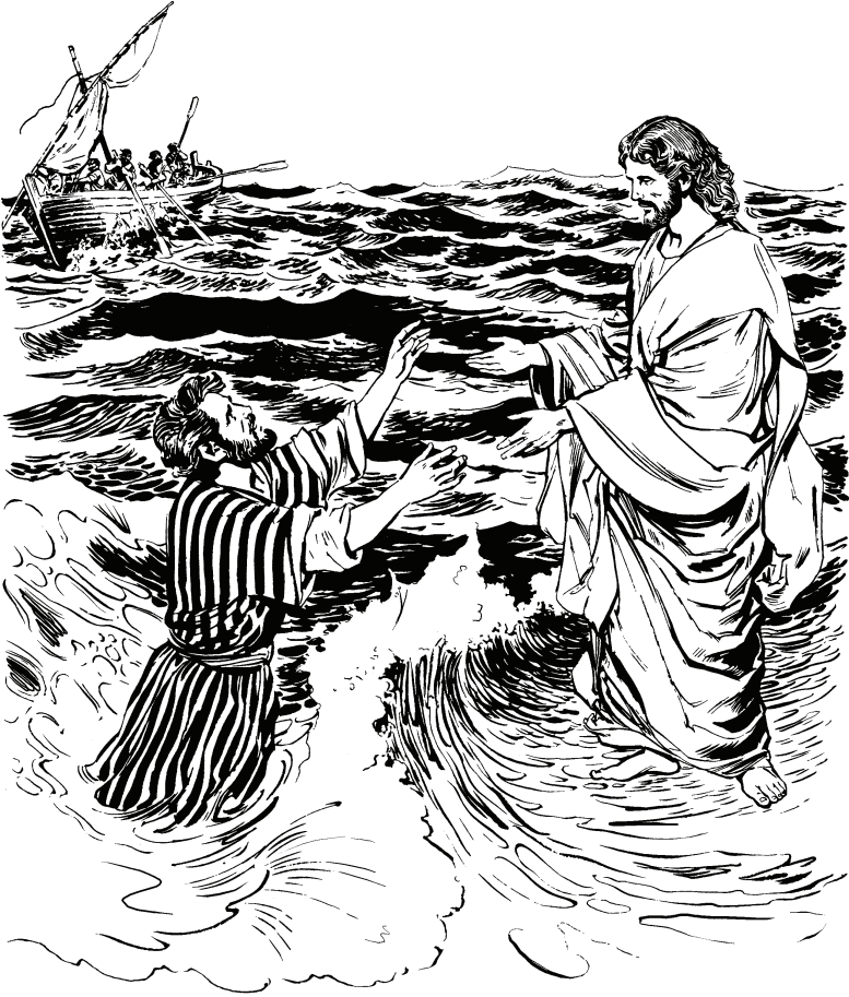
(San Mateo 14.29)

Tiquiro sa nigū Pedro yucusare dijia, aco bui Jesu cahapū ducu cāmedi.