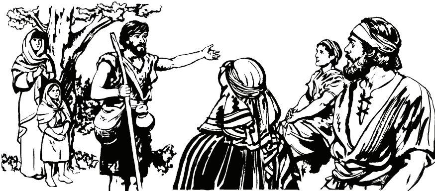
(San Mateo 3.11)

—Aña yero saha ña yãhdũana ijire m̄sa. M̄sa ñañe yerire b̄j̄ua witi duerana Cohãcǵũ m̄sa ñañe yeri buhiri tiquiro buhiri dahreato pano duhti masiedare m̄sa. 8 Sa yena potota m̄sa ñañene b̄j̄ua witiya. Quehnoañene comesaya. Sa yena quehnoañe pehere yeya m̄sa. 9 Ohõ saha ni tuhhotueracãhña: “Panopꝛ cǵũno Abrahã mari ñescũ m̄n̄ano ijie tiahye. Sa yena tiquiro panamena iji turiana ijina mari Cohãcǵũ yequina ijiaja”, ni, tuhhotueracãhña m̄sa. M̄sare niita njaja. Abrahã panamena iji turiana ijimene m̄sa. M̄sa sa ijiepegũta ti m̄sa sa ijyie dũhseati ijierare. Cohãcǵũ pehe ahri utã paca mehna Abrahã panamenare dojogũ ye masine. Sa yero Abrahã panamena iji turiana m̄sa ijyie ihyo waro ijire utã paca ti paca ihyo waro ijiro sahata. 10 Ohõ saha ijire: Masa yucãri yero saha ijire. Cohãcǵũ pehe yucãrre quẽatiare comeare c̄uoriquiro yero saha ijire. Sa yero ñañe dũca tiye cǵũre quẽ cohã, ti nuhcori gũhũre dũte surerota. Dũte sure tuhasa, pecarũ ẽj̄ũanota tiquiro ti cǵũre, nuhcori gũhũre. Sata yerota masa gũhũre tiquirore cahmeeñequinare. 11 Yũhũ bato yãhũ yãhdũoro tutuariquiro ahtarota.