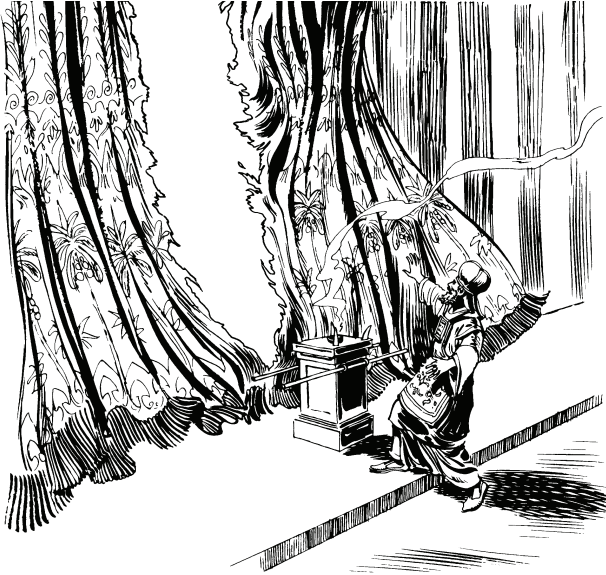
(San Mateo 27.51)

yequina m̄na paṇoṇ yariariquina m̄na masa wijiāhye. 53 Masa wija, Jesu masa wijiari bato ti coperire cohā cā, quehnoari macap̄ Jerusalēp̄ wahari tiquina. Top̄ tiquina wahagū peyequina masa ihñāhye tiquinare.