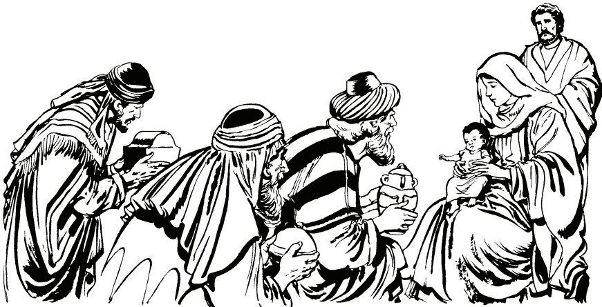
(San Mateo 2.11)

—Wahcãña. Herode pehe nijinogãre wejẽno taro, macano nine yojopũre. Sa ye nijinogãre tiquiro pacoro gũhũre Egiptopũ ỹmũñano ne duhti cãa wahaya. Topũre yũhũ nidiro punota ijiya, tee yũhũ yahugũpũ, ni yahuahye angel Josere.