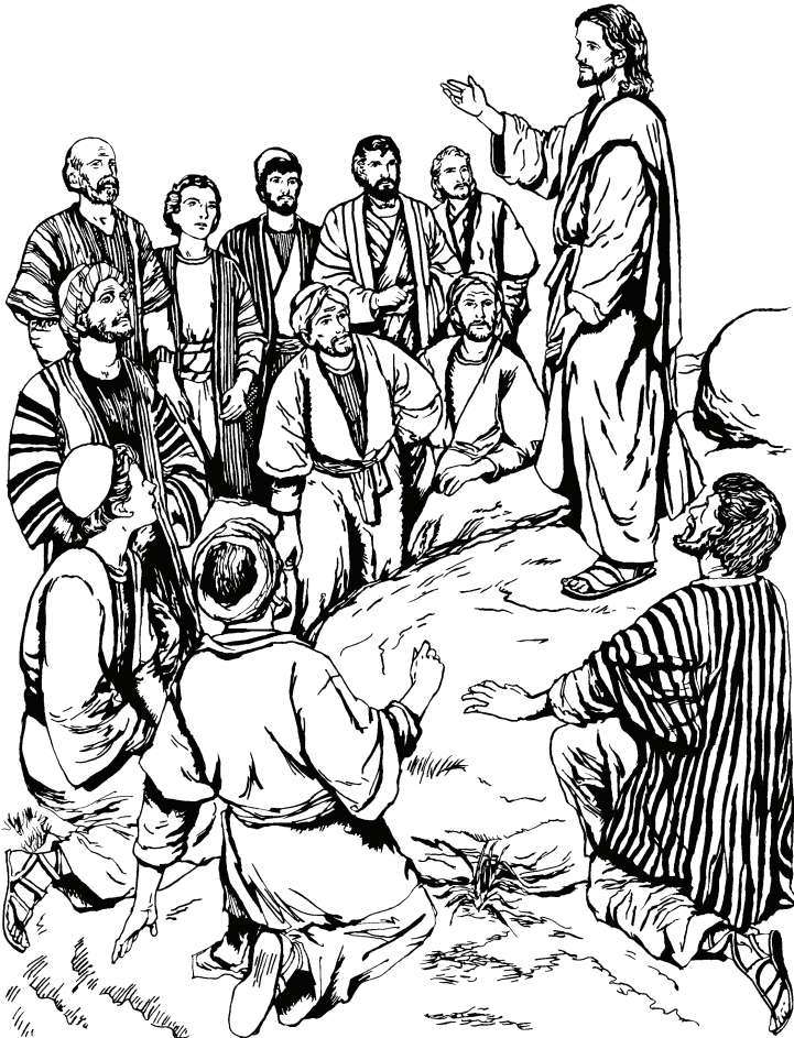
(San Mateo 28.20)

10 —Cueracãhña mũsa. Yũhũ bahanare “Galileapũ wahaya”, ni yahuna wahaya. Topũ yũhũre ihñaeta tiquina, niahye Jesu tiquireo.