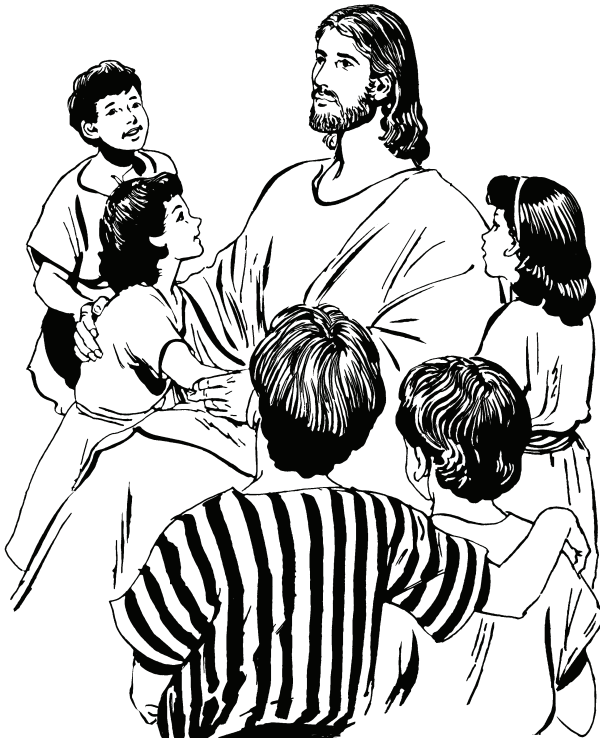
(San Mateo 18.14)

—Mũhũ acayuro mũhũre ñano tiqiro yegũ tiqiro mehna yahugũ wahaya. Mũsa sehsaro tire yahuya. Mũhũ sa yegũ tiqiro mũhũre tũhoboaga. Tiquiro tũhogũ “Mũhũre ne pari turi ohõ saha yesi yũhũ”, tiqiro nigũ mũhũ acayurore pari turi piti tigũ niaga mũhũ. 16 Mũhũre tiqiro tũho dueragũ pũrita ihcãquiro mehna waha duagũ o pũaro mehna waha duagũ tiquinare piti ti cã, pari turi tiqirore yahuna wahaya. Mũsa sa yena pũana o ihtiana tiqirore mũsa yahusãgũ, “Poto tjire”, ni masieta apeqũna. 17 Sa yena mũhũ mehna cjeña gũhũre tiqiro tũho dueragũ ijipitiyequina Jesu yequina cahmecoãnequinare yahusãna wahaya. Sa yena Jesu yequina cahmecoãnequinare tiqiro tũho