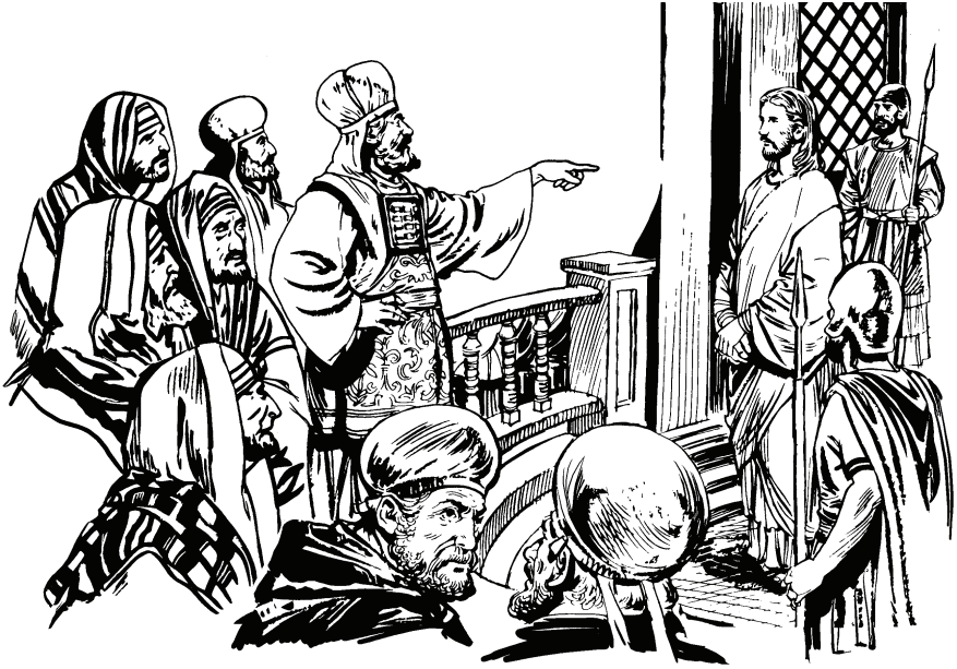
(San Mateo 26.62)

—¿Noa pehe m̄hure quēajari? Cristo ijigū ih̄nedapeguta yahuya us̄are, ni buj̄upeahye tiquina.