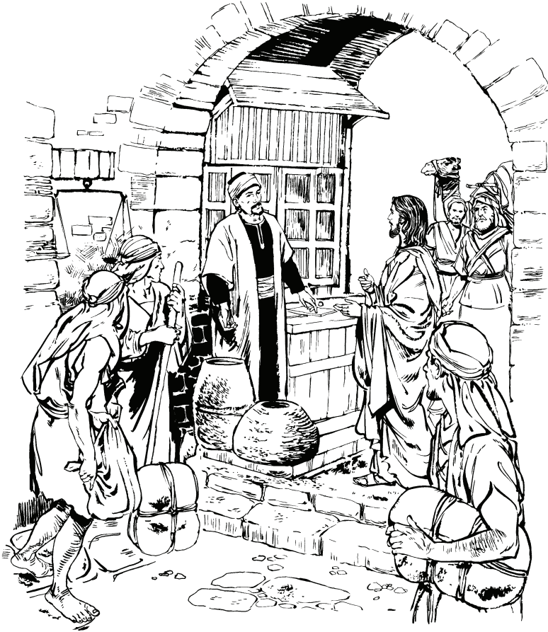
(San Mateo 9.9)

—Ohō saha ijire ti: Omoca dūhteropu tiquina pijioriquina omoca dūhteriquiro mehna ijiye, siji masiedare. Sata yūhu buheyequina gūhu yūhu mehna ijiye, siji masiedare. Yūhu omoca dūhteriquiro yero saha ijiaja. Omoca dūhteriquiro bose deco tiquiro yegū tiquiro mehna cjēna bujūa witiye mehna ijierare. Sa yeye ihyeyequina ijierare. Yūhu Pacu Cohācjū yūhure tiquiro nedi bato pūritare yūhu buheyequina mehna ijisi yūhu. Sa yeye ti pjeṗata yūhu buheyequina gūhu sijieta, ni yūhtiri Jesu.