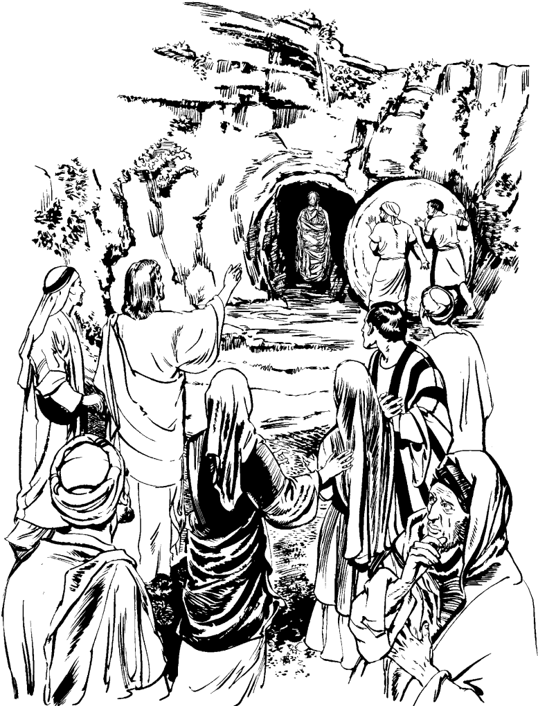
(San Juan 11.44)

—Lasaro, tyāajū mcaasej jī'tspcachja', 44 uusá' ityi yuurra casejc, chinda, cuse pety dyi'p yā'jrra yapni. Atsa' Jesusa' cjimbcacj u'jya' ājācajn.