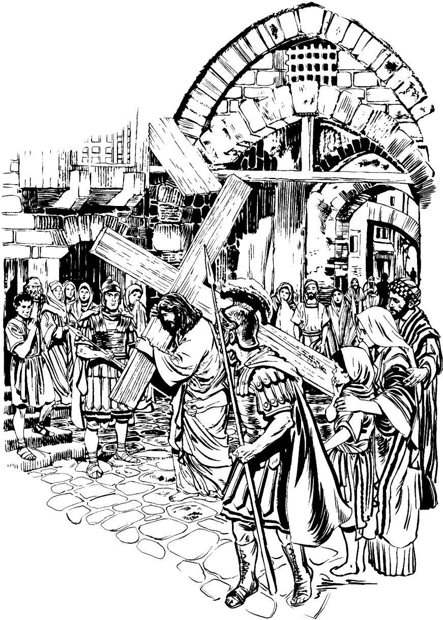
(San Juan 19.17)