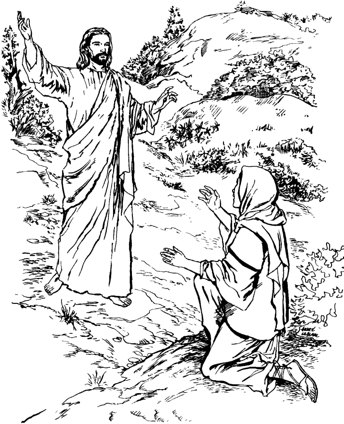
(San Juan 20.15)

—Jonas nchi'c Simon ¿andya's wendyi'ngá'? jíte!, Pedro pasrra!: