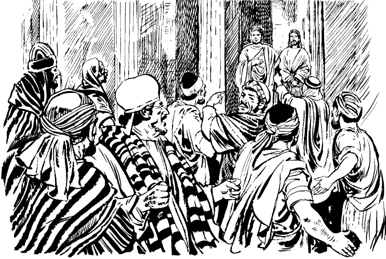
(San Juan 18.29)

—¿Iindy úusuj yajcyrranga tyā'jī'á? meerra' ¿vitesa tyā'jīna andya's cysuusni's wēse'jrravá'nga tyā'jī'? jīte', 35 Pilato' na'wēc pas: