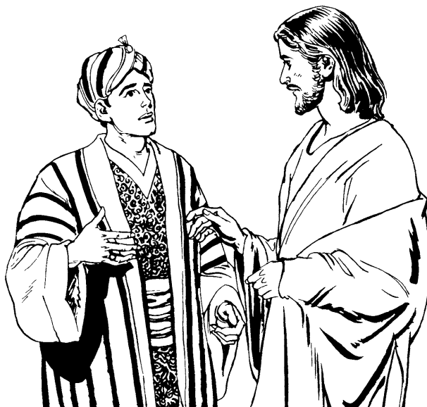
(San Lucas 18.22)