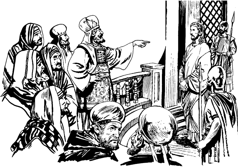
(San Lucas 22.66)

—Naa pitstjê'ja' nasaty caypumba'jna üstetja'w uy, sa' Romate gobierno's ducjwa'jme'. Sa' Dyus tyjityjrra caajnsa andytju jycaajwa'jsa jî'c jîte', 3 Pilato' pējyucu: