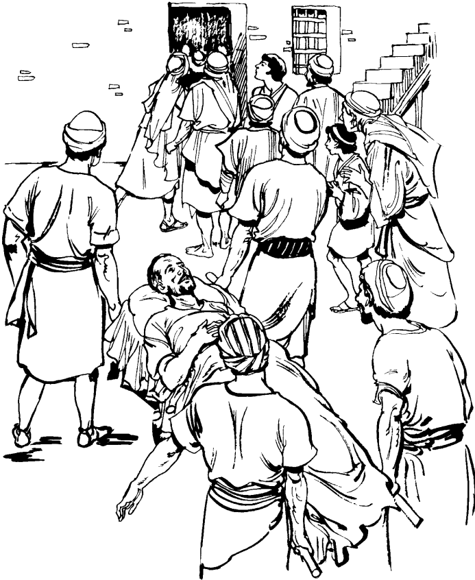
(San Lucas 5.18)

tjēysateva Dyus Nchi'c Nasa Yuusá! naa quiwete pcaltyi peltunāyya' ājāwa'jsa! naa pa'ga caajiyu'jya'vatj āchja' jirra', tyajū' tyāa ēsēya' ājāsameea's we'wec: