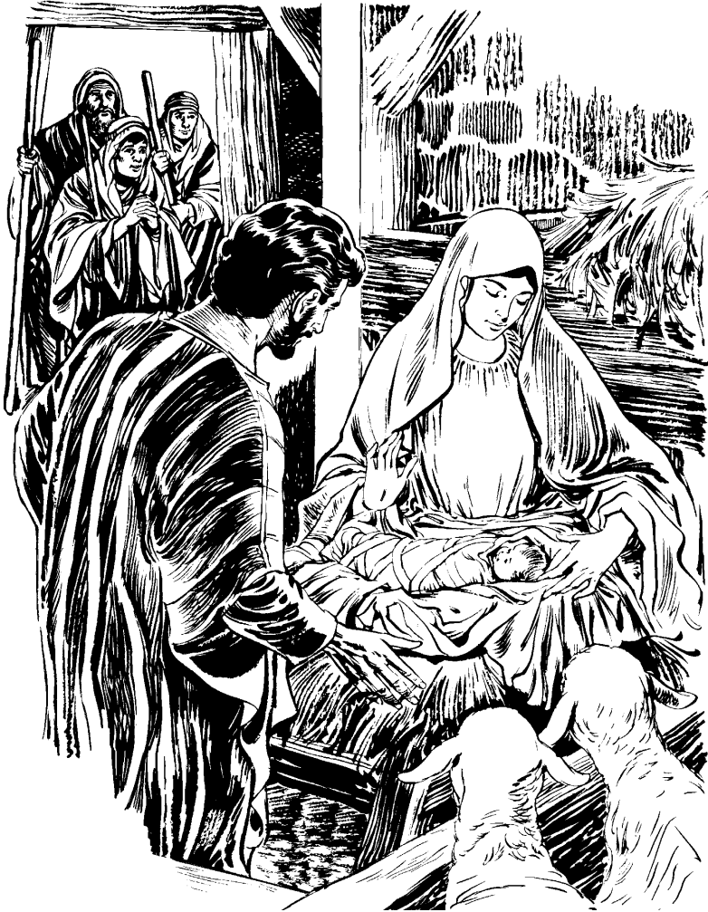
(San Lucas 2.7)

nwe'wewa'jsa pa'jacy? sūjna ūytjāsna. Atsa' Dyus Espiritu' Simeona's caajiyu'cj 26 Nwe'wewa'jsa Dyus caajni Cristo's uume'y uywa'ja's. 27 Sa' Dyus Espiritu' Simeona's caayaqu'lj'cj dyuus yatna u'ljwa'ja's, atsa' u'jrra' uycu tyā'wē Jesu nji'jwe'sha' Dyus ley jycaajni's cytey yuuya' Jesusa's nuypal'jatste. 28 Atsa' Simeona' tyāa luuchcuē's yacjrra na'jīnac Dyusna wecha: