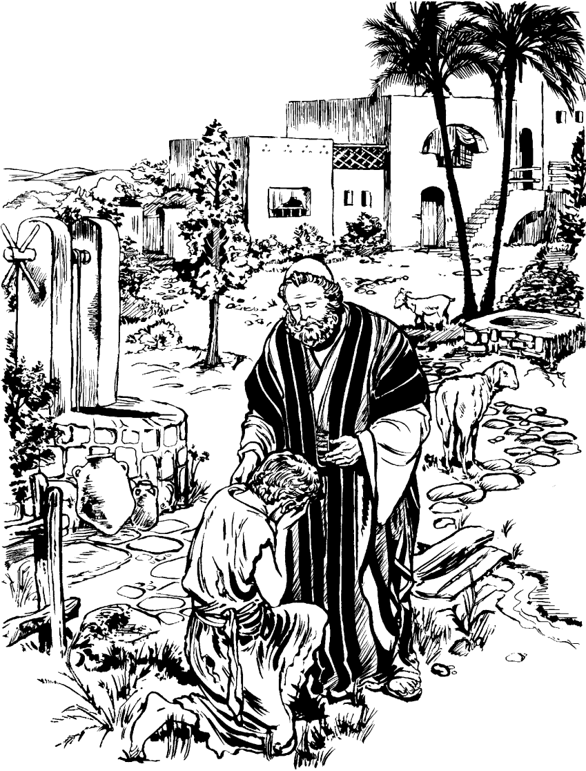
(San Lucas 15.21)

yatte u'caya' wa'lcu. Atsa' neytjē'ja' casejrra wala pytjaa we'wec u'cacajn. 29 Tyajū' tyāa nchi'c yu' na'jīc neya's: Andya' maanzcuēe añu iindy tashte bagach yujva wa'lmée selpiina ūsteva jiing. Nava indya' teech caplacuērrāa yujva iiusmeeng, andy namicuwe'sh yacj fiesta'cjan. 30 Nava iindy nchi'c tyacue wala u'y ewmeesa yacj vyu's psuwna pembasāa yu'sa'