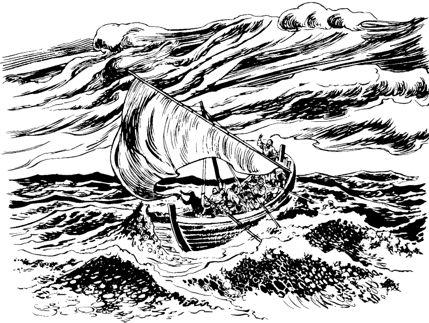
(San Lucas 8.25)

Tyāa pitstjē'lj ūuste wala kuj ech cjēerra ūsu'ty, tyāasac legion yaasetj jīna pas. 31 Sa' tyāa ech luucu vit-sa' Jesusa's pytjaa we'wety cāfy wala seena' ūucjūcjsacjē acjajmén. 32 Sa' cysū tjā'jsū cuchi wala ūsu'ty apjna, atsa' tyāa cuchi ūussu cjēeya' u'jwa'ja'styi Jesusa's pējy pytjaa we'wena. Atsa' Jesusa' cuchi ūussu cjēeya' u'cjaacj. 33 Tyājū' tyāa ech luucu vit-sa tyāa pitstjē'lj ūusu casejrra, cuchi ūussu cjēete', tyāa cuchi' peñacjē pelurra, icj walacjē cjēerra jyuca uuty. 34 Atsa' cuchi tjengsa' tyā'wē yūute uyrra', ūucjrra pta'shya' wala dund u'jty chjambna vite' chjamb peecu'jsuva jyuca. 35 Atsa' quīj yūuteva uyya' nasa' tjengya' pa'jty. Sa' Jesus ūsnite cūjrra', uytyi ech luucu vit-sa' tyāa pitstjē'lj ūusu jyuca casejte', Jesus tashte wēt yā'j ropa atjrra cachrra u'pte. Sa' wala ūucjtyi. 36 Atsa' tyāa pitstjē'lj ech luucu vitnisa' ma'wē yūurra catyjiteva uysa' cytee tjengya' pa'jsaty pta'shtyi. 37 Tyāa pa'garrāa Gadara quiwesuwe'sh jyucaysa ūucjrra Jesusa's tyāa quiweju casejna u'cjaajty. Tyā'jyā'tje', Jesusa' barcote cjēerra qui' shawendcu. 38 Atsa' tyāa pitstjē'lj luucu vitnijū catyjisa' Jesusa's pytjaa we'wec pe'jrra u'cjan. Nava Jesusa' tyajy yatnac u'cjaaj na'jīna: