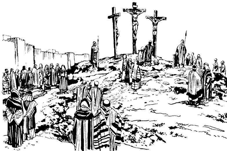
(San Lucas 23.43)

—Isa, naa pitstjẽ'ja' yuuwemeesa yuj yu'ga jic. 48 Atsa' nasa jyucay cytee ñssava tyã'wẽ yũute uyrra', ¿tyã'wẽ yuja' yuumañ? sũjnaty ñusna ñucjna u'j. 49 Atsa' Jesusa's jiisawe'sh vite' Galileajũjy Jesus yacj yuusa u'ywe'sha' jyu'jurrãaty tjengna ñsu' tyã'wẽ yũutste.