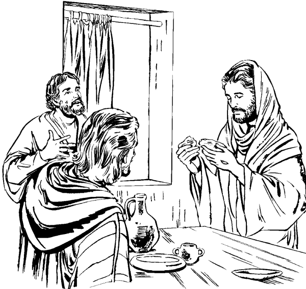
(San Lucas 24.30)

—Isa, cue'shtyi jype'ljsa' qui' ityī yuuyujga atsa' Simonva uyca jīte', 35 Emausu shawendna pa'jsava pta'shtyi dyl'tje ma'wē puuty uyrra we'weni'sva jyuca, sa' pana's tyundendetspcachja' ma'wē yūurra Jesusteva jiyurrava jyuca pta'shtyi.