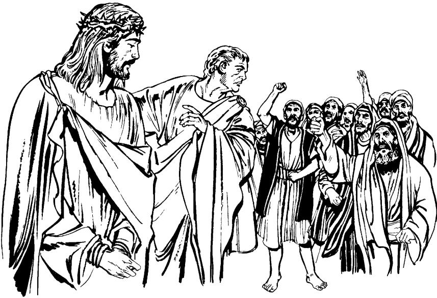
(San Lucas 23.17-18)

uyrra' na'ljityna: Bagach yujva nasa ji'pjurra cchu'chu'jsamée yacja' tyacue ñus yujmeena jityna. 30 Tyajü' nasa' ñusna ũucjna vits wala uperra jyuca icj jytjåasutyna, sa' tjäl'j le'hcuesatyva tyä'wëy yüu jytjåasutyna. 31 Fytüu tash buchatsterráa yujva na'wëty yü' na' fytüu tash ewsa ucawa'l'j en äjte yu' wejy tyä'wë yüutyna jïc.